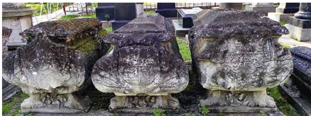
Ил. 4. Саркофаги князей Голицыных из Богоявленского монастыря. Вторая половина XVIII в. Некрополь Донского монастыря.

Гербы на саркофагах подобны друг другу. И на том и на другом можно увидеть воинскую арматуру ленту, обрамляющую гербовый щит. Этим подчеркивается, что князь А. М. Голицын был генерал-майором и сыном генерал-фельдмаршала. В первом верхнем поле – литовская Погоня; во втором поле – эмблема Новгорода; «Корибут» в нижней левой части щита. Единственное отличие – на одном из саркофагов