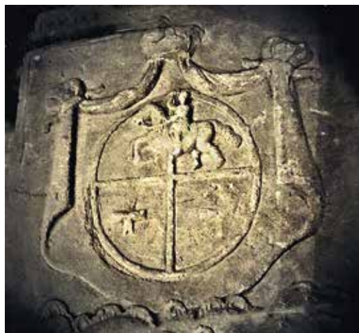
Ил. 2. Герб с саркофага княгини А. М. Голицыной, урожденной княжны Лобановой-Ростовской. 1764. Нижняя Казанская церковь Богоявленского собора бывшего Богоявленского монастыря.