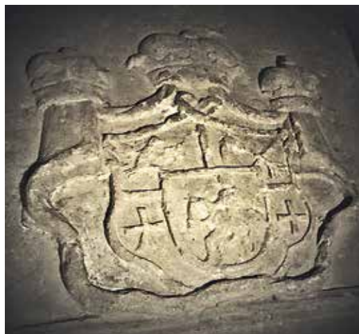
Ил. 3. Герб с надгробия князя М. В. Голицына. 1763. Нижняя Казанская церковь Богоявленского собора бывшего Богоявленского монастыря.