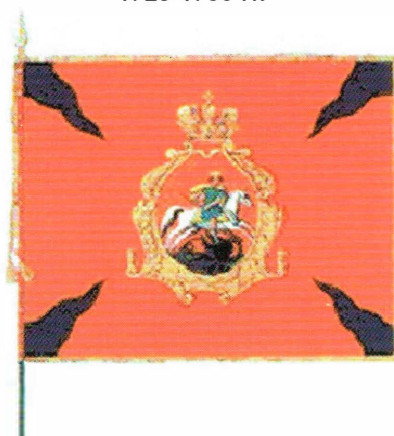
Рисунки проектов полковых знамен начала XVIII в.