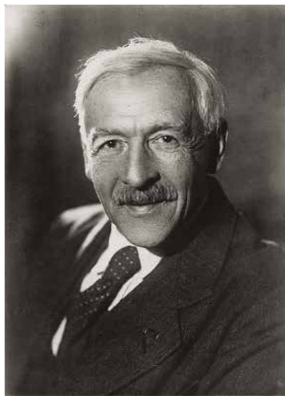
Ил. 20. И. И. Толстой-младший (1880–1954). Государственный Эрмитаж

В 1998 году к 140-летию со дня его рождения, как дань глубокого уважения талантливому ученому и замечательному человеку в Эрмитаже была организована временная выставка «Нумизматическая коллекция И. И. Толстого (1858–1916) в собрании Эрмитажа», позволившая показать большинство раритетов его коллекции и проиллюстрировать его научную деятельность 52 . А в 2008 году Государственным Эрмитажем при участии Санкт-Петербургского института истории РАН, Института археологии РАН, Фонда имени Д. С. Лихачева были организованы Чтения, посвященные 150-летию со дня рождения И. И. Толстого.