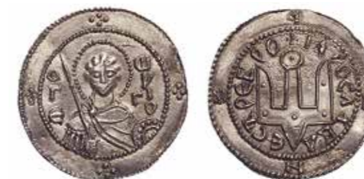
Ил. 10. Древняя Русь. Ярослав Владимирович Мудрый (1016–1054). Сребреник с изображением христианского патрона Ярослава – Св. Георгия. Новгород. Ок. 1015. Серебро. Диаметр 26 мм. Инв. № ОН-Р-1-138. Из собрания С. Г. Строганова. Государственный Эрмитаж