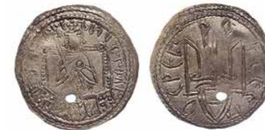
Ил. 7. Владимир Святославич. Сребреник III типа. Киев. 1012–1015. Из Нежинского клада 1852 г. Серебро. Диаметр 28 мм. Инв. № ОН-Р-1-60. Из собрания И. И. Толстого. Государственный Эрмитаж