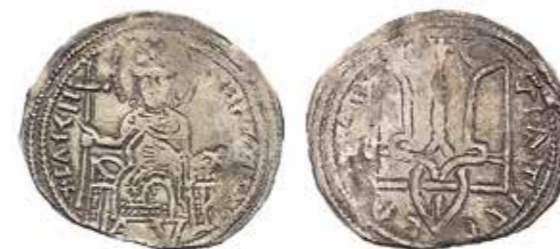
Ил. 8. Владимир Святославич. Сребреник IV типа. Киев. 1012–1015. Из Нежинского клада 1852 г. Серебро. Диаметр 28,5 мм. Инв. № ОН-Р-1-101. Из собрания И. И. Толстого. Государственный Эрмитаж