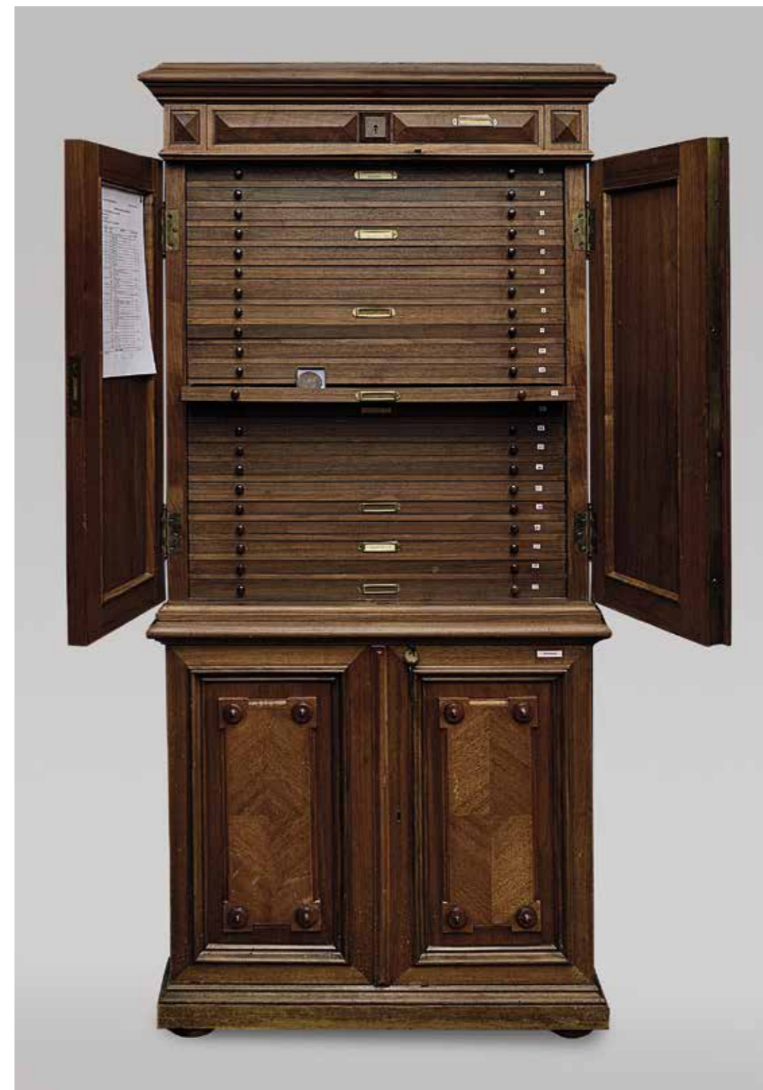
Ил. 19. Монетный шкаф. Один из восьми монетных шкафов, принадлежавших И. И. Толстому и переданных его наследниками Эрмитажу в 1917 г. Дерево, фанеровка дубом, бронза. Государственный Эрмитаж

Монеты и медали из коллекции И. И. Толстого неоднократно экспонировались на различных постоянных и временных выставках Эрмитажа.