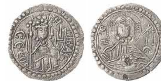
Ил. 5. Владимир Святославич. Сребреник I типа. Киев. 988. Из Киевского клада 1876 г. Серебро. Диаметр 26 мм. Инв. № ОН-Р-1-14. Из собрания И. И. Толстого. Государственный Эрмитаж