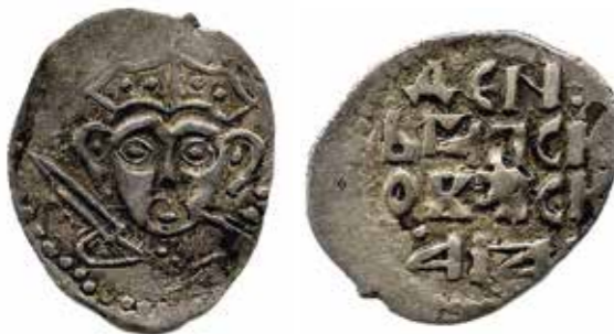
Ил. 12. Псков (1425–1510). Денга. Серебро. Инв. № ОН-Р-1-8106. Из собрания И. И. Толстого. Государственный Эрмитаж

Общее количество всего нумизматического собрания Толстого в феврале 1905 года составляло 32 083 экз., оцененных владельцем в 208 938 руб.