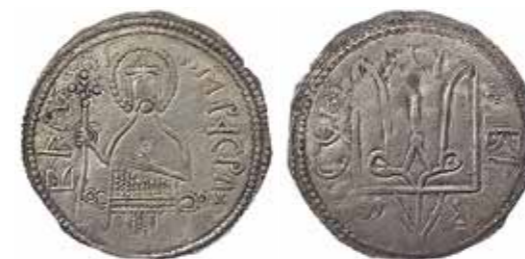
Ил. 6. Владимир Святославич. Сребреник II типа. Киев. 1012–1015. Из Нежинского клада 1852 г. Серебро. Диаметр 26 мм. Инв. № ОН-Р-1-18. Из собрания И. И. Толстого. Государственный Эрмитаж