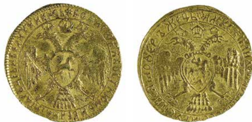
Ил. 15. Россия. Алексей Михайлович (1645–1676). Жалованный золотой в 3 угорских. Золото. Диаметр 30 мм. Инв. № ОН-Р-Аз-86. Из собрания И. И. Толстого. Государственный Эрмитаж