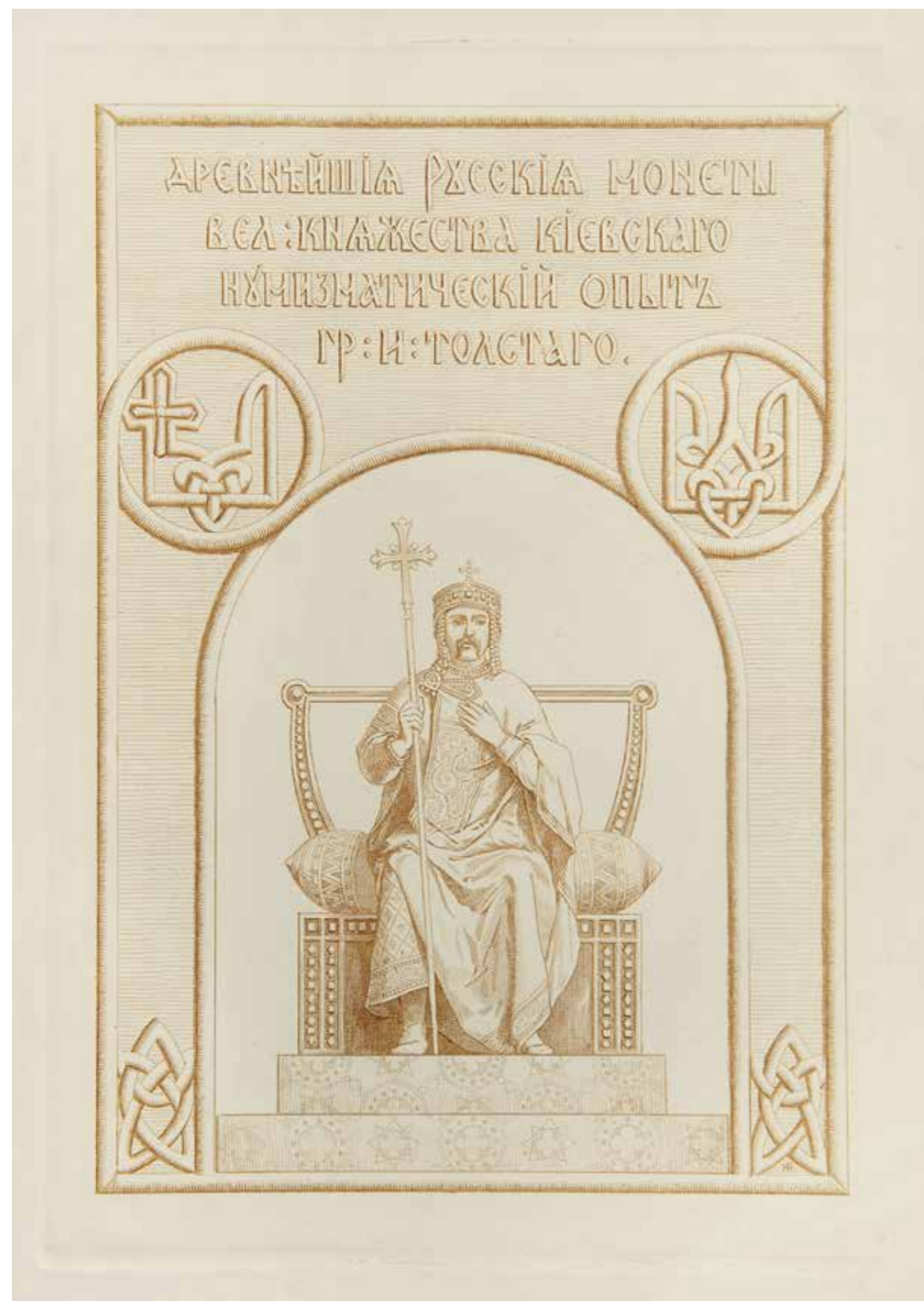
Ил. 3. Толстой И. И. Древнейшие русские монеты Великого княжества Киевского. СПб., 1882. Титульный лист. Государственный Эрмитаж