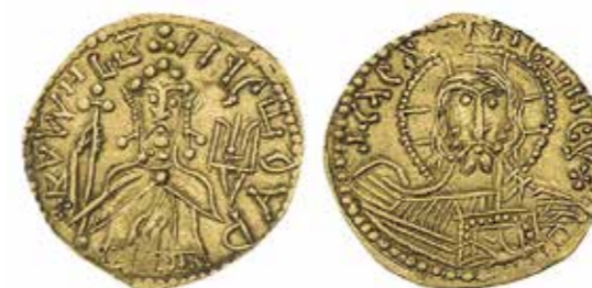
Ил. 4. Древняя Русь. Великое княжество Киевское. Владимир Святославич (980–1015). Златник. Киев. 988. Из Кинбурнского клада 1863 г. Золото. Диаметр 20 мм. Инв. № ОН-Р-Аз-18. Из собрания И. И. Толстого. Государственный Эрмитаж