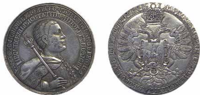
Ил. 14. Россия. Дмитрий Иванович, Лжедмитрий I. Серебряная медаль. Новодел конца XVIII – начала XIX в. Серебро. Диаметр 45 мм. Инв. № ОН-Р-2-14249. Из собрания И. И. Толстого. Государственный Эрмитаж