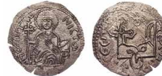
Ил. 9. Древняя Русь. Великое княжество Киевское. Святосполк-Петр Ярополчич (Окаянный). Сребреник. 1016–1018. Из Нежинского клада 1852 г. Серебро. Диаметр 27 мм. Инв. № ОН-Р-1-107. Из собрания И. И. Толстого. Государственный Эрмитаж