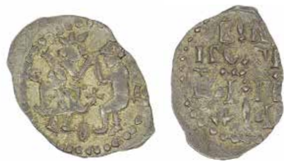
Ил. 11. Великий Новгород. Денга республиканского периода. Чекан до 1478 г. Диаметр 18 мм. Инв. № ОН-Р-1-12663. Из собрания И. И. Толстого. Государственный Эрмитаж