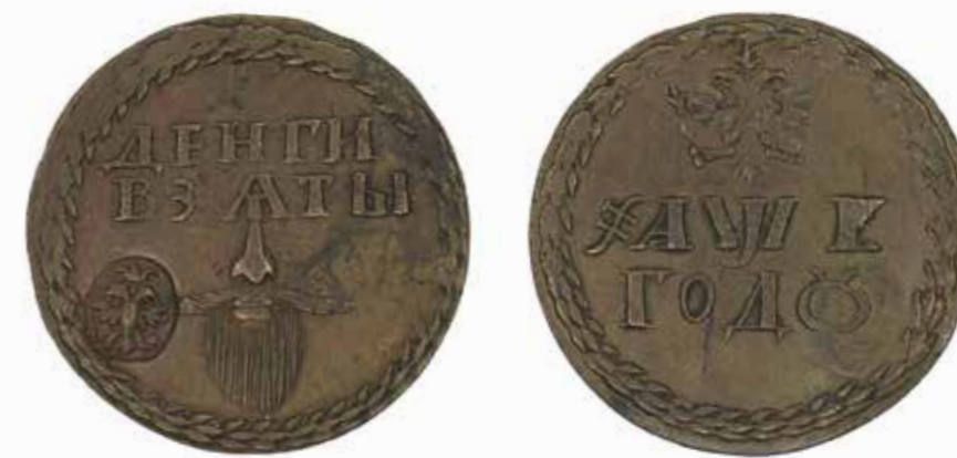
Ил. 17. Россия. Петр Алексеевич. Бородовой знак 1705 г. Медь. Диаметр 23,5 мм. Инв. № ОН-Р-2-17660. Из собрания И. И. Толстого. Государственный Эрмитаж

(1858–1920) 39 . Последний, 20-й ящик был доставлен немного позже, о чем Марков отчитался Д. И. Толстому 3 октября 40 .