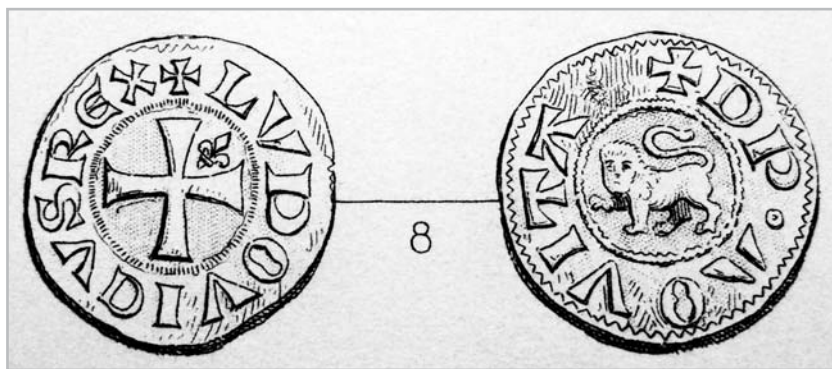
Рис. 1. Денье. Людовик VII

В тяжелые для Франции времена на королевских монетах значительно увеличивается количество геральдических элементов, выполняющих, видимо, прокламационную функцию. Мы видим и оформление притязаний на французский королевский престол, выраженный геральдическим языком, и агитационную борьбу, записанные и рассказанные геральдическим языком. И отражение этой борьбы на монетах, имеющих широкое хождение, — одно из свидетельств все возрастающего распространения геральдики.