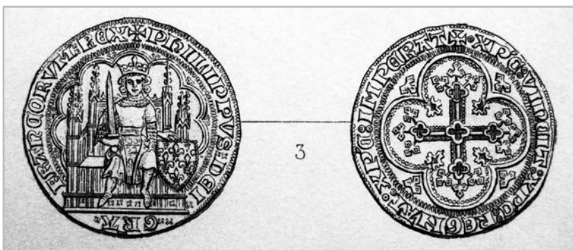
Рис. 3. Экю. Филипп VI