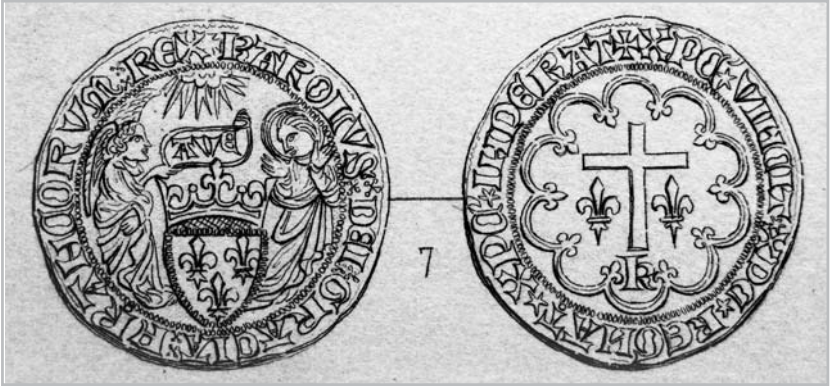
Рис. 5. Салюдор. Карл VI