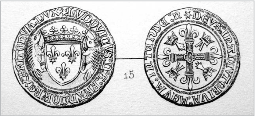
Рис. 6. Экю. Людовик XII