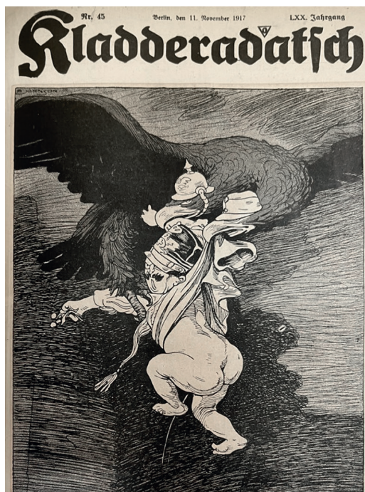
Ил. 3. Иллюстрация в журнале «Kladderadatsch». 11 ноября 1917 года. РНБ, Иностраннный журнальный фонд, Р35/307

служит обозначением заведомо слабого врага. Это подтверждает упомянутая пикельхаубе, которая практически попирается ногами французского солдата.