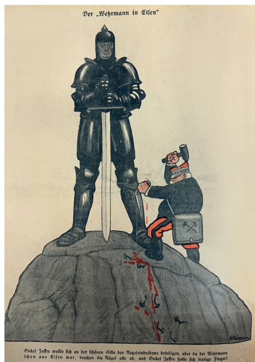
Ил. 4. Солдат в Эйсене. Иллюстрация в журнале «Kladderadatsch». 11 июля 1915 года. РНБ, Иностраннный журнальный фонд, Р35/307

Немецкая пропаганда использовала характерные особенности пикельхаубе для диффамации противника. Так, на обложке журнала «Simplicissimus» за 18 января 1916 года 11 (ил. 5) изображено «накальвание» англичанина на пикельхаубе на фоне Вестминстерского дворца.