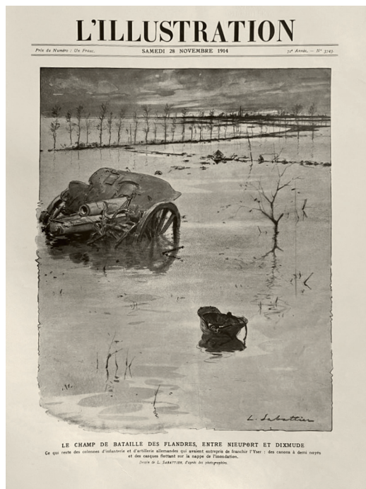
Ил. 2. Луи Сабаттир. Поле битвы во Фландрии, между Ньюпором и Диксмудом. Иллюстрация в журнале «L'Illustration». 28 ноября 1914 года. РНБ, Иностраннный журнальный фонд, Р3/56