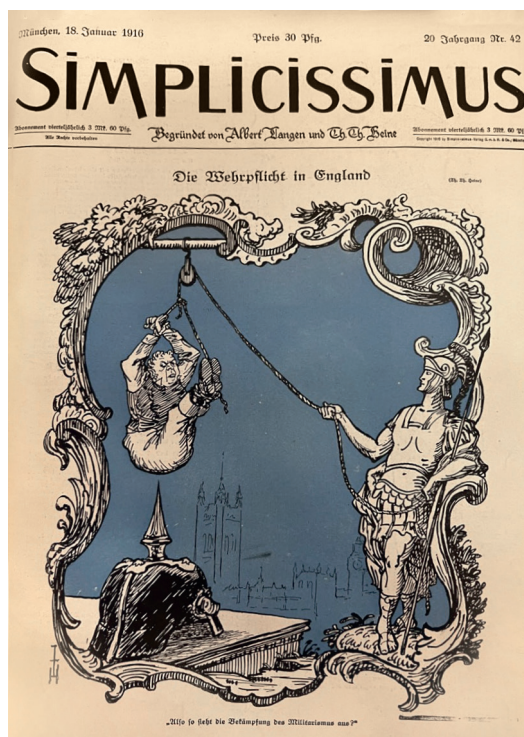
Ил. 5. Обязательная военная служба в Англии. Иллюстрация на обложке журнала «Simplicissimus». 18 января 1916 года. РНБ, Иностраннный журнальный фонд, 16.33.132