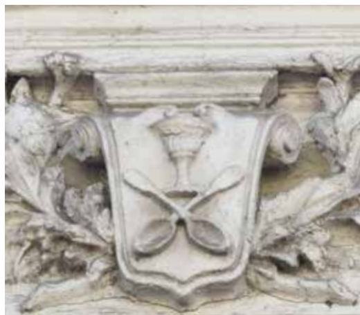
Ил. 8. Эмблема серебряного цеха на здании Санкт-Петербургской ремесленной управы. Большая Московская ул., 1/ Загородный пр., д. 2.