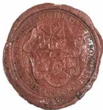
Ил. 9. Оттиск печати Санкт-Петербургского золотого и серебряного цеха. Санкт-Петербург. 1830. Бумага; сургуч. ЦГИА СПб. Ф. 223. Оп. 1. Д. 250. Л. 2