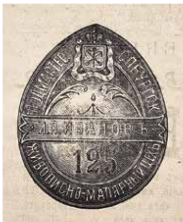
Ил. 4. Знак подмастерья Санкт-Петербургского живописно-малярного цеха. Образец.