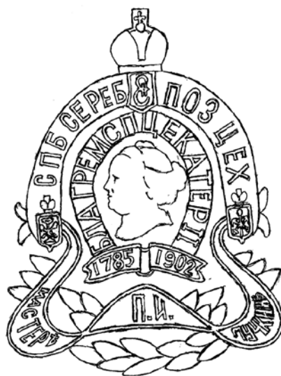
Ил. 6. Знак мастера Санкт-Петербургского серебряно-позументного цеха. 1902. Серебро; эмаль. 25,7 × 19,4 мм. Прорисовка автора

Отсутствует он и на знаке подмастерья 16 (ил. 7). В поле та же композиция, что и в знаке мастера, такая же надпись на подковообразной рамке (имя императрицы приведено полностью: «БЛАГ. РЕМЕС. СПЦ. ЕКАТЕРИНЪ II») и те же даты на ленте: «1785–1902». На огибающей знак широкой ленте надпись с названием цеха и должности владельца: «СПБ. ПОЗ. ЦЕХ. ПОДМАС.». Вторая половина ленты оставлена пустой. Возможно, предназначена для имени и номера. Но самое интересное в верхней части, где по дуге размещены, как в знаке мастера, три щитка: в центре с вензелем Екатерины II, слева с гербом Санкт-Петербурга, справа, и это главное, – с эмблемой серебряного цеха. Именно это изображение доказывает, что на здании Ремесленной управы Санкт-Петербурга