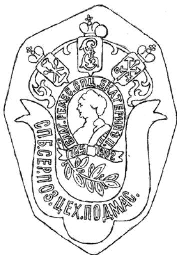
Ил. 7. Знак подмастерья Санкт-Петербургского серебряно- позументного цеха. 1902. Металл; штамповка. 36 × 25 мм. Прорисовка автора

церковной утвари, на которую всегда был большой спрос, – потир, литургический сосуд для освящения вина. И вот здесь, возможно, есть связь с указанной на знаках датой. 1785 год – выход Ремесленного положения в составе Жалованной грамоты Екатерины II, утвердившей ремесленное сословие в России. Уже существовавшие в Санкт-Петербурге цехи проходили перерегистрацию в только что созданной Ремесленной управе, учреждались новые. 1902 год – благодарные серебряники отмечали тогда 140 лет со дня выхода – 23 августа 1762 года – Указа Екатерины II «О дозволении во всех городах делать записанным в цех мастерам церковные из золота и серебра вещи» 19 . А ведь до этого, как писал А. И. Богданов в первой половине XVIII века, серебряники делали только «всякую серебряную посуду» 20 . Теперь же для изготовления церковной утвари более не требовалось специального разрешения государственных органов. С этой поры в эмблемах серебряных цехов городов России присутствуют разнообразные предметы для богослужения: оклад иконы – Псков и Калуга 21 , венец – Вологда и Ростов Великий 22 , евхаристический набор – Углич и Кострома 23 .