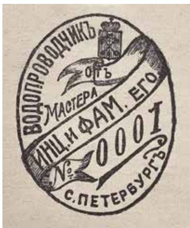
Ил. 13. Знак водопроводчика. Образец. Санкт-Петербург. 1909.