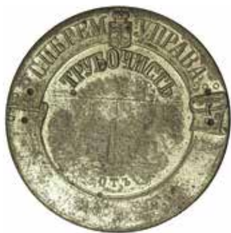
Ил. 15. Знак трубочиста. Санкт-Петербург. 1909 (?). Диаметр 60 мм. ГМИ СПб. Инв. №-Х-А-910-р

полотерный цех 31 , со своим управлением и знаменем, созданным по образу и подобию знамени живописного цеха, в составе которого полотеры были долгое время. И, наконец, с собственным знаком, изготовленным по утвержденному образцу, но уже с другой надписью – наименованием нового цеха.