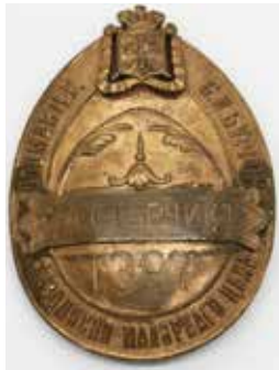
Ил. 1. Знак подмастерья Санкт-Петербургского живописно-малярного цеха А. А. Старчика, № 1397. Санкт-Петербург. После 1902. Медь; штамповка, гравировка. 62 × 44 мм. ГМИ СПб. Инв. № Х-А-1773-р