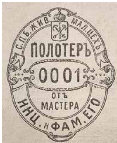
Ил. 14. Знак полотера. Образец. Санкт-Петербург. 1909. Воспроизводится по: Ведомости С.-Петербургского Градоначальства. 1909. 4 янв. (№ 3). С. 1. РНБ

и ученикам , для ношения на груди во время отправления ими полотерных работ в учреждениях и частных квартирах. Мастера обязаны № значка вписывать в расчетную книжку подмастерья или ученика, которому значек выдан. Полотерные значки прежних образцов отменяются и недействительны для предъявления на местах работы.