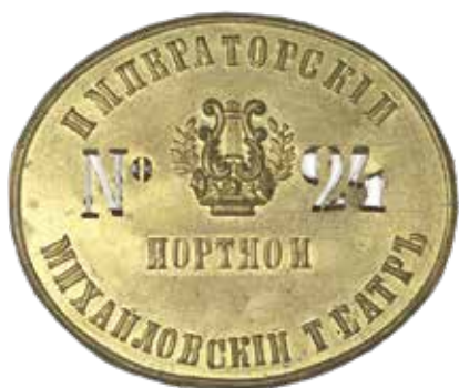
Ил. 12. Знак портного Императорского Михайловского театра, № 24. Металл; штамповка. 69 × 83 мм. ГМИ СПб. Инв. №-Х-А-1508-р

исполнено распоряжение, отданное в приказе по полиции № 159 – 1893 года, согласно коему участковые приставы обязаны: