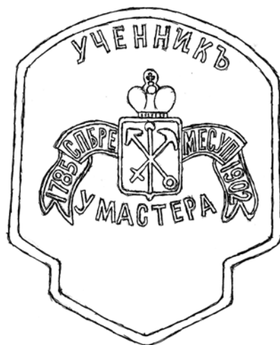
Ил. 11. Знак ученика Санкт-Петербургского серебряно-позументного цеха. 1902. Металл; штамповка. 30 × 25 мм. Прорисовка автора

для отличия от случайных посетителей и вообще для удобства публики <...> была снабжена номерными знаками, а списки такой прислуги находились бы у распорядителей театра» 24 . То есть этот знак портного не имел отношения к Ремесленной управе.