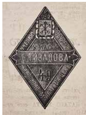
Ил. 5. Знак ученика Санкт-Петербургского живописно-малярного цеха. Образец.