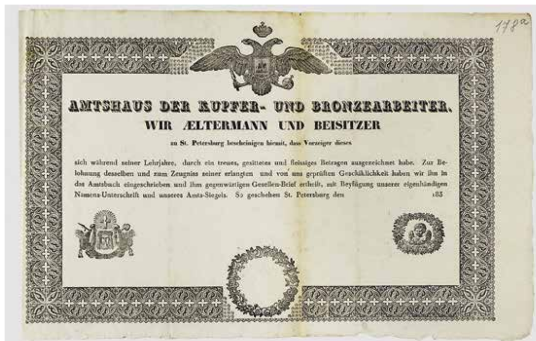
Ил. 4. Свидетельство на звание подмастерья медно-бронзового цеха Д. Осипова. Санкт-Петербург. 1840. Бумага, сургуч; типографская печать, рукопись. 28 × 45 см.