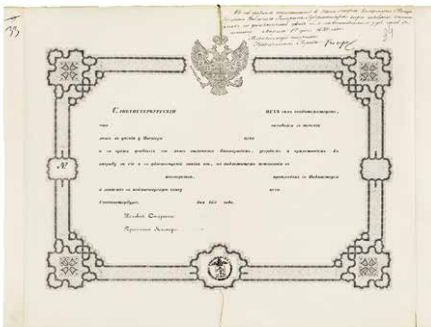
Ил. 10. Образец бланка свидетельства подмастерья. Санкт-Петербург. 1850. Бумага; типографская печать, рукопись. ЦПА СПб. Ф. 223. Оп. 1. Д. 660. Л. 34