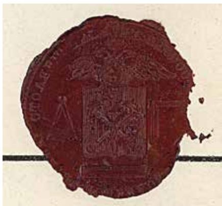
Ил. 6. Оттиск печати столярного цеха. Санкт-Петербург. 1847. Бумага, сургуч. ЦГИА СПб. Ф. 223. Оп. 1. Д. 535. Л. 449 а