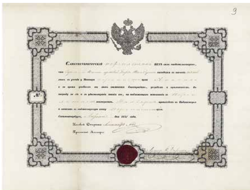
Ил. 11. Свидетельство на звание подмастерья переплетного цеха Г. Вилберга. Санкт-Петербург. 1851. Бумага, сургуч; типографская печать, рукопись. 36 × 47,5 см. ЦПА СПб. Ф. 223. Оп. 1. Д. 1624. Л. 9