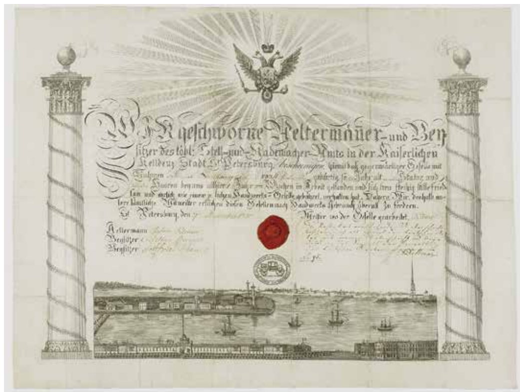
Ил. 2. Свидетельство С.-Петербургского немецкого шорно-колесного заведения об утверждении в звании подмастерья. Санкт-Петербург. 07.11.1821. Бумага, сургуч; типографская печать, рукопись. 40,6 × 53,2 см. Инв. № III-A-28 д. Государственный музей истории Санкт-Петербурга