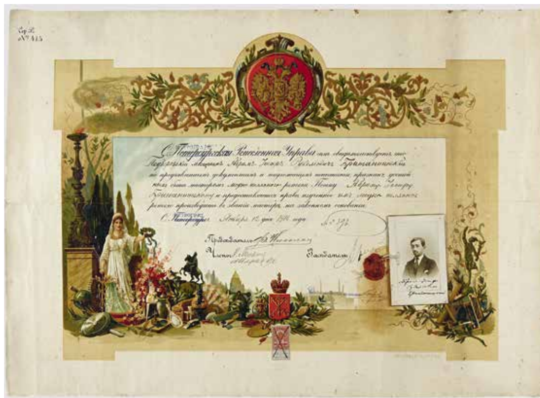
Ил. 18. Свидетельство Петроградской ремесленной управы о присвоении звания мастера модно-шапльного дела подберезскому мещанину Абраму-Иосифу Рувимовичу Британишскому.

Петроград. 12.01.1916. Бумага, фотобумага, сургуч; типографская печать, конгрев, рукопись, фотопечать. 47,3 × 65,6 см; 10,8 × 6,8 см (паспарту). Инв. № III-A-2095 д.