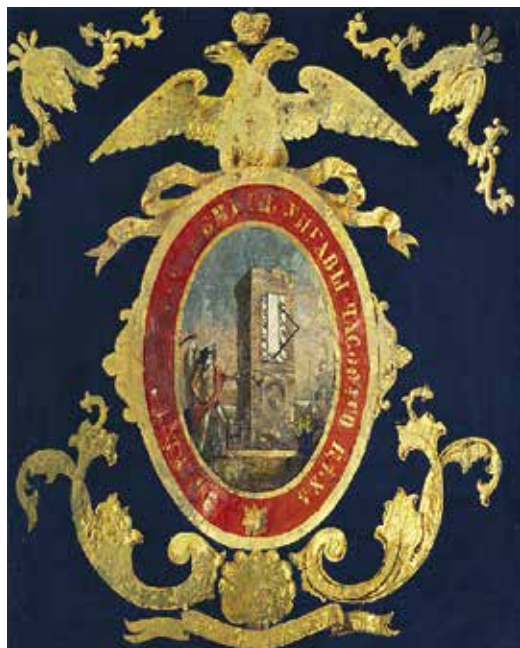
Ил. 9. Знамя цеха часовщиков. Санкт-Петербург. 1855. Шелк, масло, бахрома: нить х/б, металлическая нить. 86,0 × 79,0 см; 73,0 × 72,0 см (без бахромы). Инв. № V-A-35 з.

Государственный музей истории Санкт-Петербурга