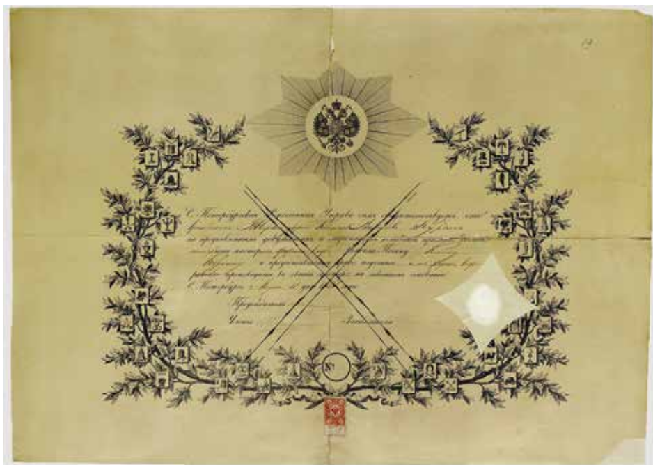
Ил. 15. Диплом мастера кондитерского цеха К. Курдина. Санкт-Петербург. 1891. Бумага; типографская печать, конгрев, рукопись. 48 × 67,5 см. ЦПИА СПб. Ф. 223. Оп. 1. Д. 5393. Л. 19