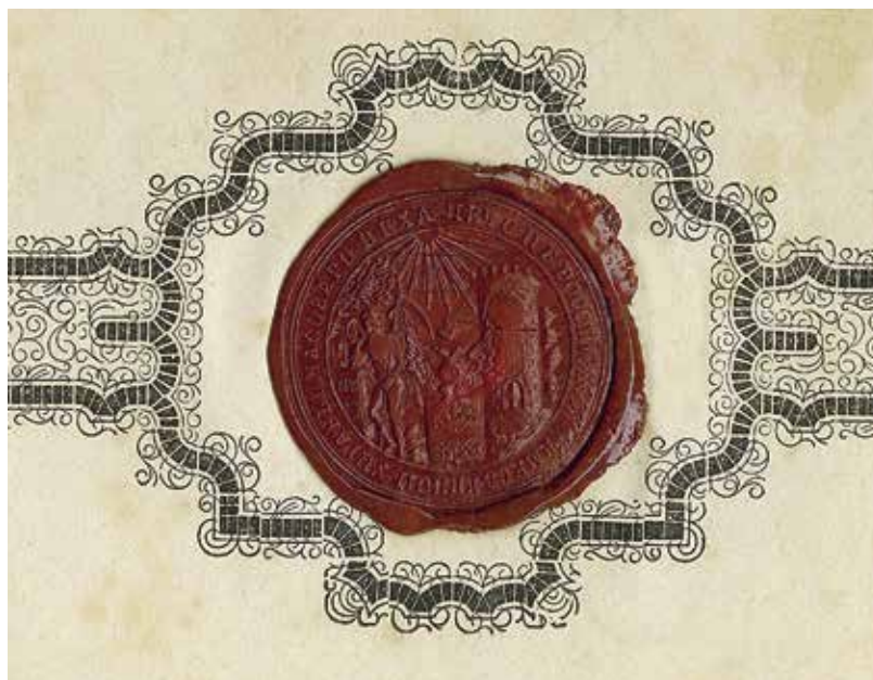
Ил. 8. Оттиск печати часового цеха. Санкт-Петербург. 1842. Бумага, сургуч. Инв. № Ф. П-54879. Музей политической истории России