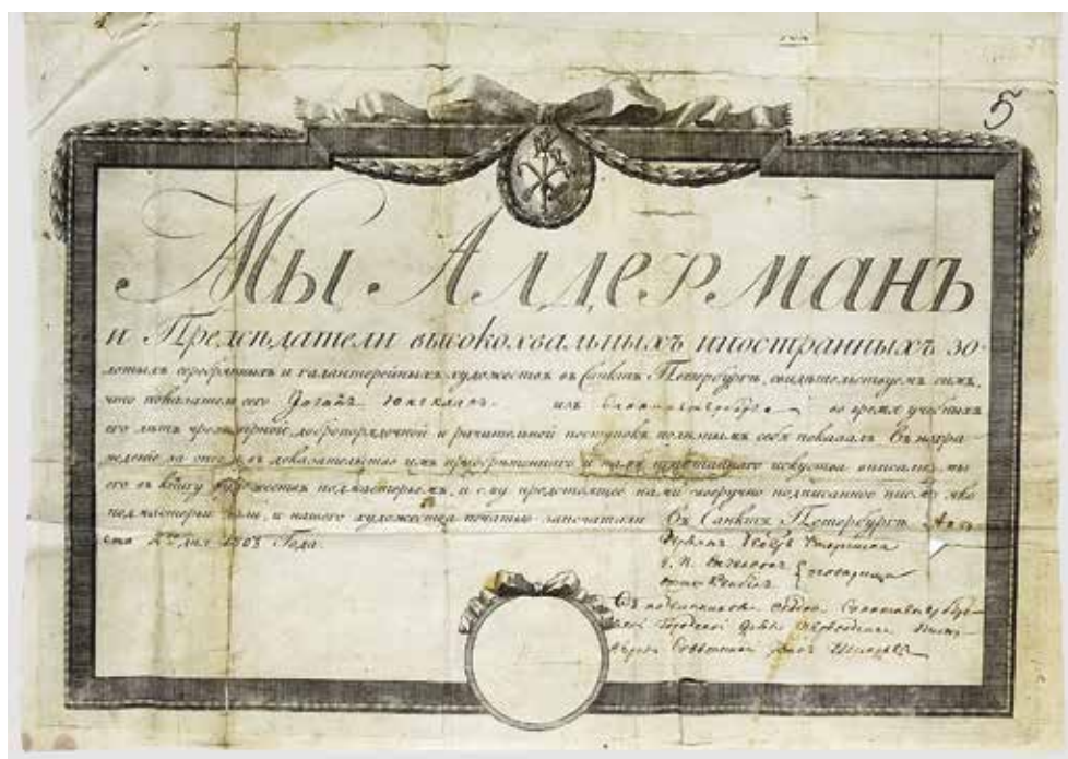
Ил. 1. Свидетельство на звание подмастерья золотого и серебряного цеха Иностранной ремесленной управы Санкт-Петербурга И. Юнгклаас. Санкт-Петербург. 1803. Бумага, сургуч; типографская печать, рукопись. 27 × 35,5 см. Лицевая и внутренняя стороны. ЦПА СПб. Ф. 254. Оп. 1. Д. 2591. Л. 4, 5