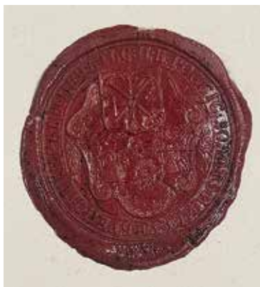
Ил. 7. Оттиск печати золотого и серебряного цеха. Санкт-Петербург. 1830. Бумага, сургуч. ЦГИА СПб. Ф. 223. Оп. 1. Д. 250. Л. 2