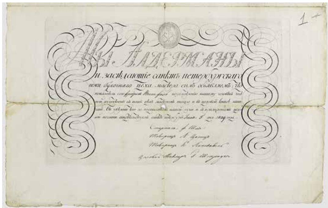
Ил. 3. Диплом на звание мастера немецкого булочного цеха Ф. Вестфалька. Санкт-Петербург. 1829. Бумага, сургуч; типографская печать, рукопись. 28 × 45 см.

Лицевая и внутренняя стороны. ЦГИА СПб. Ф. 223. Оп. 2. Д. 2. Л. 2, 1