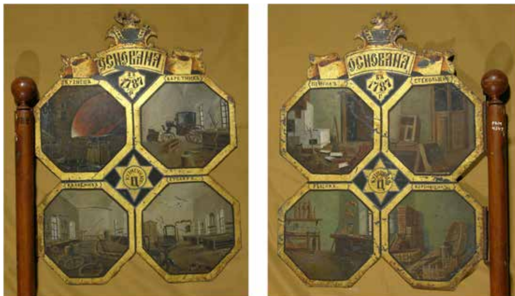
Ил. 20. Знамя кузнечного цеха, Рыбинск. Лицевая и оборотная стороны. XIX век. Жесть, дерево; роспись. 45 × 34; высота древка: 144. Рыбинский государственный историко-архитектурный и художественный музей-заповедник. Инв. № М-2557