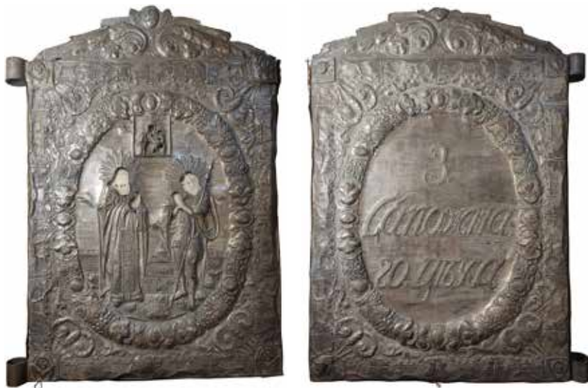
Ил. 6. Знамя сапожного цеха Смоленска. Лицевая и оборотная стороны. 1839. Металл, дерево; штамповка, гравировка, серебрение, роспись. 78,5 × 51,0. Смоленский государственный музей-заповедник. Инв. № СОМ 694/4

На знамени резного и столярного цеха Смоленска помещена композиция на аналогичный сюжет – «Бегство в Египет», изображение Богоматери с Младенцем Христом на руках и св. Иосифа. Действующие лица представлены путниками. На оборотной стороне – надпись: «З. (знак. – С. К.) резного и стларнаго цѣха» (ил. 4).