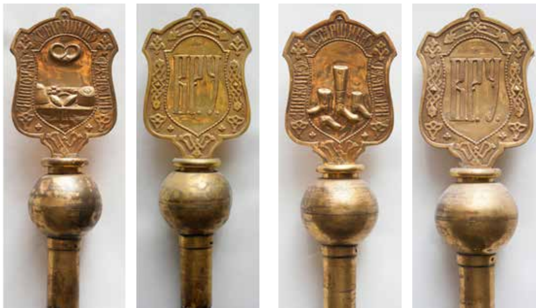
Ил. 28. Знак-жезл старшины булочного цеха Владимирской ремесленной управы. 1847–1900. Дерево, металл, краска; столярная работа, штамповка, золочение. 125,0 × 7,5. Государственный Владимиро-Суздальский историко-архитектурный и художественный музей-заповедник. Инв. № Н-6715