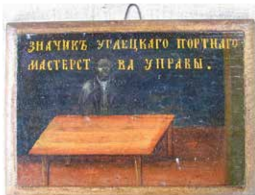
Ил. 26. Неизвестный художник. Знак угличского портного цеха. Конец XVIII века (?). Дерево; масло. 12 × 17. Угличский государственный историко-архитектурный и художественный музей. Инв. № УГ/КП-2577

Старшины цехов Костромы имели знаки, подобные тем, что официально были введены в России во второй половине XIX века, – в виде цепи с подвеской, носившейся на шее «во время исправления должности» 27 . И, хотя ремесленникам должностные знаки