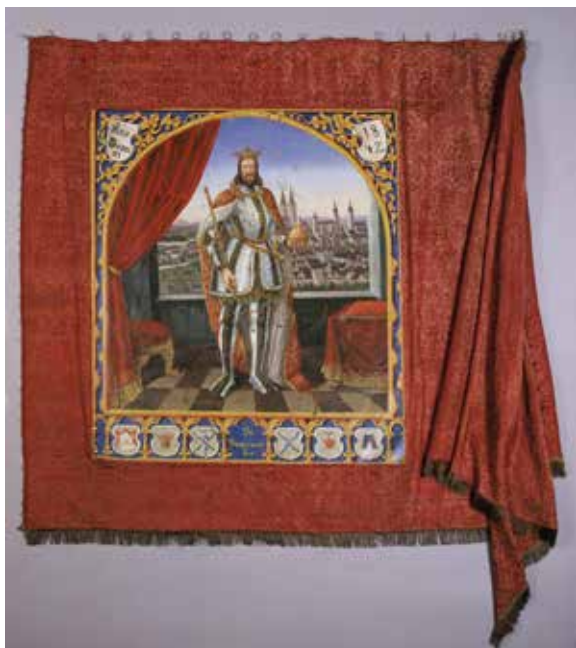
Ил. 7. Теодор Эллмер. Знамя шорников, дубильщиков, кожевников и канатчиков Фрайзинга, Бавария. Лицевая сторона. 1842. Шелк, холст; роспись. 149 × 330 (в развернутом виде); вставка: 105 × 95. Музей Исторического общества Фрайзинга, ФРГ. Инв. № 0632