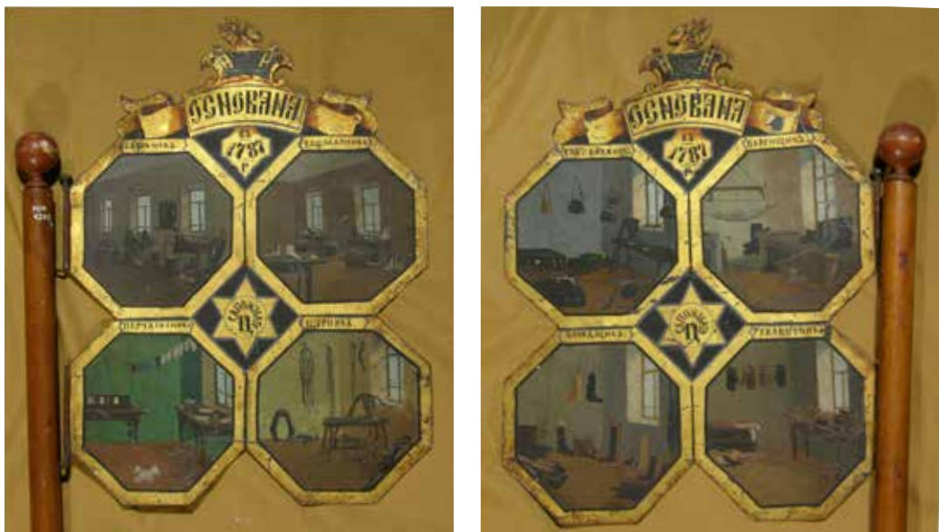
Ил. 22. Знамя сапожного цеха, Рыбинск. Лицевая и оборотная стороны. XIX век. Жесть, дерево; столярная работа, роспись. 45 × 34; высота древка: 144. Рыбинский государственный историко-архитектурный и художественный музей-заповедник. Инв. № М-2560