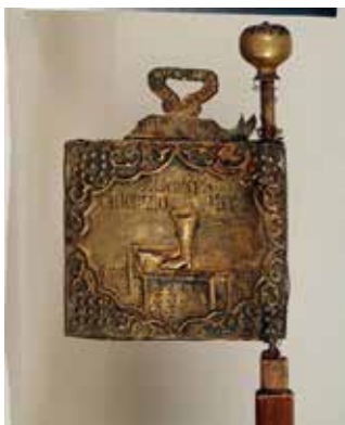
Ил. 25. Знак мастера сапожного цеха, Углич. Начало XIX века (?). Металл, дерево; чеканка. 13,2 × 14,8. Угличский государственный историко-архитектурный и художественный музей. Инв. № УГ/КП-1409

оборудование, образцы изделий, даже производственный процесс. Перед нами интерьерная живопись – подробное, содержательное, неспешное повествование не только о ремеслах, но и о жизни российской глубинки в сорока картинах-эмблемах. И своеобразный вид ремесленной геральдики – интерьерная 20 .