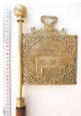
Ил. 27. Знак мастера портного цеха, Углич. Начало XIX века (?). Металл, дерево; чеканка. 13,2 × 14,8. Угличский государственный историко-архитектурный и художественный музей. Инв. № УГ/КП-1406