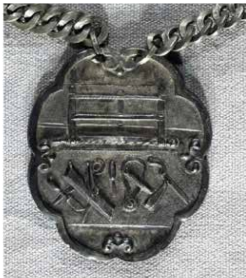
Ил. 33. Знак старшины столярного цеха Костромской ремесленной управы. XIX век.

Костромской государственный историко-архитектурный и художественный музей-заповедник. Инв. № КМЗ КОК-7602/5