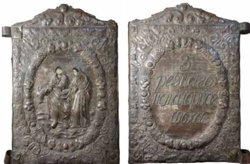
Ил. 4. Знамя резного и столярного цеха Смоленска. Лицевая и оборотная стороны. 1839. Металл, дерево; штамповка, гравировка, серебрение, роспись. 77,5 × 52,0. Смоленский государственный музей-заповедник. Инв. № СОМ 694/3