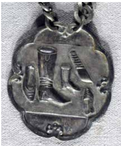
Ил. 31. Знак старшины сапожного цеха Костромской ремесленной управы.

XIX век. Металл белый; чеканка, пайка, гибка. 7 \times 6 ; длина цепи: 43.