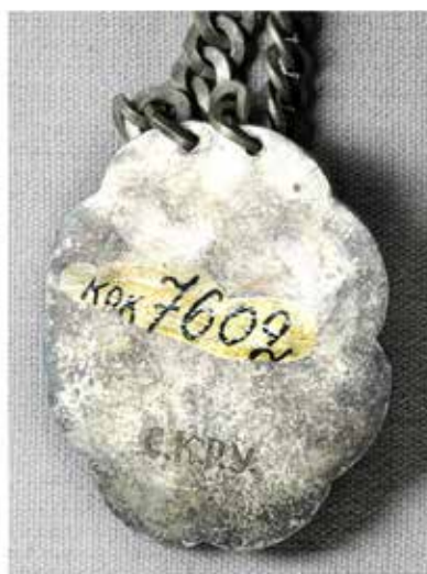
Ил. 30. Знак старшины серебряного цеха Костромской ремесленной управы. XIX век. Металл белый; чеканка, пайка, гибка. 6,9 × 6,0; длина цепи: 46. Костромской государственной историко-архитектурный и художественный музей-заповедник. Инв. № КМЗ КОК-7602/2