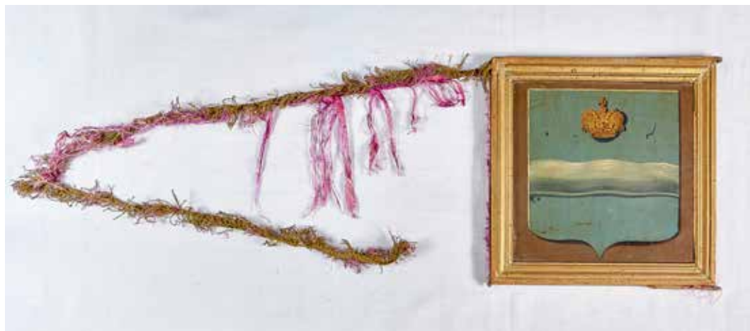
Ил. 13. Знамя портного цеха, Калужская губерния. Оборотная сторона. XIX век. Жесть, дерево, шелк, бахрома; роспись. 31,8 × 32,0. Калужский объединенный музей-заповедник. Инв. № М-1852

императрицей Екатериной II (ил. 13). Герб имел следующее описание: «На голубом поле горизонтально извитый серебряный переклад, означающий реку Оку, протекающую возле сего города, и в верхней части щита Императорская золотая корона в знак знаменитости, которую он через нынешнее учреждение в нем губернии от Монаршей милости получил» 11 . На другой стороне изображена эмблема цеха, размещенная чаще всего в нижней части поля на общем для всех знамен сером фоне; вверху – надпись с наименованием цеха. Надо отметить, что эмблемы строятся одинаково, с минимумом предметов. Портное мастерство представлено инструментами – раскрытыми портновскими ножницами и портновским же утюгом (ил. 14). Все предельно просто и лаконично. Женская туфля и мужской сапог изображены на знамени сапожного цеха (ил. 15); два головных убора – митра и конфедератка – на знамени шапочного цеха (ил. 16).