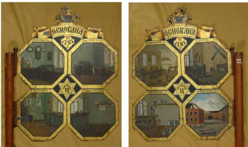
Ил. 23. Знамя часового цеха, Рыбинск. Лицевая и оборотная стороны. XIX век. Жесть, дерево; роспись. 45 × 34; высота древка: 144. Рыбинский государственный историко-архитектурный и художественный музей-заповедник. Инв. № М-2559