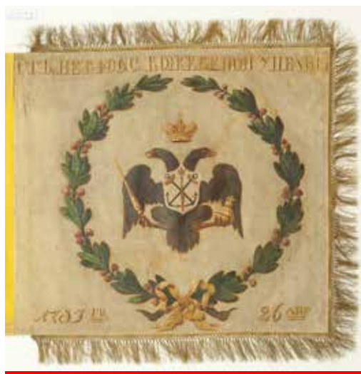
Ил. 11. Знамя кожевнного цеха Санкт-Петербурга. Лицевая и оборотная стороны. 1815. Шелк; бахрома: хлопчатобумажная и металлическая нити; масло. 71 × 75; 59,0 × 68,5 (без бахромы). Государственный музей истории Санкт-Петербурга. Инв. № V-A-19-з