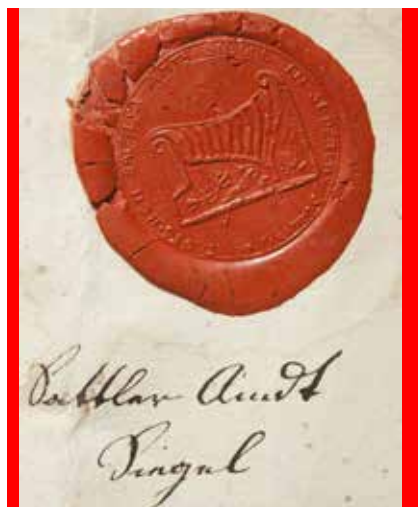
Ил. 10. Оттиск печати немецкого шорного цеха Санкт-Петербурга. Конец XVIII – начало XIX века. Бумага, сургуч, рукопись. Диаметр 3,7. Государственный музей истории Санкт-Петербурга. Инв. № III-A-858-д.