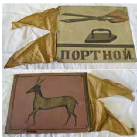
Ил. 18. Знамя портного цеха, Ростов Великий. Лицевая и оборотная стороны. XIX век. Медь, железо, ткань; роспись. 30,8 × 25,3. Государственный музей-заповедник «Ростовский кремль». Инв. № М-3128