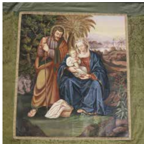
Ил. 3. Петер Эллермер Младший. Знамя каменщиков и плотников Фрайзинга, Бавария. Обратная сторона. 1850. Шелк, холст; роспись. 140 × 380 (в развернутом виде); вставка: 95 × 80. Музей Исторического общества Фрайзинга, ФРГ. Инв. № 0634