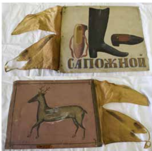
Ил. 19. Знамя сапожного цеха, Ростов Великий. Лицевая и оборотная стороны. XIX век. Медь, железо, ткань; роспись. 30,5 × 25,4. Государственный музей-заповедник «Ростовский кремль». Инв. № М-3125

пекарного, сапожного, серебряного и финифтяного (ил. 17) цехов изображены образцы продукции ремесленников. И, наконец, как и в Калуге, портное мастерство показывают только инструменты – традиционные портновские ножницы (но в руке мастера) и портновский утюг – чугунный, цельнолитой, с плоской подошвой, литой ручкой и заостренным носиком (ил. 18). Впервые в композицию включен аршин – металлическая линейка длиной 71,1 см с делениями на четверти и вершки.