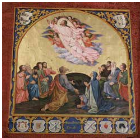
Ил. 8. Теодор Эллмер. Знамя шорников, дубильщиков, кожевников и канатчиков Фрайзинга, Бавария. Обратная сторона. Вставка. 1842. Шелк, холст; роспись. 149 × 330 (в развернутом виде); вставка: 105 × 95. Музей Исторического общества Фрайзинга, ФРГ. Инв. № 0632

и показаны сапожниками. Над ними – изображение восседающей на облаках Богоматери с Младенцем 7 . На знамени сапожного цеха Смоленска схожая композиция: местночтимые святые Авраамий и Меркурий Смоленские, над ними Богоматерь Смоленская. На обороте надпись: «З. (знак. – С. К.) Сапожнаго цѣха» (ил. 6) 8 .