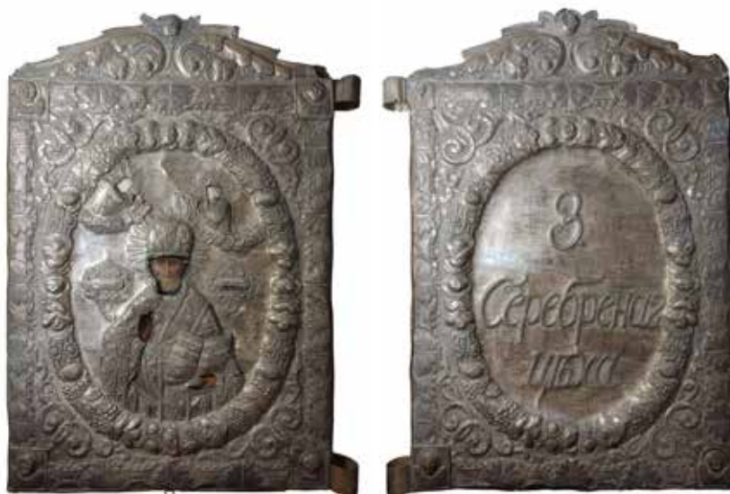
Ил. 1. Знамя серебряного цеха Смоленска. Лицевая и оборотная стороны. 1839. Металл, дерево; штамповка, гравировка, серебрение, роспись. 77 × 56. Смоленский государственный музей-заповедник. Инв. № СОМ 694/7

кузнечного цеха – Косма и Дамиан, которых кузнецы считали своими покровителями. На знамени живописного цеха – святые евангелисты Иоанн и, конечно, Лука, покровитель художников и иконописцев.