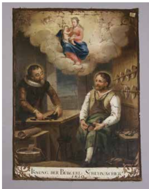
Ил. 5. Знамя сапожников Фрайзинга, Бавария. Вставка. Лицевая сторона. 1820. Холст; роспись. 100 × 71. Музей Исторического общества Фрайзинга, ФРГ. Инв. № 3254