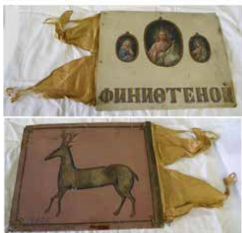
Ил. 17. Знамя финифтяного цеха, Ростов Великий. Лицевая и оборотная стороны. XIX век. Медь, железо, ткань; роспись. 30,7 × 25,2. Государственный музей-заповедник «Ростовский кремль». Инв. № М-3126