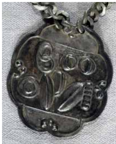
Ил. 32. Знак старшины калачного цеха Костромской ремесленной управы.

Костромской государственный историко-архитектурный и художественный музей-заповедник. Инв. № КМЗ КОК-7602/1