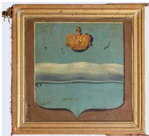
Ил. 14. Знамя портного цеха, Калужская губерния. Лицевая и оборотная стороны. XIX век. Жесть, дерево, шелк, бахрома; роспись. 31,8 × 32,0. Калужский объединенный музей-заповедник. Инв. № М-1852