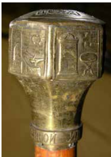
Ил. 21. Набалдашник трости старшины кузнечного цеха, Рыбинск. XIX век. Дерево, сплав медный, чеканка; столярная работа, лакирование. Общая высота трости: 136; набалдашник: высота 7, диаметр 6. Рыбинский государственный историко-архитектурный и художественный музей-заповедник. Инв. № М-2553

вызвали бурное недовольство иконных дел мастеров, посчитавших это неприличным и неприемлемым 19 .