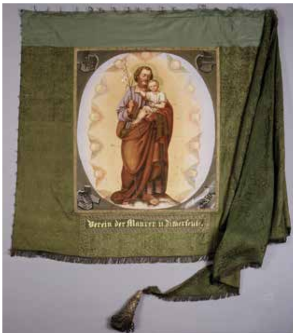
Ил. 2. Петер Эллермер Младший. Знамя каменщиков и плотников Фрайзинга, Бавария. Лицевая сторона. 1850. Шелк, холст; роспись. 140 × 380 (в развернутом виде); вставка: 95 × 80. Музей Исторического общества Фрайзинга, ФРГ. Инв. № 0634