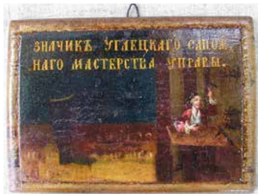
Ил. 24. Неизвестный художник. Знак угличского сапожного цеха. Конец XVIII века (?). Дерево; масло. 12 × 17. Угличский государственный историко- архитектурный и художественный музей. Инв. № УГ/КП-2576