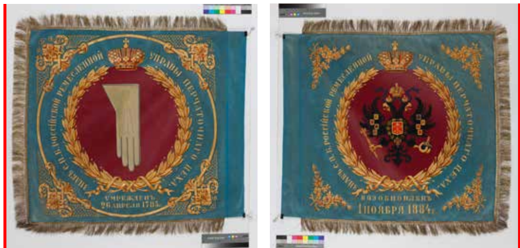
Ил. 12. Знамя перчаточного цеха Санкт-Петербурга. Лицевая и оборотная стороны. 1884. Шелк; бахрома: хлопчатобумажная и металлическая нити; масло. 91 × 96; 78,5 × 90,0 (без бахромы). Государственный музей истории Санкт-Петербурга. Инв. № V-A-45-з

баварского народного костюма (ил. 7, 8); сначала они считались одеждой простонародья, но с XIX века их стали носить при баварском дворе. Похожая перчатка изображена на знамени перчаточного цеха Санкт-Петербурга (ил. 12).