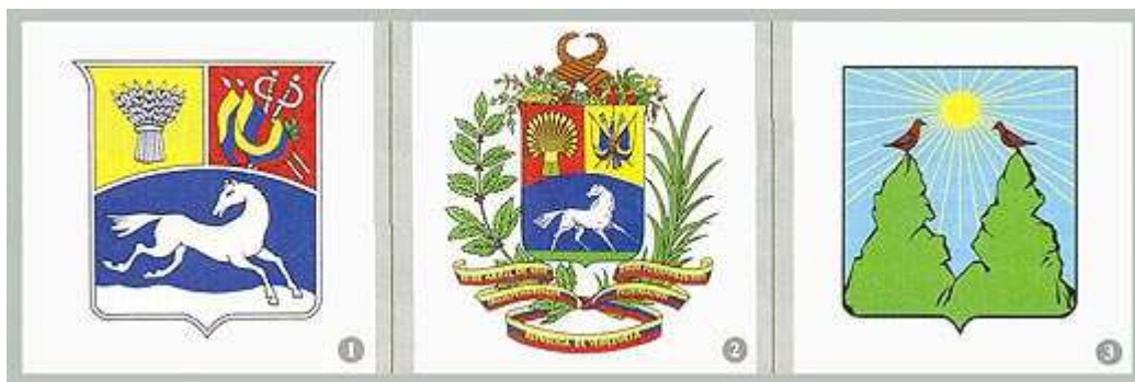
1. Щит герба Венесуэлы 1905-1930 годов.