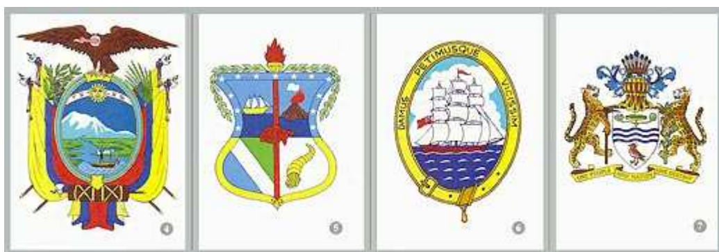
4. Государственный герб Республики Эквадор.