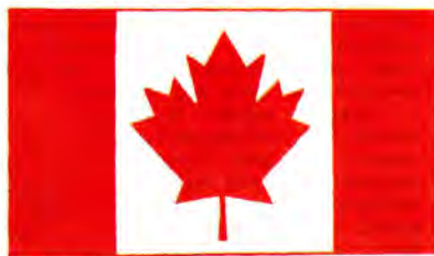
Государственный флаг Канады.

Каждая из канадских провинций и территорий имеет собственный флаг и герб. За последние годы франкоязычная провинция Квебек добилась широкой автономии, причем влиятельные политические силы в ней стремятся к полной независимости, угрожающей распадом Канады. Герб Квебека, утвержденный в нынешнем виде в 1939 году, сочетает в себе французские лилии, которых с тех пор стало три, английского льва и канадские кленовые листья (но зеленые на желтом) в едином щите, увенчанном британской короной, но сопровождаемой с 1883 года девизом на французском языке «Я помню», указывающем на связь с Францией. Квебекский же флаг (принят в 1948 году) имеет чисто французскую символику – белый крест и лилии на синем полотнище. Более того, он практически повторяет рисунок боевого знамени французских войск, под которыми они сражались против англичан в битве у форта Карийон (Тикондерога) в 1758 году. Разница только в том, что лилии были расположены ближе к углам, а в центре белого креста изображался религиозный символ – Сердце Иисуса, охваченное пламенем, увенчанное крестом и окруженное венком из кленовых ветвей. Это знамя, утраченное после битвы, было впоследствии найдено в 1846 году и стало для франкоканадцев святыней.