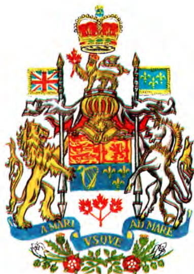
Государственный герб Канады.

Современный флаг Канады принят в 1974 году после многолетних споров и обсуждений и употребляется с 1975 года. Кленовый лист в течение полутора веков является канадским национальным символом и более 120 лет изображается на гербе Канады и гербах крупнейших провинций Онтарио и Квебек. Красный и белый цвета флага считаются национальными в