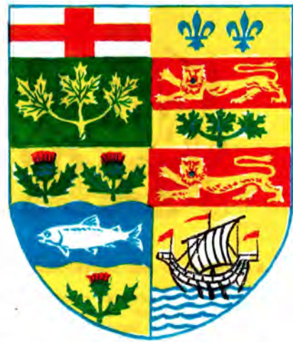
Первый общеканадский герб 1869 года.

После подавления восстания земли компании в 1870 году вошли в