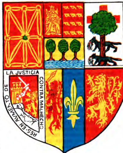
Щит объединенного герба всех баскских земель.

В нижнем ряду слева герб испанской провинции Алава: красное поле, на серебряной скале золотой замок, из ворот которого высовывается рука в доспехах с мечом, грозящая поднимающемуся по скале льву, а вокруг - испанская надпись «Приумножение правосудия против преступников». Ря-