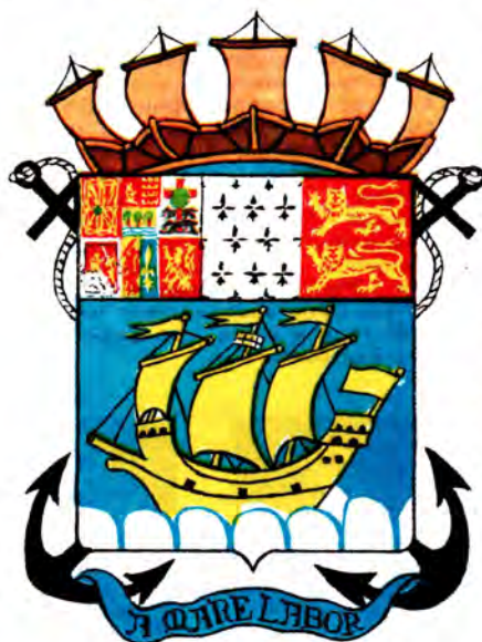
Герб территориальной единицы Сен-Пьер и Микелон.

Владение Франции Сен-Пьер и Микелон («заморский департамент», а с 1985 года - «территориальная единица») на одноименных островах в северо-западной части Атлантического океана, у границ Канады, имеет очень сложный герб. Он известен с 40-х годов XX века. Центральной эмблемой герба является каравелла, напоминающая об экспедиции известного мореплавателя Жака Картье, объявившего острова в 1535 году владением Франции. Изображенные над ней геральдические эмблемы рассказывают об истории открытия и заселения островов. Их первыми поселенцами были проживающие в северо-восточной Испании и юго-западной Франции баски, за которыми последовали выходцы из северо-западной Франции - бретонцы и из северной Франции - нормандцы. Поэтому изображенные в верхней части гербы исторических областей представляют Страну Басков (сложный