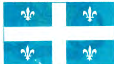
Флаг провинции Квебек.