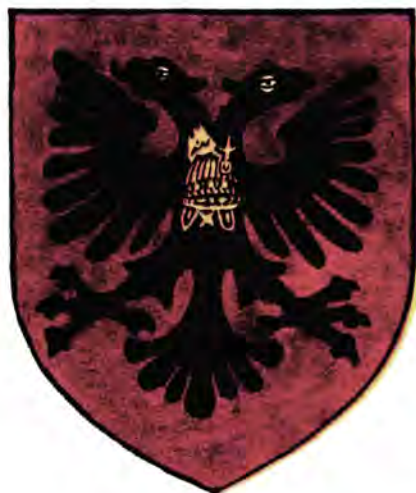
Герб Албании 1926 – 1929 гг.

провозгласившие курс на строительство социализма. Эти изменения были отражены во флаге и гербе, принятых в 1946 году и сохранившихся по сей день. Национальный флаг Албании остался в основном прежним, но над головами орла появилась красная пятиконечная звезда с золотой каймой. Орел является олицетворением албанского народа, символом его любви к свободе и независимости. Красный цвет флага напоминает кровь, пролитую в борьбе за свободу, звезда символизирует свободу и будущее страны. На гербе орла и звезду окружает венок из пшеничных колосьев (сельское хозяйство остается главной отраслью албанской экономики, а пшеница является главной продовольственной культурой). Венок символизирует мирный созидательный труд народа, он перевит красной лентой с датой «25 мая 1944 года». В этот день в