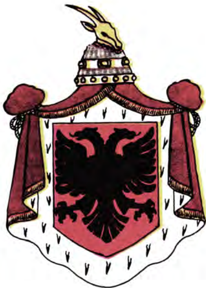
Герб Албании 1929 – 1939 и 1943 – 1945 гг.

вили новый герб. На фоне мантии, увенчанной итальянской короной, изображался красный щит с албанским орлом, увенчанный шлемом Скандербега. Щит окружали эмблемы правившей в Италии Савойской династии – завязанный двумя узлами особой формы шнур и лента с девизом, а также эмблема итальянских фашистов – две связки прутьев с топорами. Центральная часть этого герба – без мантии, но с короной – служила эмблемой на красном полотнище флага.