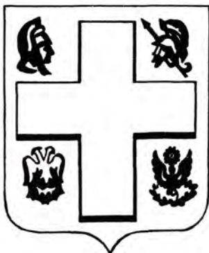
Герб Греции 1926 – 1932 гг.