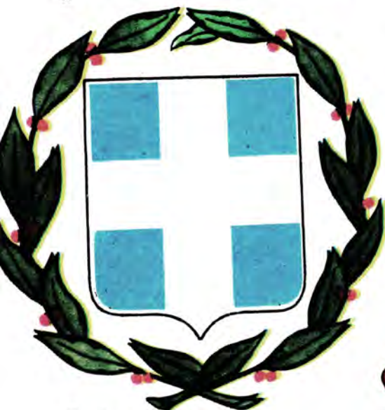
Государственный герб и флаг Греческой Республики (современные).

центре которого помещалась золотая королевская корона. На национальном флаге корона отсутствовала. За пределами же Греции, а также в ее морских портах и гражданских судах в качестве национального символа использовался другой флаг, состоявший из пяти синих и четырех белых полос с белым крестом в синем крыже. Эта система флагов просуществовала до провозглашения республики в 1923 году, когда единственным флагом на 12 лет стал девятиполосный флаг с крестом в крыже и была вновь восстановлена в 1935 году после реставрации монархии.