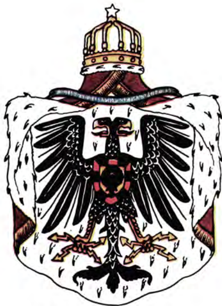
Герб Албании 1914 г.