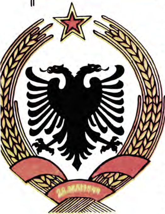
Государственный герб и флаг Албании (современные).