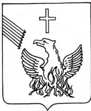
Герб Греции 1827 – 1831 гг.

дарственным и национальным флагом был объявлен синий с белым крестом (светлее, чем флаги 1970 года). Девятиполосный же флаг с крестом в крыже продолжал употребляться лишь неофициально, в качестве торгового флага. Но в 1978 году именно этот флаг был принят в качестве единственного (государственного и национального) флага.