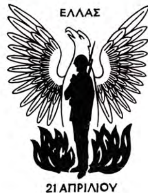
Эмблема военного режима в Греции 1967 – 1973 г.г.