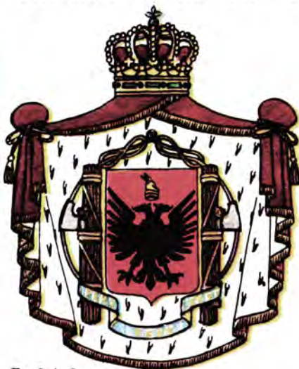
Герб Албании в период итальянской оккупации.

освобожденном Народно-освободительной армией городе Пермети был созван первый антифашистский национально-освободительный конгресс, где были избраны первые органы народной власти Албании.