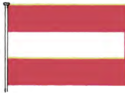
Государственный флаг и герб Австрии.

Орел олицетворяет национальные традиции, свободу и независимость страны. Серп обозначает крестьянство, а молот — рабочих и ремесленников. Башенная корона символизирует буржуазию. Три зубца короны обозначают единство и сотрудничество всех австрийцев — рабочих, крестьян и буржуазии. Красный цвет флага символизирует кровь, пролитую в борьбе за независимость Австрии, белый — завоеванную свободу. Бытует и другое объяснение. Согласно ему цвета флага напоминают о том, что красноватые почвы страны пересекают серебристые воды Дуная.