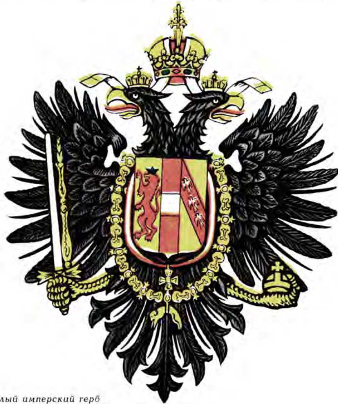
Малый имперский герб Австрии начала XX века.

В 1804 году, когда Наполеон принял титул французского императора, тогдашний австрийский монарх Франц II также провозгласил свои земли империей, объединив все зависимые земли в одно целое. Официальным гербом Австрийской империи стал черный дву-