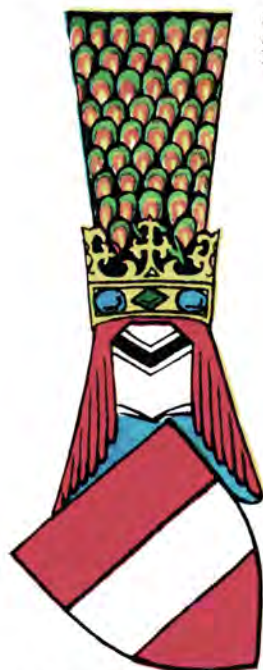
Герб Австрии из гербовника XIV века.