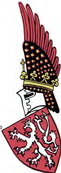
Большой государственный герб Чехословакии. 1920—1939 гг.