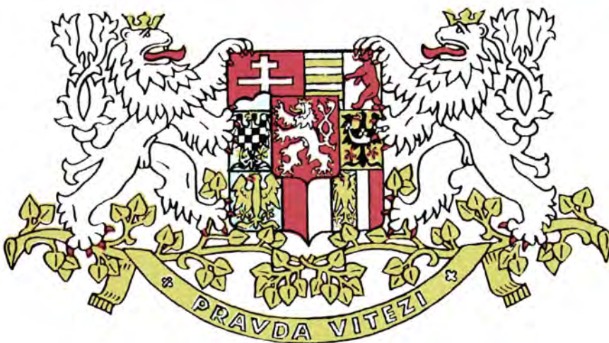
Средний и малый гербы Чехословакии. 1920—1939 гг.