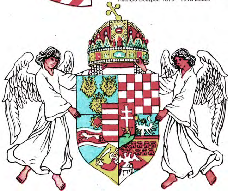
Герб Венгерского королевства в составе Австро-Венгрии 1915 — 1918 годов.

бело-зеленым флагом, а с венгерского герба впервые за его историю была сброшена корона. В 1867 году была создана двуединая Австро-Венгерская монархия, и хотя ее государственный флаг остался чисто австрийским (лишь в 1915 году на нем рядом с австрийским гербовым щитом появился венгерский), принятый одновременно торговый флаг представлял собой комбинацию австрийского (левая часть) и венгерского (правая часть) флагов и гербов. В качестве местного флага стал использоваться трехполосный венгерский флаг.