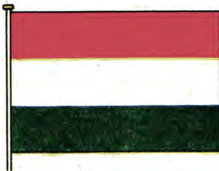
Государственный флаг Венгерской Республики.

К 1202 году относится появление первого венгерского герба, также состоявшего из красных и белых горизонтальных полос, число которых неоднократно менялось. В середине XIII века появляется еще один венгерский герб — таких же цветов, но уже с изображением шестиконечного белого креста на красном поле. В 1305 году под крестом появились три зеленых