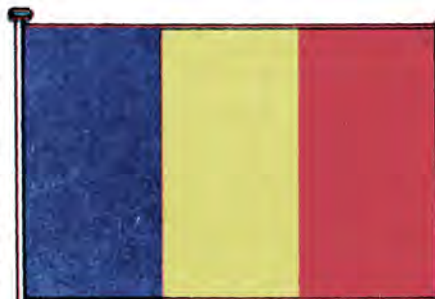
Государственный флаг Румынии

В 1859 году, после объединения Валахии и Молдовы под властью молдавского князя Александра Кузы, флаг видоизменился. На горизонтальных полосах тех же цветов изобража-