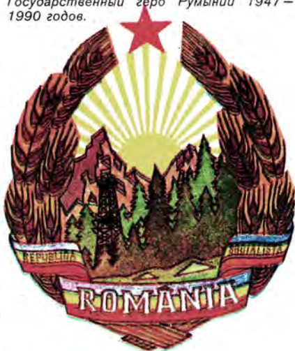
Государственный герб Румынии 1947—1990 годов.

После свержения в 1866 году Александра Кузы реакционным боярством на престоле оказалась чуждая румынскому народу немецкая династия Гогенцоллерн-Зигмаринген. С этого времени, а точнее — с 1872 года, полосы флага стали располагаться вертикально. Национальный флаг не имел эмблемы, а в центре государственного изображался коронованный центральный щит утвердившегося в 1867 году герба Румынии. Герб выглядел следующим образом: на фоне мантии с короной два льва поддерживали коронованный щит, на котором вокруг черно-белого родового щитка новой правящей династии располагались эмблемы областей, вошедших в состав преобразованного Румынского государства: Валахии — желтый орел и солнце на синем. Молдовы — желтые голова зубра, звезда и полумесяц на красном, а также герб области Добруджа, захваченной турками еще в 1400 году, на которую претендовала Румыния — два желтых дельфина на синем (после русско-турецкой войны Северная Добруджа в 1878 году отошла к Румынии, а южная оказалась в составе Болгарии). В 1877 году герб был дополнен орденом Звезды Румынии. В 1881 году в связи с провозгла-