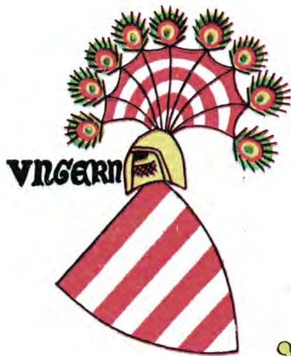
Герб Венгрии из гербовника 1320 года

герским гербом. В 1874 году к изображению, утвердившимся на гербе, добавилась эмблема области Фиуме, а в 1915 году — Боснии и Герцеговины. Герб увенчивала корона, поддерживали ангелы и окружал орден Святого Стефана с цепью.