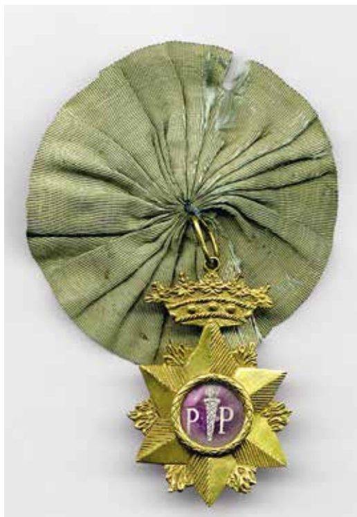
Ил. 13. Знак ложи Северный факел. Инв. № МАС 644. Государственный исторический музей

Бронзовая звезда, являющаяся здесь, как видно на штампе, частью эмблемы, у других белорусских лож становится только декоративной основой знака. А собственно эмблема, соответствующая описанным принципам, перемещается в цветную вставку, выполненную из разных материалов. Также знаки всех лож, как и виленских, имеют корону, но своего оригинального вида.