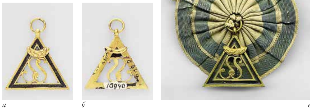
Ил. 8. Знак ложи Школы Сократа: а – лицевая сторона, б – оборотная сторона, инв. № СОМ 10940.

Видимо, в силу этого ложа Школа Сократа была единственной из рассматриваемых лож, у которой известна виньетка с символическим рисунком. Это гравюра Готлиба Кислинга по мотивам картины