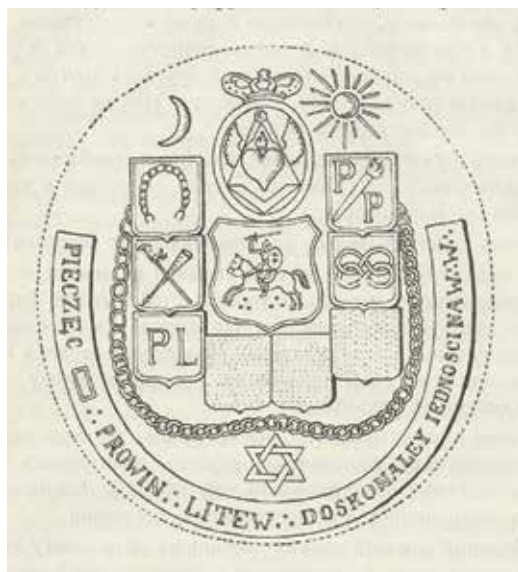
Ил. 1. Печать Провинциальной ложи Совершенного соединения. Воспроизводится по: Добрянский С. Ф. Очерки из истории масонства в Литве. Вильна, 1914. С. 36.

Обозначающие название символы мы видим и на знаке ложи 4 – восьмилучевой звезде из наложенного на квадрат с рифлеными углами ромба с круглой эмалевой вставкой. Изображение в центре на белой эмали то же, что и на печати: скачущий всадник с добавленными внизу