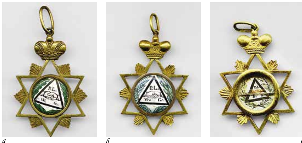
Ил. 17. Знак ложи Друзей человечества: а – инв. № МАС 147. Государственный исторический музей; б – инв. № МАС 675. Государственный исторический музей; в – инв. № СОМ 5874. Смоленский государственный музей-заповедник