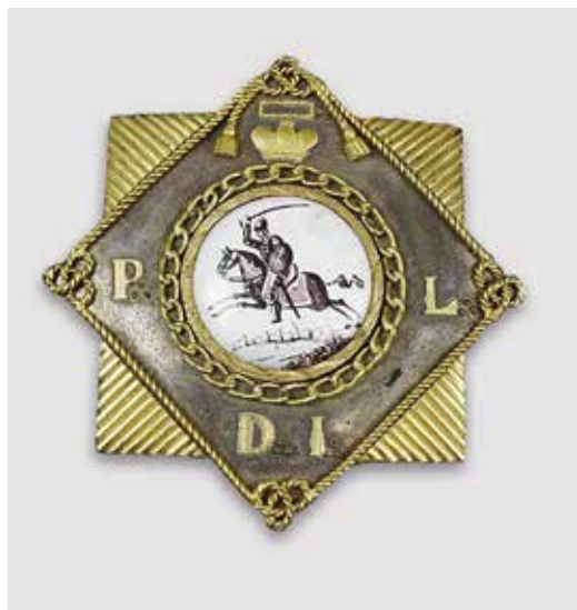
Ил. 2. Знак Провинциальной ложи Совершенного соединения. Инв. № МАС 122. Государственный исторический музей

землей и городом вдали (сравнительно редко встречающийся вариант литовского герба); медальон окружен цепью под такой же короной. По четырем углам ромба зашифровано полное название ложи: «P[ro]v[inc]i[on]al[is] L[it]u[an]i[ca] D[iv]i J[es]u» (Провинциальная литовская ложа Совершенного соединения). По краю ромба наложен шнур с узлами в три петли и кистями сверху, что скорее всего является отсылкой к шнурам единения, изображенным на знаках Великих российских лож Владимира к порядку и Астрей. Крепление знака игольчатое, что подчеркивает его отличие от подвесных знаков символических лож (ил. 2) 5 .