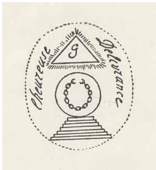
Ил. 18. Штамп ложи Счастливого освобождения. Воспроизводится по: Добрянский С. Ф. Очерки из истории масонства в Литве. Вильна, 1914. С. 45. Российская национальная библиотека