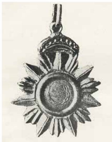
Ил. 19. Знак ложи Счастливого освобождения. Воспроизводится по: Malachowski-Lempicki S. Wolnomularstwo na ziemiach dawnego Wielkiego księstwa litewskiego 1776–1822: Ozięje i materiały. Wilno, 1930. Tabl. XII. Российская национальная библиотека