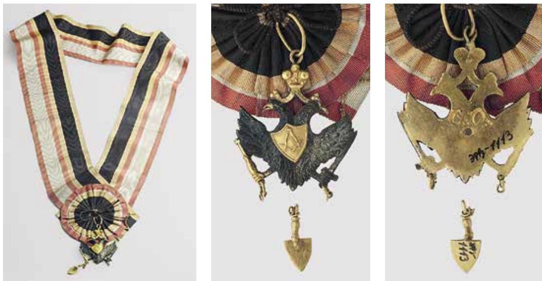
Ил. 10. Знак ложи Славянского орла. Инв. № ЭРРз-1113. Государственный Эрмитаж