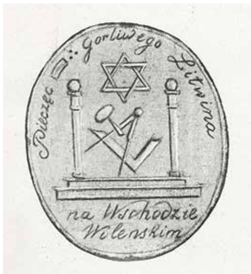
Ил. 4. Печать ложи Усердного литвина. Воспроизводится по: Malachowski-Lempicki S. Wolnomularstwo na ziemiach dawnego Wielkiego księstwa litewskiego 1776–1822 : Ozicje i materjaly. Wilno, 1930. Tabl. VI. Российская национальная библиотека