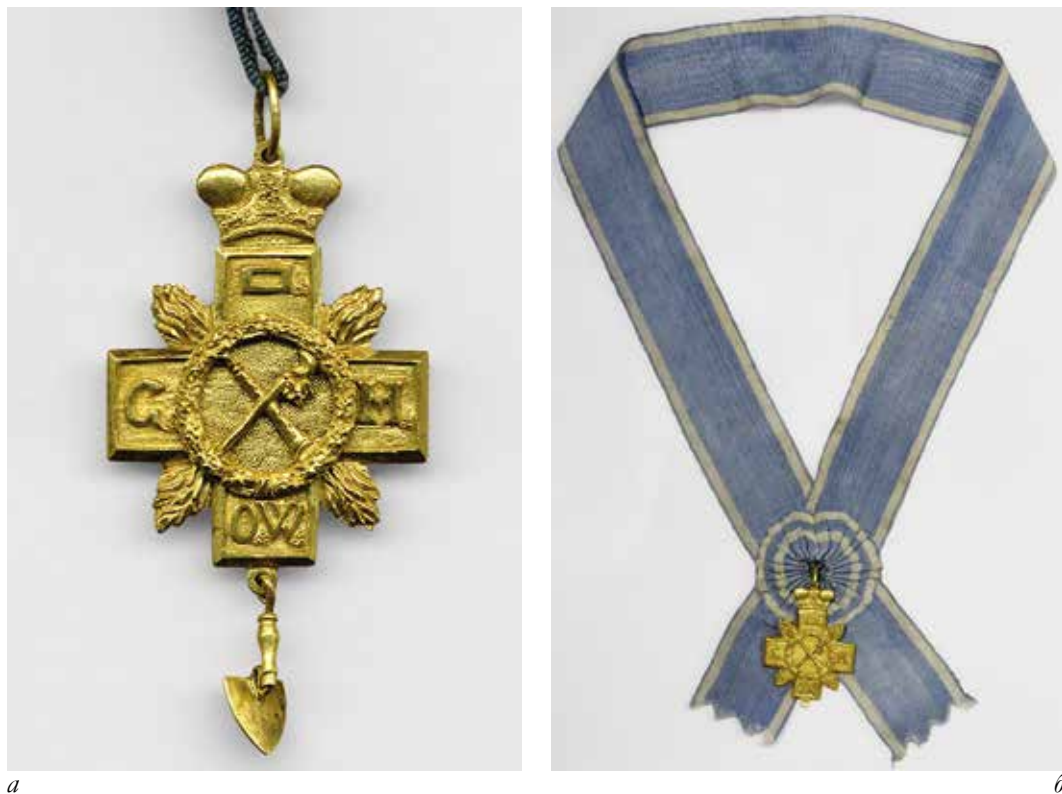
Ил. 7. Знак ложи Доброго пастыря:

а – инв. № МАС 659. Государственный исторический музей;