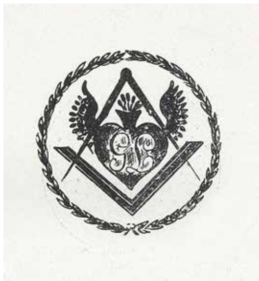
Ил. 3. Штамп ложи Усердного литвина. Воспроизводится по: Malachowski-Lempicki S. Wolnomularstwo na ziemiach dawnego Wielkiego księstwa litewskiego 1776–1822 : Ozicje i materjaly. Wilno, 1930. Tabl. VI. Российская национальная библиотека