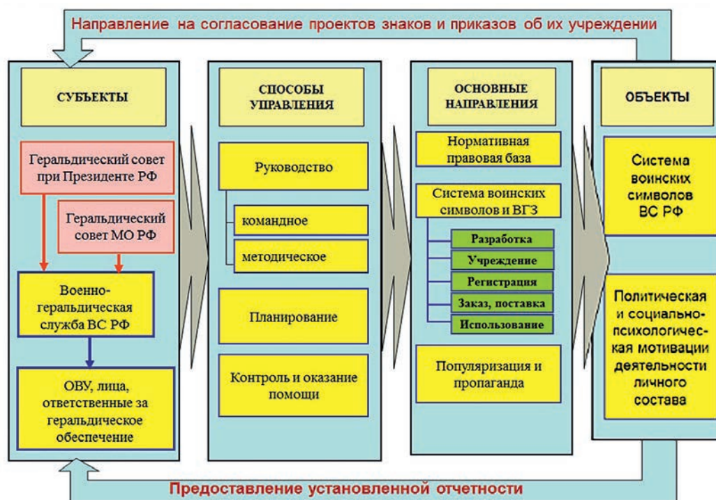
Ил. 2. Система геральдического обеспечения Вооруженных сил Российской Федерации

положением и/или, как в Министерстве обороны России, семантическим пунктом его описания, он становится официальным символом .