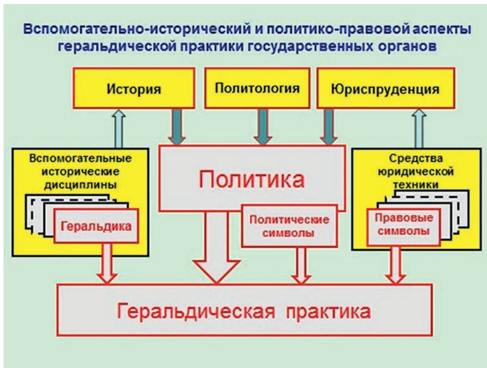
Ил. 3. Вспомогательно-исторический и правовой аспекты геральдической практики государственных органов

и закономерности метанаук: философии и семиотики, а также ряда общественных наук: истории, политологии, юриспруденции, культурологии и др.