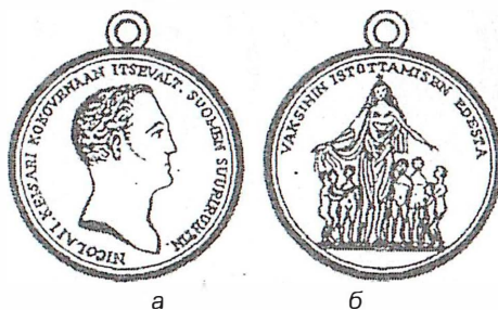
Рис. 15. Медаль «За прививание оспы» (для финнов) (1803 год): а – лицевая сторона; б – оборотная сторона.

В 1830 году специально для прививальщиков в Великом княжестве Финляндском была таюже учреждена медаль «За прививание оспы» – с надписями на финском языке (рис. 15).