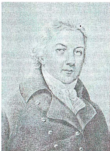
Рис. 8. Эдуард Дженнер.

Дженнер потратил еще много времени, чтобы доказать на новых испытуемых действенность своего метода. В 1798 году он опубликовал трактат о результатах своих опытов, после чего вакцинация стала распространяться по всему миру.