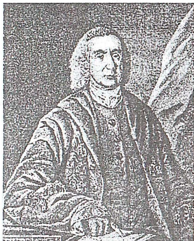
Рис. 4. Томас Димсдель.

Тем не менее, самоотверженный поступок Екатерины вызвал волну злопыхательства. В связи с этим в письме к французскому писателю и философу Вольтеру она писала: