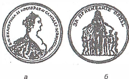
Рис. 13. Медаль «За прививание оспы» (1827 г.): а - лицевая сторона; б - оборотная сторона.

Чеканились и малые (диаметром 28 мм) золотые и серебряные медали с надписью «За прививание оспы» (рис. 13).