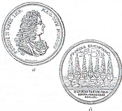
Рис. 2. Медаль на кончину императора Петра II: а – лицевая сторона; б – оборотная сторона.