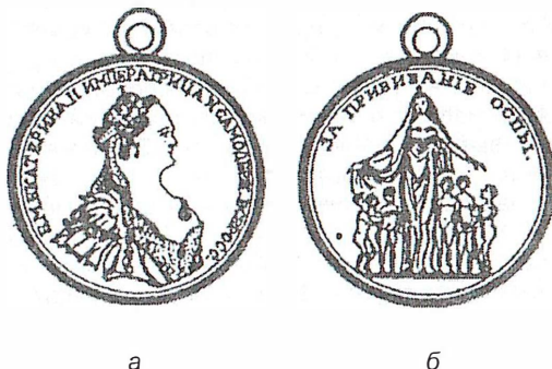
Рис. 11. Медаль «За прививание оспы» (1826 г.): а - лицевая сторона; б - оборотная сторона.

каталоге, изданном в 1908 году. Выпускались они диаметром 40 мм того же екатерининского типа, но теперь с ушком для ношения на орденской ленте (рис. 11). Золотой медалью награждались врачи, священники и чиновники – организаторы прививальных пунктов. Серебряные предназначались для «прививальщиков – простолюдинов».