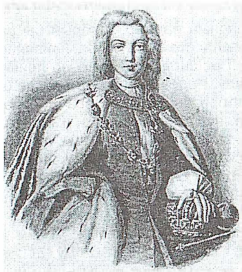
Рис. 1. Император Петр II.

В память о кончине императора Петра II медальером Ф.Вестнером была выбита серебряная медаль диаметром 45 мм с изображением на ее лицевой стороне профильного погрудного портрета усопшего, а на оборотной - семи кипарисов. Все надписи на медали – на латинском языке 11 (рис. 2).