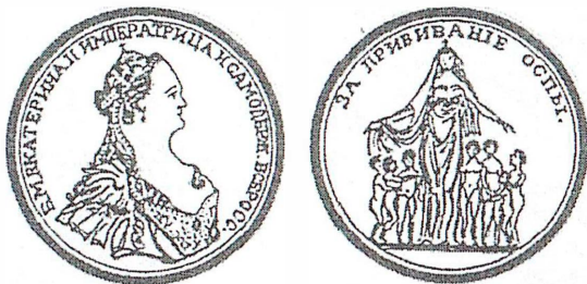
а б Рис. 6. Медаль «За прививание оспы» (1768 год): а – лицевая сторона; б – оборотная сторона.

Для более успешного развития оспопрививания было решено поощрять подвижников сего дела. По указанию Сената, Императорское вольное экономическое общество 32 12 октября 1768 года в день привития оспы самой императрице Екатерине II учредило медаль «За прививание оспы» (рис. 6).