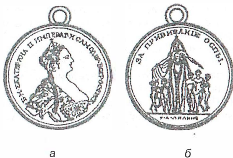
Рис. 14. Медаль «За прививание оспы» (1826 г.): а - лицевая сторона; б - оборотная сторона.

Малая серебряная, медаль, идентичная вышеописанной, была учреждена вместе с большой 16 февраля 1826 года (рис. 14).