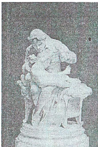
Рис. 9. Первый шаг практической иммунологии был запечатлен в мраморе на века скульптором Монтеверде.