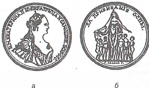
Рис. 12. Медаль «За прививание оспы» (1827 г.): а - лицевая сторона; б - оборотная сторона.

Встречаются также большие золотые медали без ушка (рис. 12). Ими награждали священников и чиновников для настольного хранения. Аналогичная медаль, но с ушком предназначалась прививальщикам оспы. По данным С.М.Гинсбурга, таких медалей было отчеканено на Санкт-Петербургском монетном дворе всего лишь 16 штук 61 .