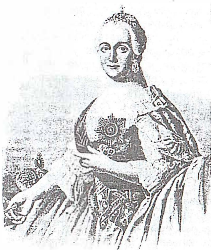
Рис. 3. Императрица Екатерина II.

1 ноября 1768 года Димсдель привил оспу сыну Екатерины будущему императору Павлу I. «Оспенная материя» для этого была взята от младшего сына придворного аптекаря Брискорна 19 .