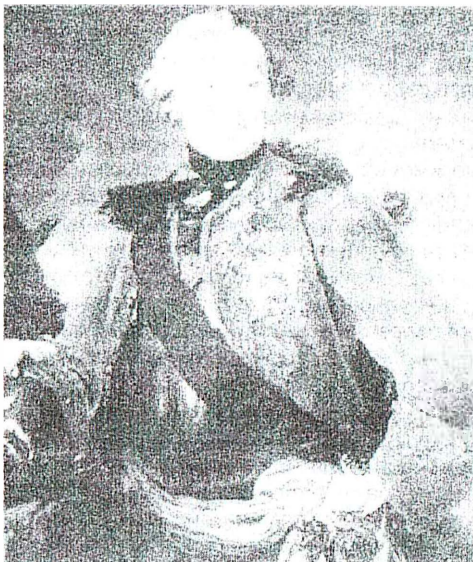
Рис. 2. Г.Г. Орлов

Григорий Григорьевич Орлов родился 17 октября 1734 года и был вторым сыном в семье генерал-майора Григория Ивановича Орлова, старого служки, бывшего некоторое время губернатором Новгорода.