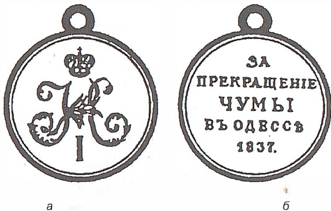
Рис. 5. Медаль «За прекращение чумы в Одессе 1837 г.» (1838 г.): а - лицевая сторона; б - оборотная сторона

Медаль имела форму круга диаметром 28 мм. На лицевой стороне медали под императорской короной крупное изображение витиеватого вензеля имени императора Николая I. Какие-либо надписи на лицевой стороне отсутствуют. На оборотной стороне во все поле медали горизонтальная надпись в пять строк: «ЗА = ПРЕКРАЩЕНИЕ = ЧУМЫ = ВЪ ОДЕССЕ = 1837».