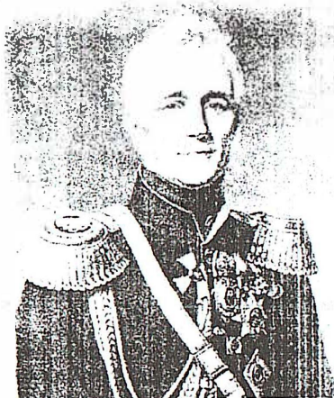
Рис. 4. Граф М.С. Воронцов

Всеподданнейше испрашиваю дозволения Вашего Императорского Величества сделать вслед за сим всеподданнейшее мое представление о награждении некоторых чиновников, медиков и граждан по объявлении другим Монаршего Вашего Императорского Величества благоволения. Смею уверить Вас, Всемиловитейший Государь, что в сем случае будут руководить мною строгая истина и безпристрастие». 45