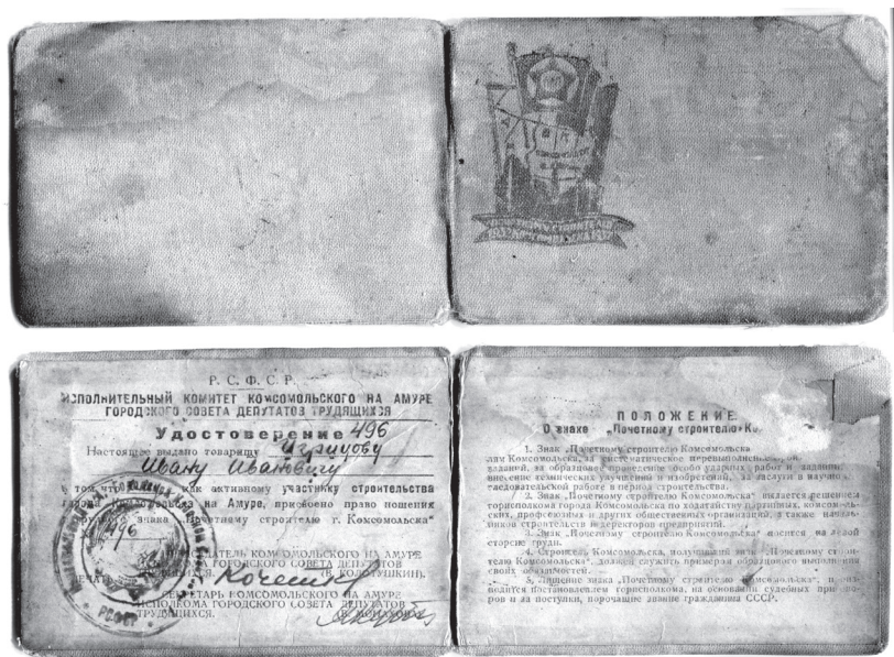
Рис. 2. Удостоверение к знаку «Почетному строителю Комсомольска 1932–1937»

Через два года в одной из дальневосточных типографий было изготовлено удостоверение к знаку. В нем указывались фамилия, имя и отчество награжденного и порядковый номер, соответствовавший номеру на знаке. Здесь также был приведен текст «Положения» о знаке. Удостоверение подписывалось председателем и секретарём горисполкома, на нем проставлялась гербовая печать горисполкома (рис. 2).