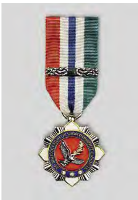
Ил. 8. Знак отличия «За милосердие и благотворительность». Лицевая сторона