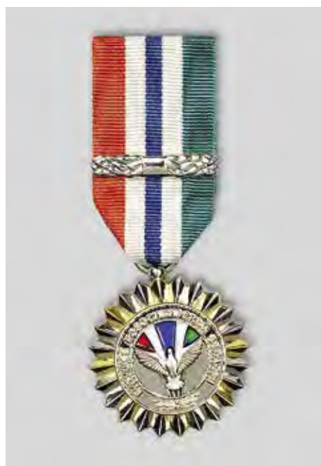
Ил. 9. Знак отличия «Будущее Новосибирской области». Лицевая сторона