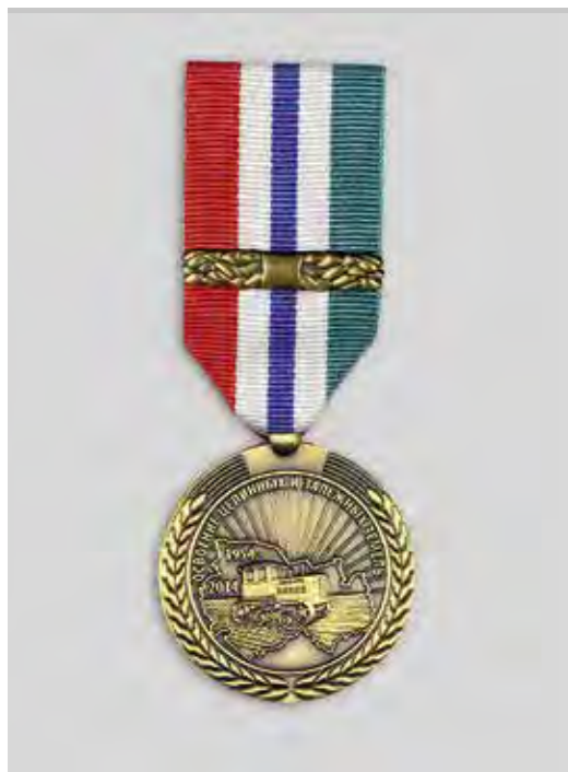
Ил. 16. Юбилейная медаль «60 лет освоения целинных и залежных земель в Новосибирской области». Лицевая сторона