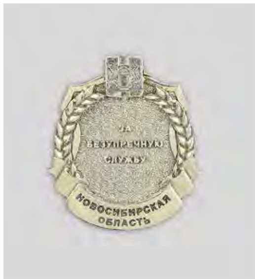
Ил. 11. Почетный знак «За безупречную службу». Лицевая сторона

По инициативе министерства юстиции НСО учреждено почетное звание «Заслуженный юрист Новосибирской области» 14 . В то же время в большинстве отраслей подобного рода награды отсутствовали.