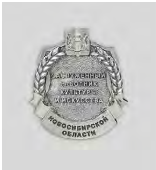
Ил. 13. Нагрудный знак «Заслуженный работник культуры и искусства Новосибирской области». Лицевая сторона

овладении ими профессиональными знаниями, а также в проведении эффективной работы по их воспитанию, повышению общественной активности и формированию гражданской позиции 22 (ил. 18).