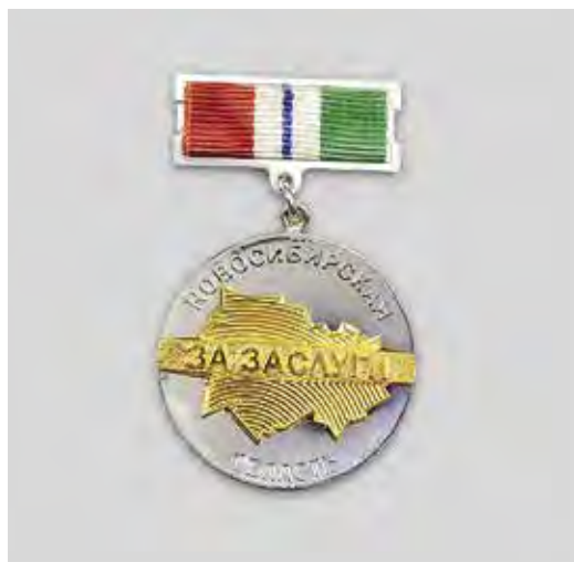
Ил. 1. Знак отличия «За заслуги перед Новосибирской областью». Лицевая сторона

лиц, удостоенных наград) и губернатора НСО (принимает решение о награждении, утверждает их описание и изображение), важную роль в формировании наградной системы играет комиссия по наградам НСО и привлекаемые в качестве экспертов члены геральдической комиссии при правительстве НСО 2 .