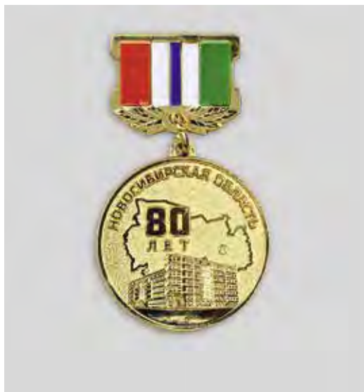
Ил. 15. Юбилейная медаль «80 лет Новосибирской области». Лицевая сторона