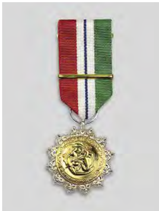
Ил. 3. Знак отличия «За материнскую доблесть». Лицевая сторона

Государственная премия Новосибирской области присуждается гражданам, проживающим в НСО, а также коллективам, состоящим не более чем из десяти человек, за значительный вклад в развитие гуманитарных, естественных и технических наук, соответствующий уровню передовых отечественных технологий, разработку и (или)