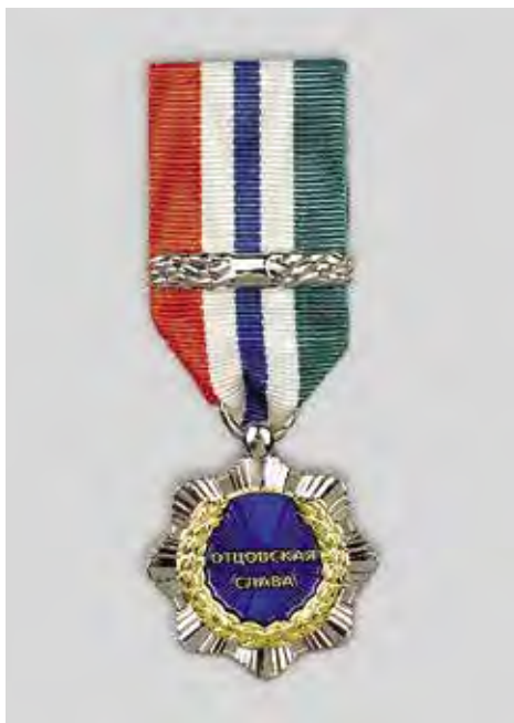
Ил. 6. Знак отличия «Отцовская слава». Лицевая сторона