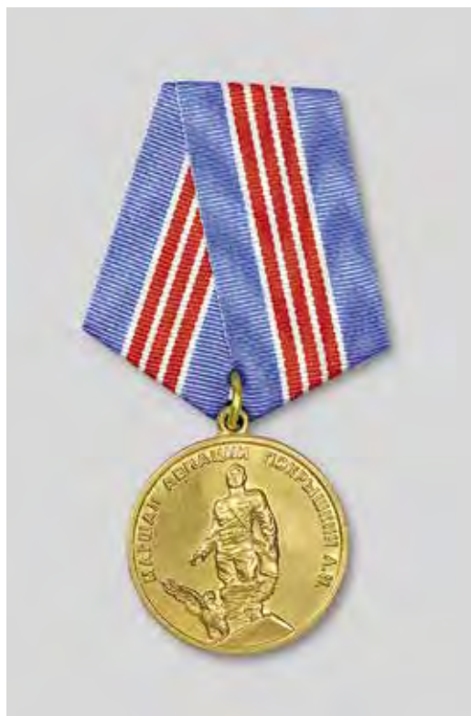
Ил. 10. Медаль Покрышкина. Лицевая сторона

Например, в сфере культуры учреждены тридцать премий главы администрации НСО в сфере культуры и искусства, установлено звание «Почетный работник культуры Новосибирской области» 12 . В сфере образования учреждена ежегодная премия «Почётный работник образования Новосибирской области» пяти лучшим педагогическим работникам 13 .