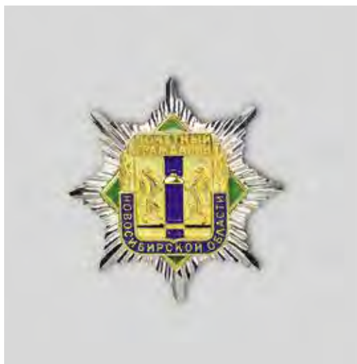
Ил. 5. Нагрудный знак к почетному званию «Почетный гражданин Новосибирской области». Лицевая сторона