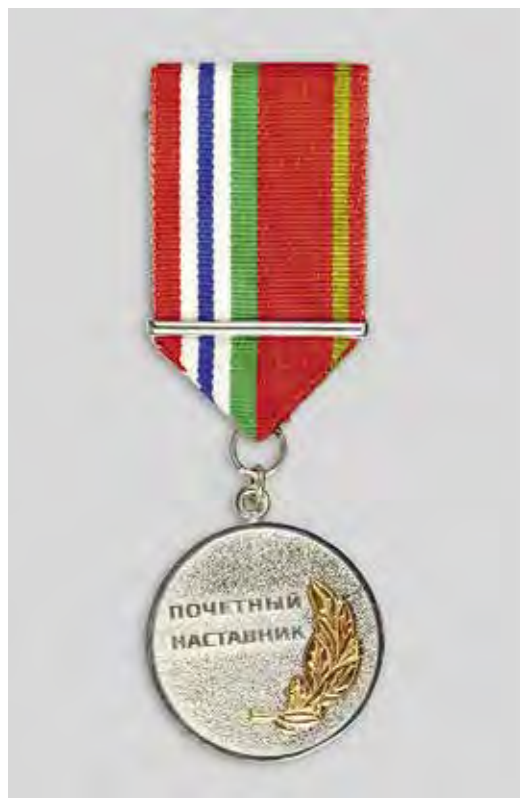
Ил. 18. Знак отличия «Почетный наставник Новосибирской области». Лицевая сторона