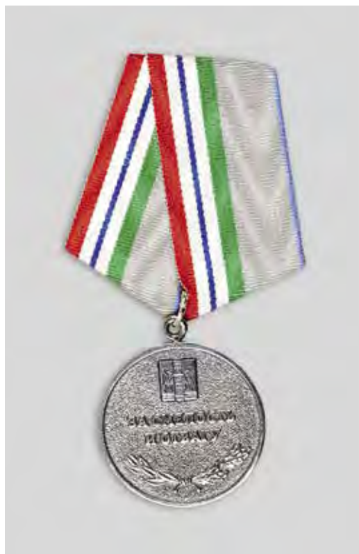
Ил. 19. Медаль «За смелость и отвагу». Лицевая сторона

к кандидатам на награждение государственными наградами РФ и не многочисленностью их вручения, награды НСО, с одной стороны, позволяют получить общественное признание и уважение более широкому числу граждан и являются важной формой социальной поддержки. Помимо единовременного денежного вознаграждения многие награды дают право на получение льгот, важных для работников бюджетной сферы, ветеранов, малообеспеченных семей. Несомненно, позитивное значение наградной системы в формировании положительного отношения жителей области к своей «малой» Родине». Более четкое правовое регулирование на федеральном уровне будет способствовать укреплению региональных наградных систем и повышению их роли и значения в общественной жизни.