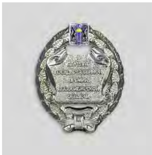
Ил. 4. Нагрудный знак лауреата Государственной премии Новосибирской области. Лицевая сторона

Специалисты завода «Атолл» подготовили эскизы нагрудного знака, которые из-за нехватки времени не рассматривались по сложившейся традиции геральдической комиссией и изготовили первую партию в количестве 6 экземпляров. 29 сентября 2012 года