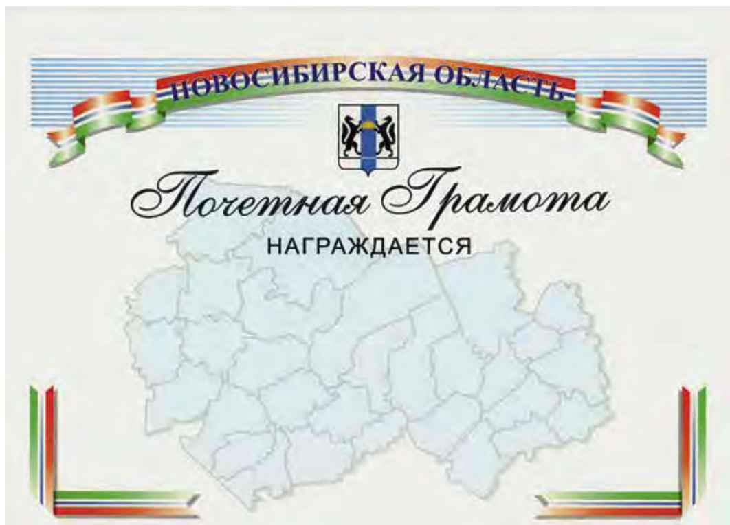
Ил. 2. Почетная грамота Новосибирской области

Разработка эскизов знака отличия была поручена геральдической комиссии при главе администрации НСО и велась параллельно с разработкой проекта закона о наградах.