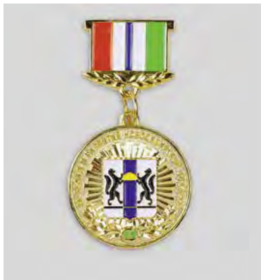
Ил. 14. Памятная медаль «За вклад в развитие Новосибирской области». Лицевая сторона