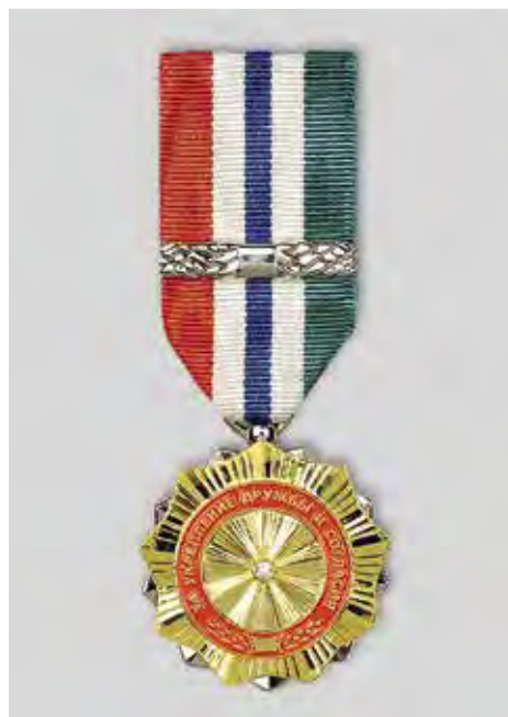
Ил. 7. Знак отличия «За укрепление дружбы и согласия». Лицевая сторона