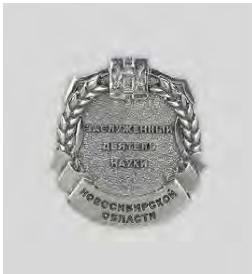
Ил. 12. Нагрудный знак «Заслуженный деятель науки». Лицевая сторона