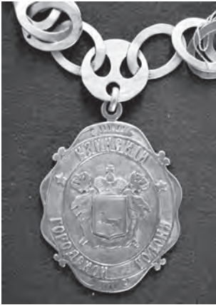
Рис. 4. Нагрудный знак каинского городского головы. Конец XIX в. (Новосибирский государственный краеведческий музей. – ГИК. № 9561).

краеведческом музее, вместо герба Каинска изображен герб Томской губернии, но с измененным внешним обрамлением, положенным для столичных городов 12 (рис. 4). Такая же ситуация характерна для других городов Томской губернии, располагавшихся на территории современной Новосибирской области. Герб Томской губернии в начале XX в. помещался на печатях Кольванской городской управы (Кольвань имела официально утвержденный в 1846 г. герб) и Новониколаевской городской управы 13 .