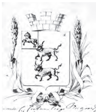
Рис. 2. Проект герба города Каинска. 1866 г. (Российский государственный исторический архив. – Ф. 1343. – Оп. 15. – Д. 301. – Л. 18–20).

По Городовому положению 1870 г. вводились должностные знаки с городским гербом. При исполнении служебных обязанностей их обязательно должны были носить городские головы, члены городских управ, исполнительных комиссий, торговых депутатий, а также чины торговой и хозяйственной полиции 11 . На лицевой стороне знака помещался герб города с надписью по краям должности владельца, на оборотной стороне обозначалось время утверждения Городового положения – «16 июня 1870 года». Однако этот пункт на местах часто не соблюдался. Широкое распространение во второй половине XIX – начале XX в. получило использование вместо имеющегося городского губернского герба (рис. 3). На серебряном знаке каинского городского головы, хранящемся в Новосибирском государственном