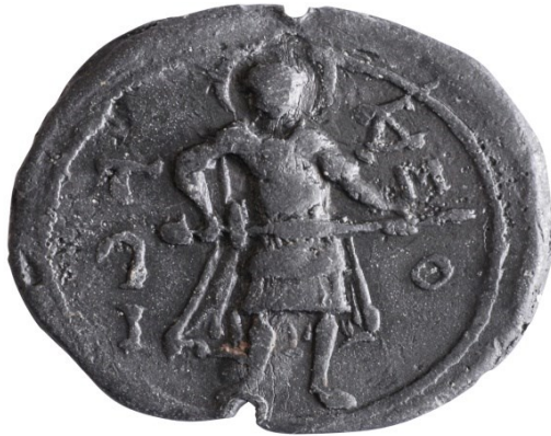
Печать Всеволода Большое Гнездо. Из собрания Суздальского музея (материалы раскопок 1982 г. в г. Суздале на территории Кремля)

Что касается актовых печатей князя Всеволода Большое Гнездо, то ему принадлежал и другой вариант актовой печати, на обеих сторонах которой были изображены святые Георгий и Дмитрий. Это были патрональные святые Всеволода в крещении Дмитрия и его отца Юрия Долгорукого в крещении Георгия 12 . Никаких изображений льва или барса на данных печатях мы не видим.