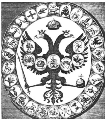
Российские гербы в дневнике И. И. Корба. Владимирский герб на правом крыле орла

О происхождении владимирского герба существует несколько гипотез. Первая объясняет появление владимирского льва в «Титулярнике» 1672 года тем, что это изображение было родовым знаком и даже гербом владими́ро-суздальских князей в XII—XIII веках. Для подтверждения этой версии приводится изображение льва в декоративном оформлении храмов, построенных на Владимирской земле в XII—XIII веках, например, в настенных рельефах Успенского (1158—1161 гг.), Дмитриевского (1193—1197 гг.) соборов во Владимире, церкви Покрова богородицы на Нерли (1156 г.) и особенно в главном рельефе Георгиевского собора в Юрьеве-Польском (1230—1234 гг.), где лев изображен на воинском щите, там, где традиционно помещали герб западноевропейские рыцари 5 .