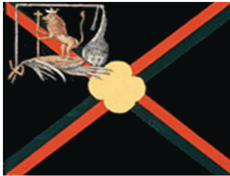
Знамя Владимирского пехотного полка 1712 г.

Владимирскую эмблему начинают изображать на некоторых знаменах русской армии. В Московской Оружейной палате хранится прапор конца XVII века с владимирской эмблемой 14 . Изображение владимирской эмблемы встречается в «Знаменном гербовнике» 1712 года на знаменах Владимирского пехотного и Владимирского драгунского полков. Владимирский пехотный полк был сформирован в 1700 году, Владимирский драгунский полк — в 1701 г. 15 Знамя Владимирского пехотного полка было черным с синим, крестообразно разделенным зелеными и красными полосами, с изображением в верхнем углу, у древка, золотого льва 16 .