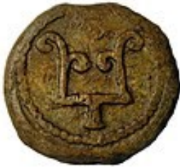
Знак Рюриковичей на печати Андрея Боголюбского

Что касается актовых печатей князя Всеволода Большое Гнездо, то ему принадлежал и другой вариант актовой печати, на обеих сторонах которой были изображены святые Георгий и Дмитрий. Это были патрональные святые Всеволода в крещении Дмитрия и его отца Юрия Долгорукого в крещении Георгия 12 . Никаких изображений льва или барса на данных печатях мы не видим.