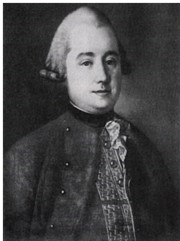
Александр Андреевич Волков. Портрет неизвестного автора 1769 г.

географические, природные, экономические, исторические и иные особенности уездов.