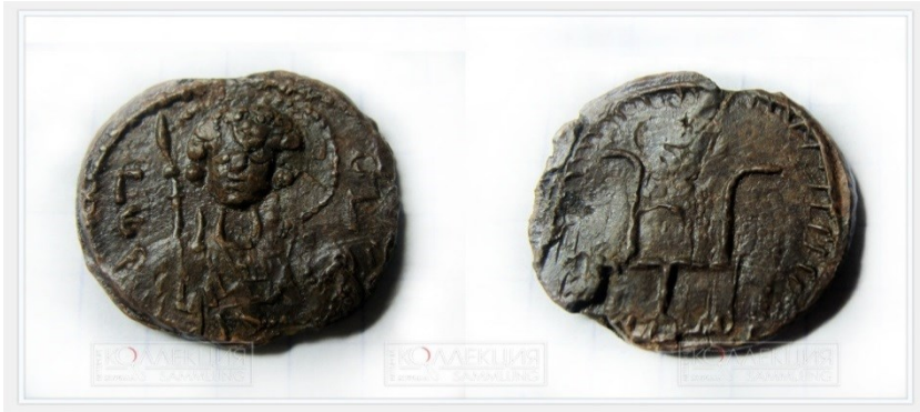
Печать Юрия Долгорукого

Хотелось обратить внимание и на другое. В домонгольской Руси роль княжеских гербов выполняли знаки Рюриковичей. Зародившись в конце IX века, эта своеобразная геральдическая система окончательно сложилась к началу XI века 10 . К настоящему времени найдены и атрибутированы печати великих владимиро-суздальских князей Юрия Долгорукого (1090-е — 1157), Андрея Боголюбского (1111—1174), Всеволода Большое Гнездо (1154—1212). На данных печатях на одной стороне (аверсе) изображался знак Рюриковичей, а на другой (реверсе) — изображение небесного патрона. При этом у каждого князя был свой вариант знака Рюриковичей 11 .