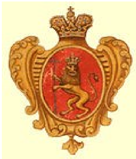
Герб Владимирского полка в «Знамённом гербовнике» 1730 года