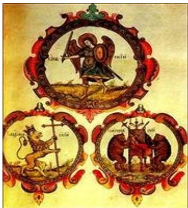
Владимирский лев в Титулярнике 1672 года