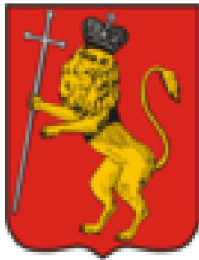
Владимирский герб 1781 года

Жёлтая (золотая) корона в публикации 21-го тома ПСЗ РИ в 1830 году превратилась в железную. Происхождение этой короны вызывает споры у геральдистов. По-видимому, самое простое объяснение появления подобной короны у владимирского герба связано с опечаткой при издании указа Екатерины II 16 августа 1781 года в Полном собрании законов Российской империи