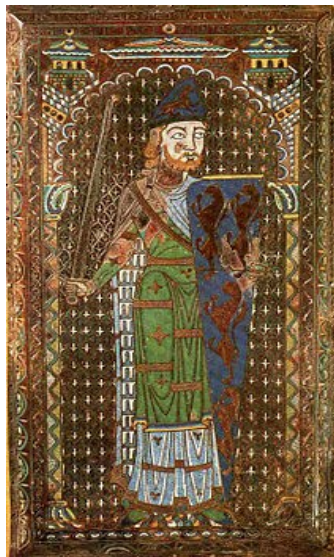
Рис. 1. Слева герб Жоффруа Плантагенета, графа Анжуйского; справа надгробная плита Жоффруа Анжуйского, изображающая щит с гербовыми эмблемами его рода