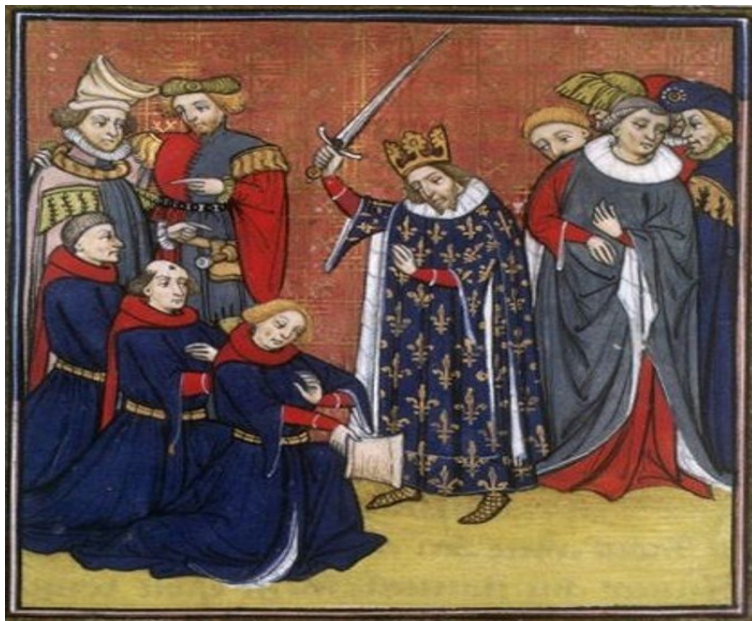
Рис. 2. Церемония посвящения в рыцари французским королем Иоанном II (1319—1364). Миниатюра XIV—XV вв. Париж, Национальная библиотека Франции