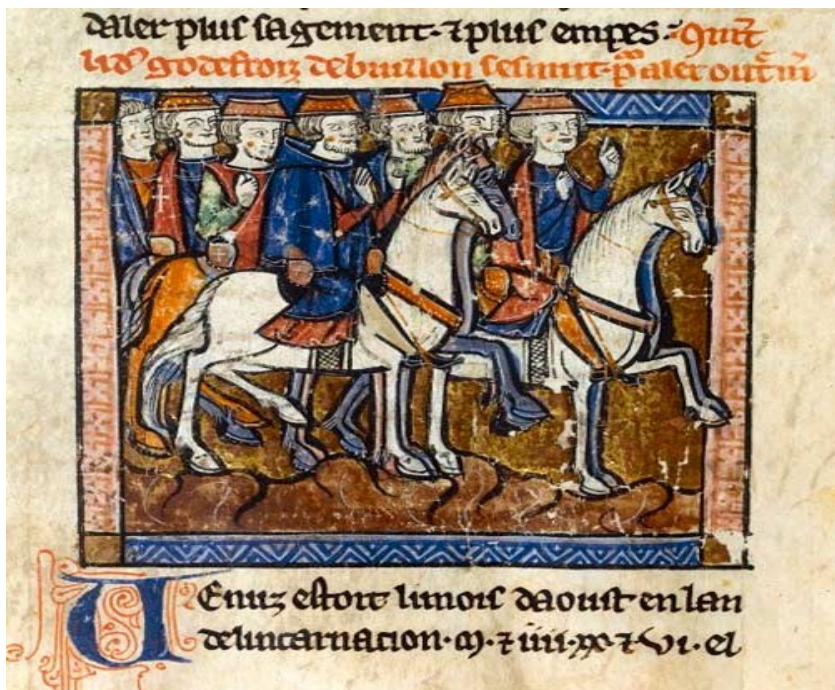
Рис. 4. Крестоносцы отправляются в первый крестовый поход. Миниатюра из рукописи Гийома Турского, XIII в.

В-четвертых, на развитие европейской средневековой геральдики оказали влияние рыцарские турниры — военные состязания представителей благородного сословия. Доказательством принадлежности к нему рыцаря являлся фамильный герб. Подобные турниры проводились с большой пышностью, помпезностью. Здесь проходили смотры оружия и нарядов, пиршества. Естественно, что во время этих церемоний большое внимание уделялось различного рода геральдическим эмблемам, изображавшимся на оружии, знаменах, занавесях, походных шатрах и т. д. (рис. 5). Организаторами и руководителями турниров были герольды, выбиравшиеся из опытных и знатных воинов. Позднее герольды стали назначаться императором и королями тех или иных стран. Так, во Франции самая ранняя организация службы герольдов относится ко времени правления короля Людовика VI,