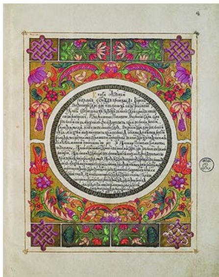
Рис. 7. «Царский титулярник» 1672 года. «Большая государева книга, или Корень российских государей», титульный лист из экземпляра Эрмитажа с заглавием, вписанным в круг

Наряду с городскими гербами существовали гербы ремесленных цехов, купеческих гильдий, представителей духовенства, знатных горожан — бюргеров. В XVI—XVII веках герботворчество достигает своего пика. Однако постепенно с отмиранием средневековых общественных отношений геральдика теряет свое значение и смысл.