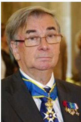
Рис. 9. Георгий Вадимович Вилинбахов, председатель Геральдического совета при Президенте Российской Федерации, государственный герольдмейстер

в Герольдию при Сенате, а в 1848 году — в Департамент герольдии Сената. В 1857 году было создано Гербовое отделение Департамента герольдии Сената. 22 ноября 1917 года решением советского правительства все департаменты Сената были закрыты. Важнейшей заслугой Герольдии перед исторической наукой была подготовка и издание с 1797 года «Общего гербовника дворянских родов Всероссийской империи». До 1917 года было составлено 20 и опубликовано 10 томов.