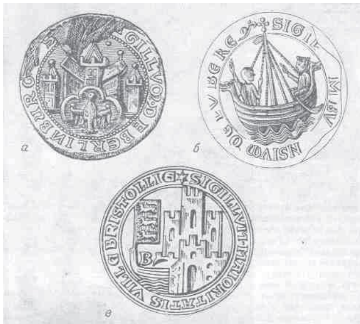
Рис. 6. Образцы печатей средневековых городов:

помещаться на гербовый щит и становятся гербами в полном смысле этого слова. По поводу времени окончательного становления городской геральдики среди историков существуют различные точки зрения. Большинство исследователей относят время возникновения городской геральдики в Европе к XIV—XV векам.