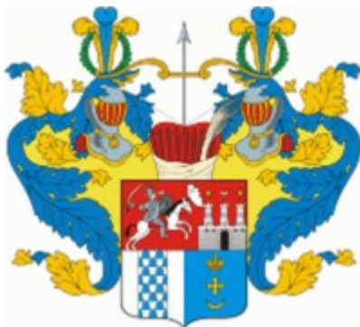
Рис. 8. Герб дворянского рода Нарбековых

С целью упорядочения и организации процесса герботворчества Петром I была создана Герольдмейстерская контора при Сенате. Это ведомство занималось созданием дворянских и территориальных гербов. В 1763 году оно было преобразовано