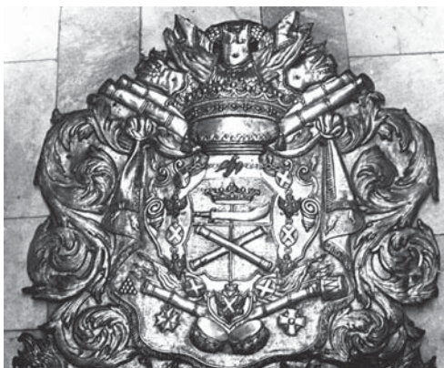
Герб Апраксиных с ворот усадьбы Ольгово. 1788 г. Музей-заповедник «Дмитровский Кремль»

В собрании музея хранятся предметы с изображениями гербов XIX в., идентичными «Общему гербовнику»: на экслибрисе 9 и матрице печати 10 , на которой есть круговая надпись «Печать Локотского управления г[осподина] В.В. Апраксина».