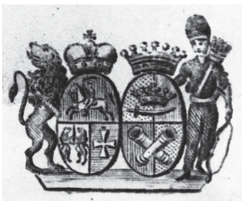
Герб Апраксиных и князей Голицыных на фаянсовой тарелке. 1793 г. Музей-заповедник «Дмитровский Кремль».