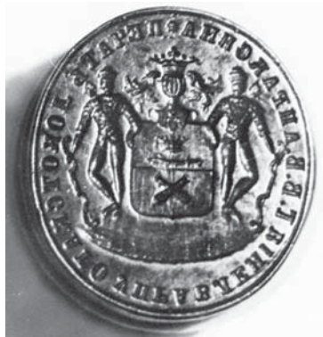
Герб Апраксиных на печати Локотского управления. Конец XIX в. Музей-заповедник «Дмитровский Кремль»

Изменения иконографии герба Апраксиных в XVIII–XIX вв. касались второстепенных элементов, защитовых украшений и цветов полей. Фигуры щита, обеспечивая идентификацию вариантов, оставались неизменными. Вариативность детерминировалась стремлением индивидуализировать родовое изображение, обозначить границу семейного и личного обладания гербом.