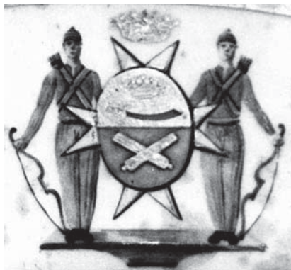
Герб Апраксиных на фарфоровой тарелке. Рубеж XVIII–XIX в. Музей-заповедник «Дмитровский Кремль»