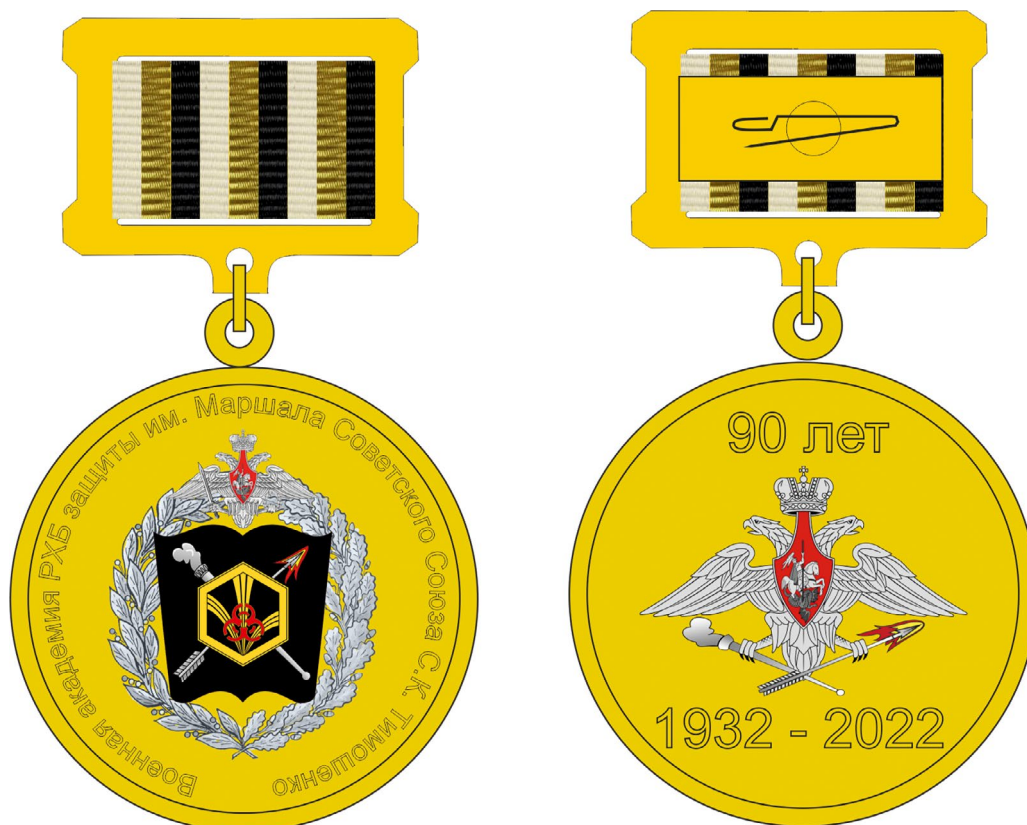
Утвержденный вариант памятного знака «90 лет Военной академии РХБ защиты имени Маршала Советского Союза С.К. Тимошенко»

как одну из задач войск РХБЗ, и пламенеющая стрела, символизирующая применение огнеметно-зажигательных средств.