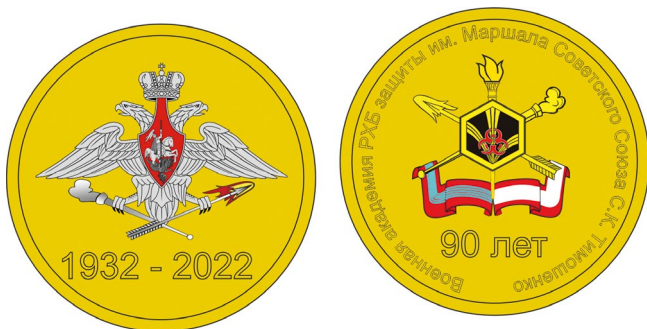
Один из вариантов памятного знака.

На лицевой стороне знака (аверсе) изображена эмблема академии и знак войск, строго соответствующие геральдическим требованиям. Здесь же присутствует сокращенное название военного ВУЗа. На оборотной стороне знака (реверсе) присутствует эмблема Министерства обороны РФ – двуглавый орел с распростертыми крыльями. В лапах орла факел, символизирующий аэрозольную маскировку