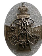
Знак Костромского Михайловского пехотного полка 52x45 С (новодел)