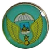
Костромской десантный полк Х18 Т,лак