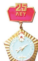
25 лет Костромскому аэроклубу 56x35 Т,ХЭ