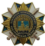
65 лет Областному военкомату 43x43 М, ХЭ, лак