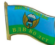
80 лет ВДВ Костромской десантный полк