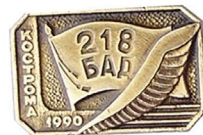
218 авиадесантный батальон 20x31 Ал