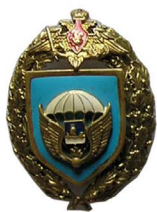
Нагрудный знак Костромского десантного полка 48x35 Т,ГЭ