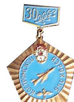
30 лет Костромскому аэроклубу 56x35 Т,ХЭ