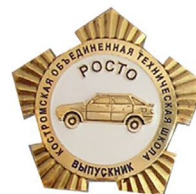
Выпускник РОСТО Кострома 30x32 Дар М.Г. Ригерта