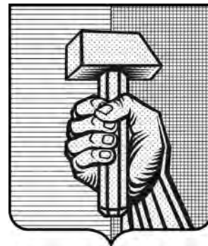
Проект герба для ДНР (художник А. Бахтиозин, г. Донецк; идея — С. Киселев)

Помочь повышению уровня геральдической грамотности, по моему мнению, может только широкое внедрение и распространение родовых и фамильных гербов. А главное то, что сложный процесс разработки таких гербов способствует изучению генеалогии, нахождению своих корней, сплочению людей и восстановлению связей и обретению потерянных родственников, и, не побоюсь «высоких» фраз, — укреплению традиционных ценностей, продолжению рода, патриотическому воспитанию и осознанию людьми причастности к истории страны через историю своей семьи.