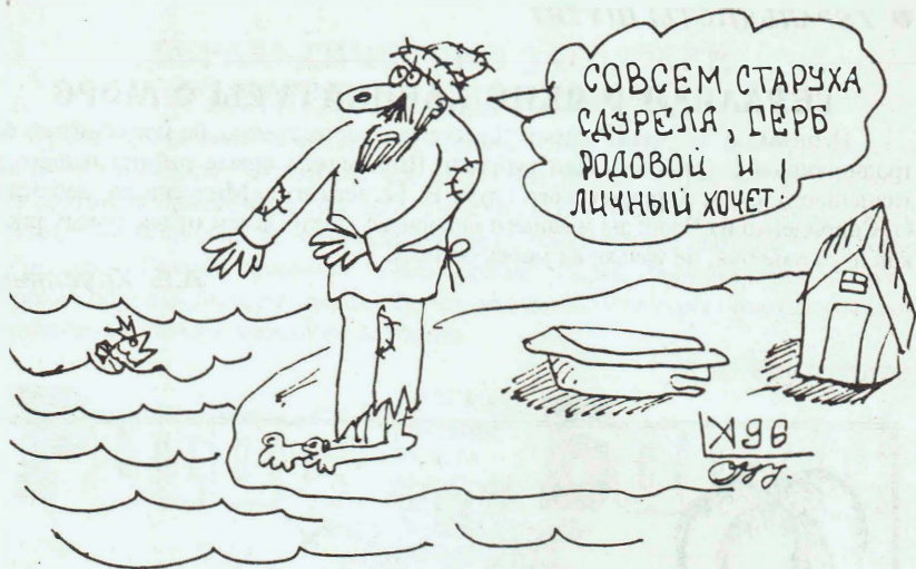
Рисунок А.Б. Хрусталева. Москва