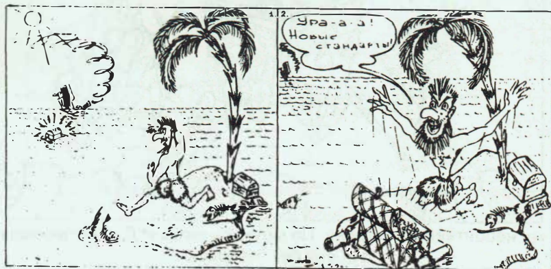
Геральдическая робинзопада Рисунки В.П. Багаева, Минусинск