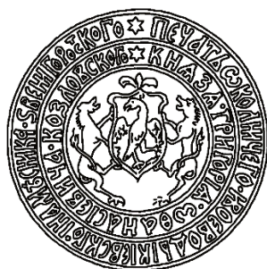
Рис. 1. Печать кн. Г.А. Козловского 1691 г. ( Снимки древних русских печатей / сост. Ф. Бюлер. М., 1880. С. 92 ).

Для изготовления дворянского диплома лейб–кампанец Григорий Яковлевич Травин (1751 г.) представил в Герольдию проект своего дипломного герба. На нем был изображен стреляющий из лука орел, держащий в клюве три стрелы. Щит покрыт княжеской шапкой, окружен наметом, под щитом девизная лента без надписи (рис. 3).