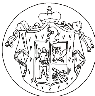
Рис. 9. Печать А.А. Ржевского (Гербовник А.Т. Князева. С. 128, № 380).