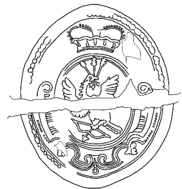
Рис. 6. Печать Н.Т. Ржевского 1710 г. (РГАДА. Ф. 9. Отд. II. № 11. Л. 652 об.).