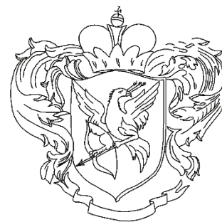
Рис. 3. Проект дипломного герба Г.Я. Травина 1751 г. (прорисовка по: Борисов (Ильин) И.В. Родовые гербы России. М., 1997. С. 48 ).