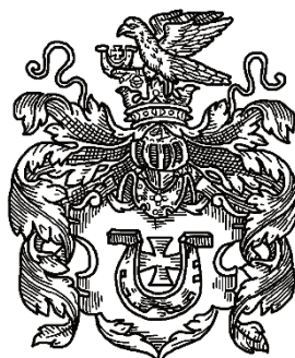
Рис. 2. Герб Ястржембец ( Paprocki V. Gniazdo snoty. Krakow, 1578. S. 36 ).