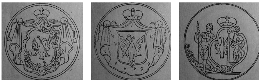
Рис. 4. Печати Волконских в гербовнике Князева

Как отмечал А.Б. Лакиер, «особенного внимания заслуживает место, которое предоставлено родовому знамени, а именно: у старших поколений оно занимает или все поле щита, или средний щиток в гербе, затем у последующих поколений оно помещается в первой, второй части и нередко повторяется накрест» (Лакиер А.Б. Указ. соч. С. 232). Однако с конца XVII в. вопрос о старшинстве Волконских решен не был. Волконские настаивали на своем происхождении от старшего сына князя Юрия Михайловича Тарусского Ивана Толстой Головы. Эту версию в 1688 г. опротестовали князья Репнины, Щербатовы и Лыковы. В результате родословная роспись князей Волконских в Бархатную книгу не вошла (Антонов А.В. Родословные росписи конца XVII в. М., 1996. С. 116–118).