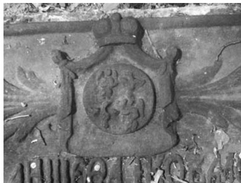
Рис. 2. Герб