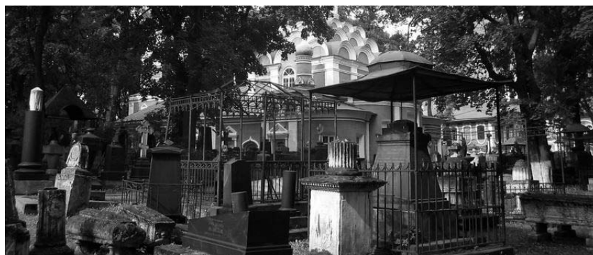
Рис. 1. Некрополь Донского монастыря (общий вид)

стали предметом спекуляции и практичные монахи могли срыть забытые и бедные могилы» 15 . Действительно, к середине XIX в. цены на кладбищенский участок в Донском монастыре достигли огромных по тем временам сумм – в две и даже три тысячи рублей. Однако у Е.В. Николаева было и другое предположение: «Скорее всего, эти надгробия ушли в землю». Это также возможно: при раскопках в Петербурге надгробия XVIII в. извлекают из влажного грунта с глубины до метра.