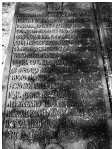
Рис. 1. Общий вид плиты

Герб над эпитафией в верхней (западной) части плиты. Размеры герба по мантии: 27x21.