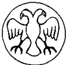
Двуглавый орел на монетах хана Джанибека XIV в. (прорись по В. И. Лавреневу)

Со времен Штауфенов (германских императоров и королей Священной Римской империи 1 138 – 1254 годов, а в 1197 – 1268 годах и сицилийских королей) двуглавый орел стал королевским гербом. Он присутствует на золотых монетах Фридриха II Барбароссы, сицилийских монетах, распространившись по всему христианскому миру.