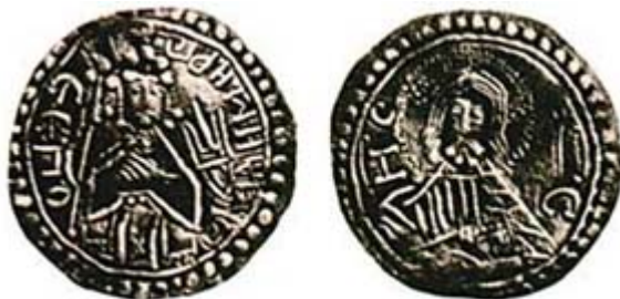
Серебренник Владимира Святославича

1928) должны были закрепить принадлежность Руси к христианскому миру - ведь они появились после крещения Владимира и его женитьбы на византийской принцессе Анне. Кстати, синхронность начала русского чекана с введением христианства на Руси, равно как и в соседних странах - Дании, Норвегии, Швеции, Польше, Венгрии, уже подчеркивал Н.П. Вауэр (Вауэр. С. 301). На некоторых монетах Владимира изображали с нимбом (Ситникова, Спасени. С. 69-77; Кдмрfer. 1993. S. 135). Это, как и византийская корона с двусторонними подвесками и крест, вводило византийскую имперскую символику "в архаический дружинный мир славянизирующихся варягов" (Кдмрfer. S. 134; Свердлов М-В. С. 155-158), утверждало его самого в титуле царя, ведь в Византии, на которую ориентировался Владимир, нимб служил неременным признаком императорского достоинства (Стефани). Об этих же претензиях Владимира свидетельствует и то, его называли царем арабские авторы XI что века (Яхья Антиохийский и Абу-Шоджа Рудраверский) (Кезма. С. 393, 394), некоторые русские памятники (Рорре. 1984).