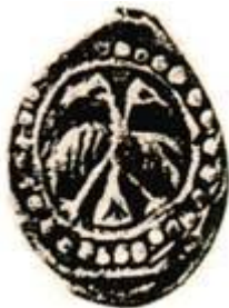
Орел на монете тверского князя Михаила Борисовича XV в.