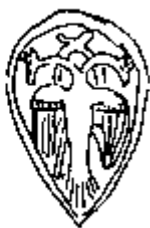
Родовой герб Палеологов (прорисовка по В. И. Лавреневу) и Мангупский орел

Некоторое время казалась более правдоподобной другая гипотеза, будто введение двуглавого орла означало заимствование Русью южнославянского опыта (Хорошкевич. 1973; Соболева. 1976-1; Соболева, Артамонов). В пользу этой гипотезы говорят и временная, и географическая близость, и довольно тесные связи Руси со странами византийского мира. Но прежде чем окончательно решиться на поддержку этой версии, следует обратиться к