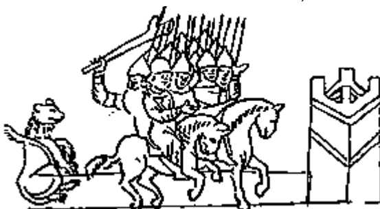
Изгнание Юрия Долгорукого из Переславля-Залесского. Миниатюра Раздвигловской летописи (прорись по А. В. Арциховскому)

"широкопастные, большеротые, углы пасти у них, точно щели бревен, с оскаленными зубами (Вагнер. 1962. С. 256).