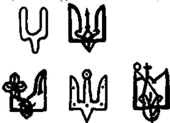
"Знаки Рюриковичей" (схема по Л. В. Янину)

1231). Подобному истолкованию данного знака, на наш взгляд, не противоречит сходство его графического облика с древнейшими индоевропейскими знаками, сохранившимися, в частности, в государственной символике Индии (Neubecker, Rentzmann. S. 358). Христианство активно вбирало в себя древнейшие традиции, чтобы, переплавив их, явить миру новое всеобъемлющее учение.