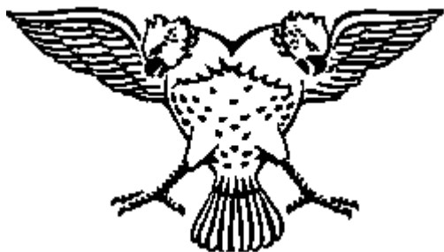
Двуглавая Птица по манускрипту Казвини начала XIII в. (прорись по В. И. Лавреневу)

Со времени крестовых походов двуглавый орел распространяется и по Европе, причем используется первоначально на печатях территориальных княжеств и имперских городов. На печати 1 180 года графа Людвига фон Саарвердена представлен двуглавый орел (Кот. S. 337; Коте-тапп. S. 45 – 69).