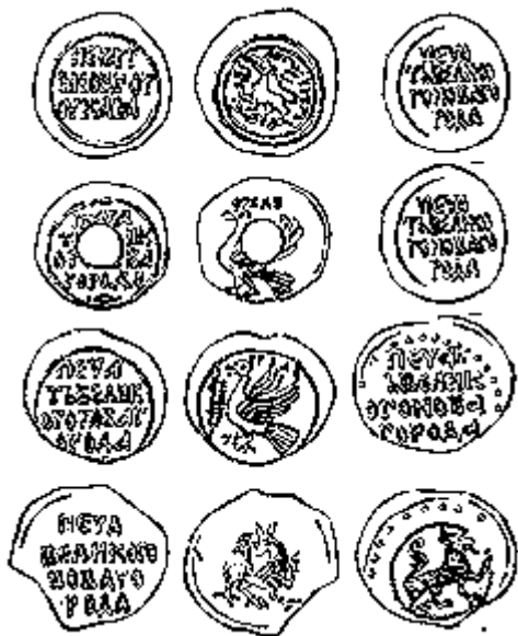
Печати Великого Новгорода XV в. (прорись по В. Л. Янину)

Снижение роли посадников началось уже в XIV веке, когда в начале 70-х годов возник новый, переходный тип государственной печати Новгорода со строчными надписями: "новгородская печать" и "посадника". Такими печатями снабжены два документа - договор с тверским князем Михаилом Александровичем и наказ новгородским послам Юрию и Якиму к тому же князю соответственно 1371 и 1374 - начала 1375 годов (ГВНП. № 15, 17; Янин. 1991. С. 165 - 171). В это время Новгород принял наместников тверского князя, оговорив, впрочем, свободу отказаться от верховенства тверского князя, если он не получит ярлыка на Великое княжение Владимирское: ". Не вынесуть тебе княжения великого из Орды, пойти твоим наместникам из Новгорода проць и из новгородских пригородов" (ГВНП. № 15).