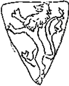
Шведский герб 1250 г.

Итак, несомненно: в тех регионах Русской земли, где вплоть до середины XIII – XIV веков сохранялась крепкая власть или существовало стремление возродить единство региона либо края, князья прибегали к использованию образа льва как символа власти, силы, мужества, великодушия (Лаппо-Данилевский. С. 239). Думается, обращение к образу льва имело более серьезное значение, нежели использование его просто как "личного знака" владими́ро-суздальских и галицких князей (Соболева . 1981. С. 15).