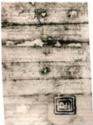
Ордынская тамга на полной грамоте 1494 г.