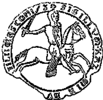
Печать Казимира I Опольского (1211-1236)