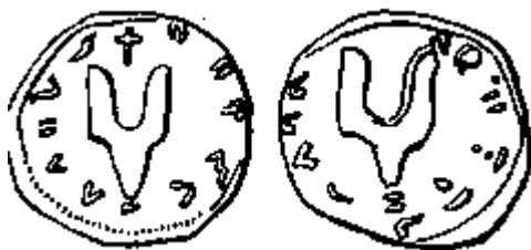
Печать Святослава Игоревича (прорись по В. Л. Янину)

Однако его предшественники выдвинули массу других трактовок "знаков Рюриковичей" – от символа государственной власти, церковно-христианской, светско-воинской эмблемы до геральдическо-нумизматического знака, геометрического орнамента и монограммы. Прообразы искали у скандинавов и скифов, в Византии и в еще не существовавшей тогда Украине (Таубе. 1929. С. 118-119).