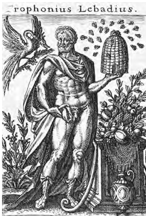
Рис. 12. Трофоний Лебадский. По Бойссарду

Первое, о чем она свидетельствует, так это о глубокой его архаичности и несомненно имеющей связь с протодониийскими корнями, возможно, и связь с культом Аристея. Несомненно одно, что в неких несохранившихся архаических формах преданий о нем, сохранился рассказ о Трофонии-пчеловоде, быть может, даже более древний, нежели рассказ об Аристее, поскольку пчелы Трофония жили не в ульях, а в пещерах, то есть были еще дикими. Пещера стала местом обитания его духа, видимо, в связи с тем, что он провалился в пропасть, так называемую пропасть Агамеда [Paus. IX, 37, 3]. Несомненно Трофоний яв-