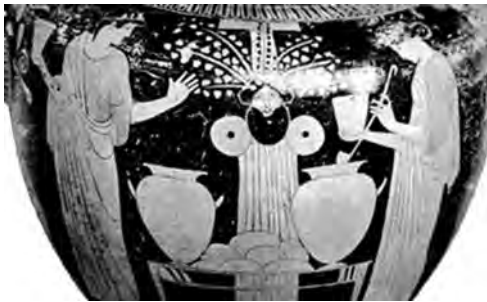
Рис. 2. Ленеи. Стамнос. Музей «Вилла Джулия»

Почти эмблематичным образ Диониса-дендрита сделался в творчестве мастера Виллы Джулия, который создал целый ряд росписей, повторяющих одна другую почти полностью, и различающихся лишь незначительными вариациями жестов женских персонажей. Сам же идол и его постановка с двумя стамносами на жертвенном столике остаются абсолютно неизменными. Мастер получил свое имя по стамносу, хранящемуся в музее «Вилла Джулия» [59, pl. 13–2 III I с.; 45, табл. 6.4] (рис. 2). Эти изображения, в частности приводимый нами пример росписи лондонского стамноса (460–450 гг. до н.э.) [71, Nr. 18 A (London E 451.), s. 8; 42, рис. V–2, с. 139, 131; 45, табл. 7.1, аналогии к нему, но только с изображенными на жертвенном столике хлебами (или медовые соты диких пчел) – три стамноса – 71, Nr. 19 A (Rom, Museo Villa Papa Giulio.), s. 8, Taf. III, Nr. 16 (Boston 418.); 45, табл. 9.6 (рис. 3) и Nr. 17 (Louvre G 408.); полная аналогия из музея Мартина фон Вагнера в Вюрцбурге 66, taf. 22–1 (НА