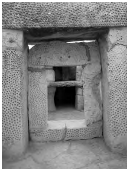
Рис. 6. Портал храма с «ямочным орнаментом». Южная Мнайдра. Мальта.

О богине-пчеле обширный материал собран М. Гимбутас, которая не без оснований утверждает, что Великая Богиня древней Европы часто изображалась в виде насекомого, в частности, в виде пчелы или некоторыми элементами пчелиных признаков, как то: пчелиные глаза, усики и др. [9, см. рис. 7–40, с. 267–269, 271]. Для подтверждения моих мыслей приведу фото из Южной Мнайдры, сделанное летом 2012 г., во время путешествия по Мальте (рис. 6). Один из главных порталов этого храма, как пишет М. Гимбутас, украшен ямочным орнаментом, характерным для мальтийских сакральных памятников, присутствующим на алтарных и порталных