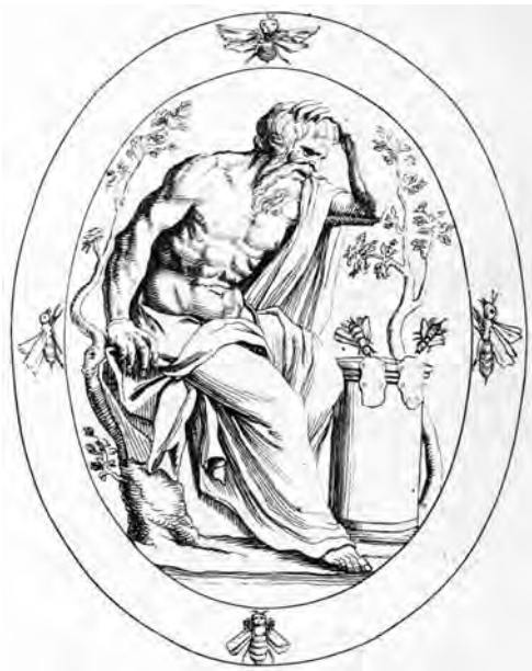
Рис. 11. Прорисовка геммы. Аристей (по Леонардо Августо)

занеси, уничтожь урожай, // Выжги посев, топором на лозы обрушься двуострым...» [Virg.: Georg. IV, 329–331]. В книге Л. Августо, а также у Ф. Крейцера приводится любопытнейшая гемма с изображением старца, вокруг которого множество пчел и улей. Несомненно, что это Аристей [51, tav. 27, s. 45–46; 58, tab. LVI–2; 46, с. 153] (рис. 11).