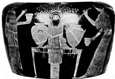
Рис. 3. Ленеи. Стамнос. Музей «Вилла Джулия»