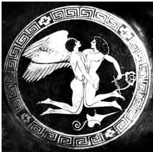
Рис. 10. Эрот и Орфей. Медальон килика. Берлин

медальона килика из Берлина [67, abb. 13 F 2305; 45, табл. 143. 2] (рис. 10). Юношеские тела прижимаются друг к другу в романтической сексуальной игре. Эрот выронил из рук большой бутон лотоса, чтобы обхватить партнера за лядвею, являющуюся с точки зрения античных греков фетишистским местом на теле мальчиков.