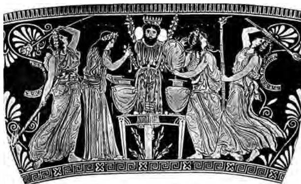
Рис. 8. Дионис-дендрит в росписи стамноса мастера Диноса. V в. до н. э. Неаполь

признаком несколько «светского» характера церемоний. По мнению исследовательницы, эти действия отличались