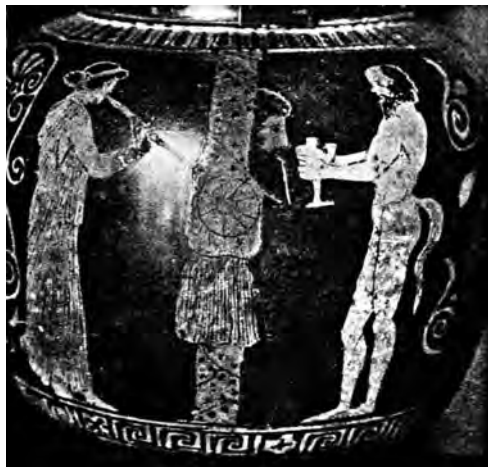
Рис. 1. Праздник Ленеи. Стамнос. V в. до н. э.

нием подобного сюжета. Во время праздника Анастерий, так же как и во время Ленеи, в Афинах маску Диониса призывали к столбу и ее первой напойли новым вином [663, с. 85; 861, с. 130], которое откупоривалось в специальный день – Πιθογία. Существуют соответствующие изображения. Так, на стамносе из Лувра показана сцена поения дионисовой маски сатиром (V в. до н. э.) [71, Nr. 23 (Louvre G 532.), s. 11; 42, рис. IV–1, с. 138, 130; 45, табл. 6. 3] (рис. 1). На одном рельефе римского периода у Лав-