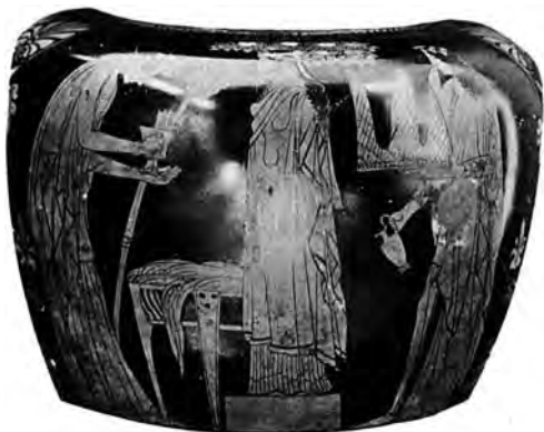
Рис. 7. Праздник Ленеи. Дионисдендрит. Стамнос (London E 452.) (по А. Фрискенхаусу)

Профильное изображение идола в симметричных композициях встречается часто. С.И. Финогенова вслед Дюранду и Ф. Дюкроксу считает, что изображение маски в профиль, а не в фас, является