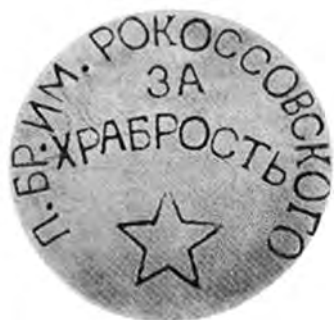
Ил. 4. Самодельная партизанская медаль «За храбрость» партизанской бригады имени Рокоссовского Вилейской области. 1944 г. Белорусский государственный музей Великой Отечественной войны (г. Минск) Оpubл.: http://www.warmuseum.by/index.php/2015-02-03-13-59-04/veshchevye-istochniki/366-faleristika .

Известно, что из-за необходимости оперативного поощрения массового героизма было принято решение на военное время делегировать часть полномочий на места, позволив решать вопросы о награждении командирам различного уровня с последующим утверждением их решений высшим органом власти. Так, в октябре 1942 г. на оперативные центры партизанского движения была возложена функция