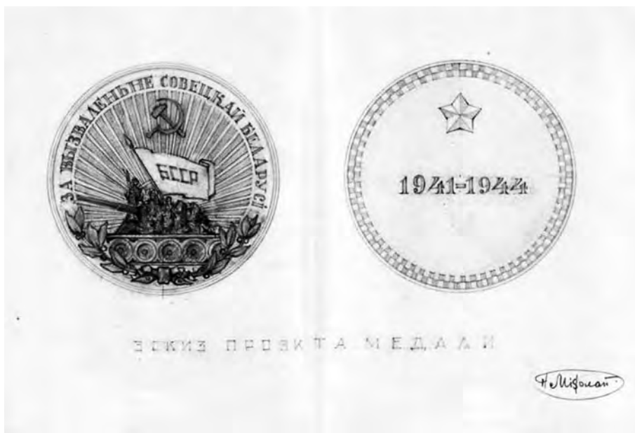
Ил. 2. Проект медали «За вызваленье Советкай Беларусі». Художник Николай Михолап. 1944 г. Оригинал находится в фондах Белорусского государственного музея Великой Отечественной войны (г. Минск). Опувл.: Как могла выглядеть медаль «За освобождение Советской Белоруссии»? // http://news.tut.by/culture/233251.html .

на официальные 5 . Примеры таких наград: медаль «2 года в тылу врага» спецотряда «Боевой» и медали «За храбрость» и «За заслуги» партизанской бригады имени К.К. Рокоссовского Витебской области БССР, изготовленные мастерами-оружейниками из серебряных монет (илл. 1–6) 6 . К тому же, происходившее в некоторых оккупированных областях не соответствовало официальным представлениям об общем патриотическом подъеме советского народа и мобилизации всех сил на отпор врагу, примером чему являлись «Локотская республика», националистические и бандитские (псевдопартизанские) движения. В таких условиях поощрение на высшем уровне организованного сопротивления оккупантам становилось одним из инструментов для побуждения гражданского населения и окруженцев к легализации своего положения.