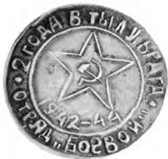
Ил. 3. Самодельная партизанская медаль «2 года в тылу врага» спецотряда «Боевой». 1944 г. Белорусский государственный музей Великой Отечественной войны (г. Минск) Оpubл.: http://www.warmuseum.by/index.php/2015-02-03-13-59-04/veshchevye-istochniki/366-faleristika .

Поскольку народная борьба в тылу врага имела серьезные масштабы (в ней участвовало более 1 миллиона человек) и в целом не являлась стихийной (с лета 1941 г.