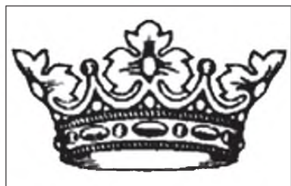
Рис. 2. Дворянская корона в российской геральдике Fig. 2. Noble crown in the Russian heraldry