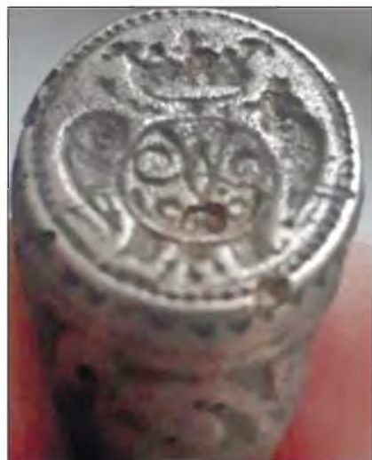
Рис. 5. Перстень с псевдогеральдической печаткой, найденный на территории Алтайского края Fig. 5. A ring with a pseudo-heraldic seal found on the territory of the Altai Territory