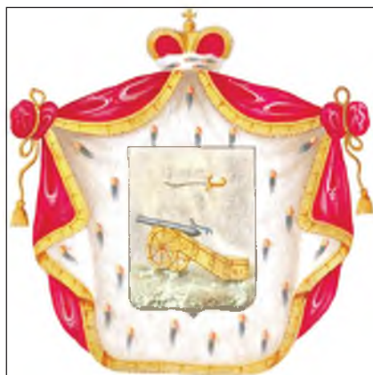
Рис. 4. Герб дворянского рода Еропкиных Fig. 4. Coat of arms of the Eropkins noble family