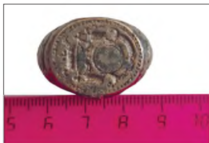
Рис. 1. Перстень с псевдогеральдической печаткой Fig. 1. A pseudo-heraldic ring