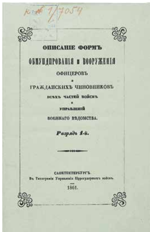
Ил. 9. Обложка ( вверху ) и табл. № 6 «Знаки отличія на каски армейскихъ войскъ с прорезной надписью» ( внизу ) брошюры «Описание формъ обмундирования офицеровъ и гражданскихъ чиновников...». СПб., 1861. Из собрания Главнаго интендантскаго управления. ИИФ 1-7054.

Военно-исторический музей артиллеріи, инженерныхъ войскъ и войскъ связи