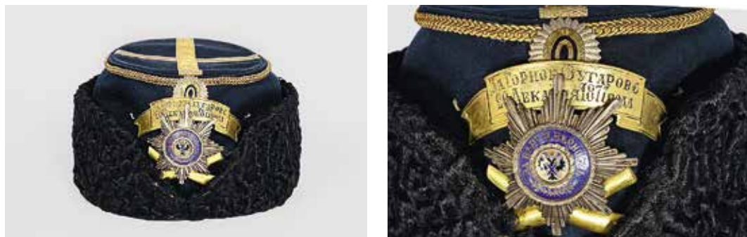
Ил. 14. Шапка парадная генерала Гвардейской Конной артиллерии. Знак отличия «За Горное Бугарово / 20 Декабря 1877 года» образца 1882 г. Латунь позолоченная. 16 × 77 мм. ИИФ 15-2614. Военно-исторический музей артиллерии, инженерных войск и войск связи