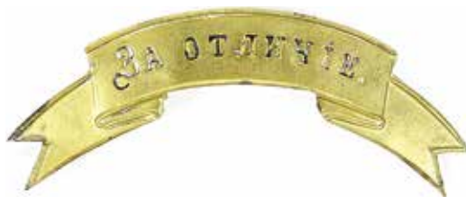
Ил. 12. Знак отличия с надписью «За отличіе» образца 1878 г. Латунь. 1878–1917.

Знак имеет вид ленты с подвернутыми вниз концами, выгнутой по дуге, радиус которой 1 \frac{25}{32} вершка (79,2 мм); концы ленты с каждой стороны вырезаны двумя зубцами; края ленты с зубцами, кругом окаймлены выпуклым кантом, шириною в \frac{1}{32} вершка (1,4 мм); длина знака по прямой линии между концами верхних зубцов 2 \frac{22}{32} вершка (119,6 мм), а нижних 2 \frac{12}{32} вершка (105,7 мм), между углами зубцов 2 \frac{7}{32} вершка (98,7 мм), внизу между краями выгиба ленты \frac{13}{16} вершка (36 мм), длина по середине выгнутой части ленты, с кантом 1 \frac{19}{32} вершка (70,9 мм), ширина ленты, с включением кантов, по середине \frac{14}{32} вершка (19,5 мм), между зубцами \frac{11}{32} вершка (15,3 мм), высота подъема ленты вверх, вследствие выгиба, по краям, как внизу, так и вверху, \frac{5}{32} вершка (7 мм).