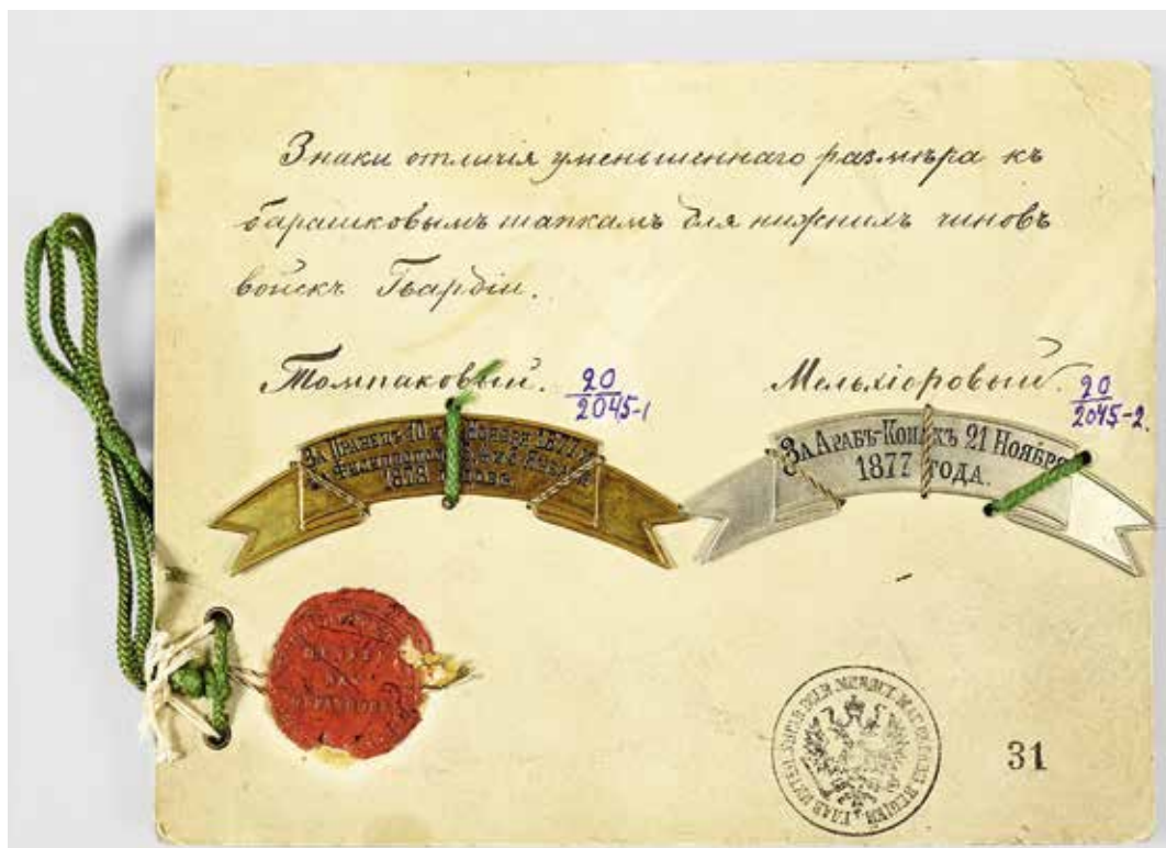
Ил. 15. Знаки отличия образца 1882 г. на барашковые шапки нижних чинов гвардии: «За Пращець 10 и 11 Ноября 1877 и за Филиппополь 3, 4 и 5 Января 1878 годовъ» (слева). Томпак. Ширина ленты 16,5 мм. Длина верхней выгнутой части 61,5 мм. Длина ленты по верхним углам 97,5 мм, длина по нижним углам 89,6 мм; «За Арабъ-Конакъ 21 Ноября 1877 года» (справа). Мельхиор. Ширина ленты 17 мм. Длина верхней выгнутой части ленты 62 мм. Длина ленты по верхним углам на концах 98,2 мм, по нижним 89,5 мм. ИИФ 0-2045/1,2. Военно-исторический музей артиллерии, инженерных войск и войск связи