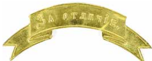
Ил. 11. Знак отличия с надписью «За отличіе» образца 1869 г. Офицерский.

из медной или жестяной пластинки, смотря по металлическому прибору, части войск присвоенному и имеет вид ленты с подвернутыми вниз концами, выгнутой по дуге, радиус которой 1\frac{25}{32} вершка (79,2 мм); концы ленты с каждой стороны вырезаны двумя зубцами; края ленты с зубцами кругом окаймлены выпуклым кантом шириною в \frac{1}{32} вершка (1,4 мм); длина знака по прямой линии между концами верхних зубцов 2\frac{22}{32} вершка (119,6 мм), а нижних – 2\frac{12}{32} вершка (105,7 мм), внизу между краями выгиба ленты \frac{15}{16} вершка (41,7 мм); длина срединной выгнутой части ленты с кантом 1\frac{19}{32} вершка (70,9 мм); ширина ленты с включением кантов по середине \frac{14}{32} вершка (19,5 мм), между зубцами \frac{11}{32} вершка (15,3 мм); высота подъема ленты вверх, вследствие выгиба, по краям