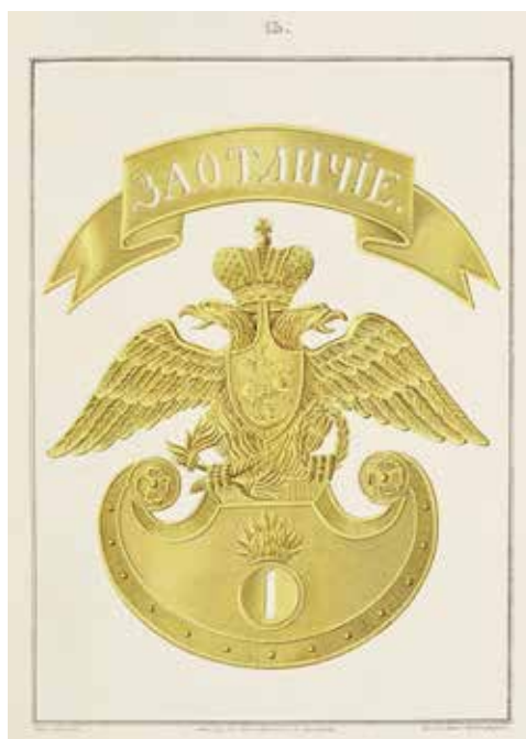
Ил. 8. Киверный герб Гренадерского полка и знак отличия в виде ленты, утвержденный 24 апреля 1828 г. Надпись «ЗА ОТЛИЧІЕ» просечная. Воспроизводится по: Историческое описание одежды и вооружения Российских войск. СПб., 1861. Ч. 19. Табл. 13. ИИФ 18-394.

Военно-исторический музей артиллерии, инженерных войск и войск связи