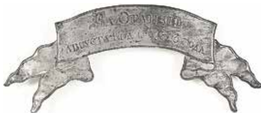
Ил. 4. Знак отличия «За Отличие / Августа 14 дня 1813 года» образца 1813 г. нижнего чина Александрийского или Белорусского гусарского полка. Надпись горельефом (выпуклая). 1813–1828. Белая жемчужина. Ширина ленты 37,5 мм.

Военно-исторический музей артиллерии, инженерных войск и войск связи