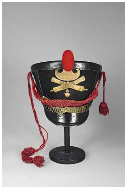
Ил. 2. Кивер нижнего чина пешей артиллерии. Знак отличия образца 1813 г. в форме щита (пельты) с надписью горельефом «ЗА ОТЛИЧІЕ». 1813–1816.

Военно-исторический музей артиллерии, инженерных войск и войск связи