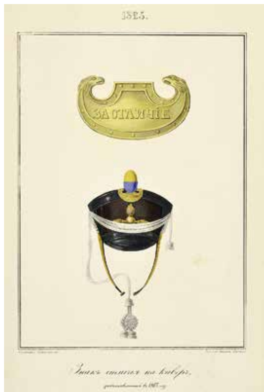
Ил. 1. Знак отличия на кивера, установленный в 1813 г. Составил Сокальский, рисовал на камне Ратье. Воспроизводится по: Историческое описание одежды и вооружения Российских войск. СПб., 1851. Ч. 10. Табл. 1325. ИИФ 18-396.

Военно-исторический музей артиллерии, инженерных войск и войск связи