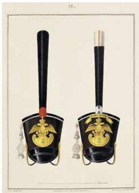
Ил. 7. Кивера, утвержденные 24 апреля 1828 г. Воспроизводится по: Историческое описание одежды и вооружения Российских войск. СПб., 1861. Ч. 19. Табл. 12. ИИФ 18-394.

В 1828 г. был введен новый кивер, на котором помещен герб в виде двуглавого орла со щитом внизу: в гренадерских, пехотных, карабинерных и егерских полках и пешей артиллерии из желтой меди, в саперных и пионерных батальонах, в пехоте Отдельного Литовского корпуса – из белой жести. Получилось так, что форма щитка в нижней части герба на кивере повторяла форму знака отличия, располагавшегося ранее над гербом. Поэтому отказались от знаков отличия в форме щита. Полки, имевшие