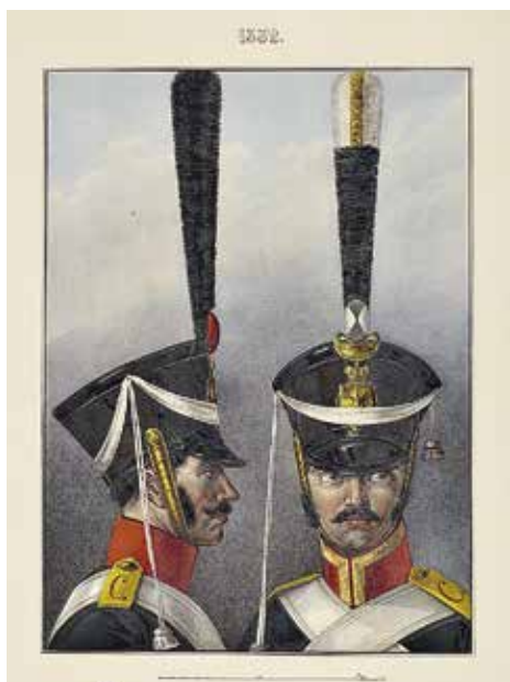
Ил. 5. Гренадер и унтер-офицер Сибирского гренадерского полка. 1817–1824.

16 апреля 1817 г. именной высочайший приказ был объявлен в приказе начальника Главного штаба: «О имении в полках Гренадерских и Карабинерных на киверах блях желтых, а в Драгунских, Конно-Егерских и Гусарских по цвету пуговиц, и о бытии знакам за отличие в конных полках по образцу пехотному»; «Драгунским полкам, получившим знаки отличия, повелено иметь оные по образцу, установленному в пехоте, т. е. в виде щита» 6 . Исключение сделано только для четырех гусарских полков – Ахтырского,