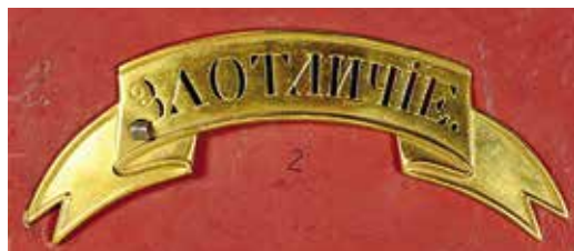
Ил. 3. Знак отличия с надписью «ЗА ОТЛИЧИЕ» образца 1813 г. Офицерский. Медь, позолоченная. В форме ленты, надпись прорезная. 1813–1828. Ширина ленты 29,5 мм. Длина центральной выступающей части 112,2 мм. Длина по верхним углам ленты 173,2 мм, по нижним углам 156,2 мм. 2ИФ 15-3141/2.

В 1813–1817 гг. знаки отличия на головные уборы изготавливали двух видов: прежде всего, в форме щита «пельть» 5 с выпуклой (горельефом) надписью «За отличие», а также в форме ленты. Надпись отличия на ленте, как правило, была прорезной (просечной), но не только. Изучение музейной коллекции позволяет сделать вывод: в указанный период существовали ленты отличия не только с просечной надписью (большинство), но и ленты с надписью выпуклой. Знаки в форме щита были приняты для армейской пехоты и пешей артиллерии, в кавалерии существовали знаки как в форме ленты, так и щита (ил. 1–4).