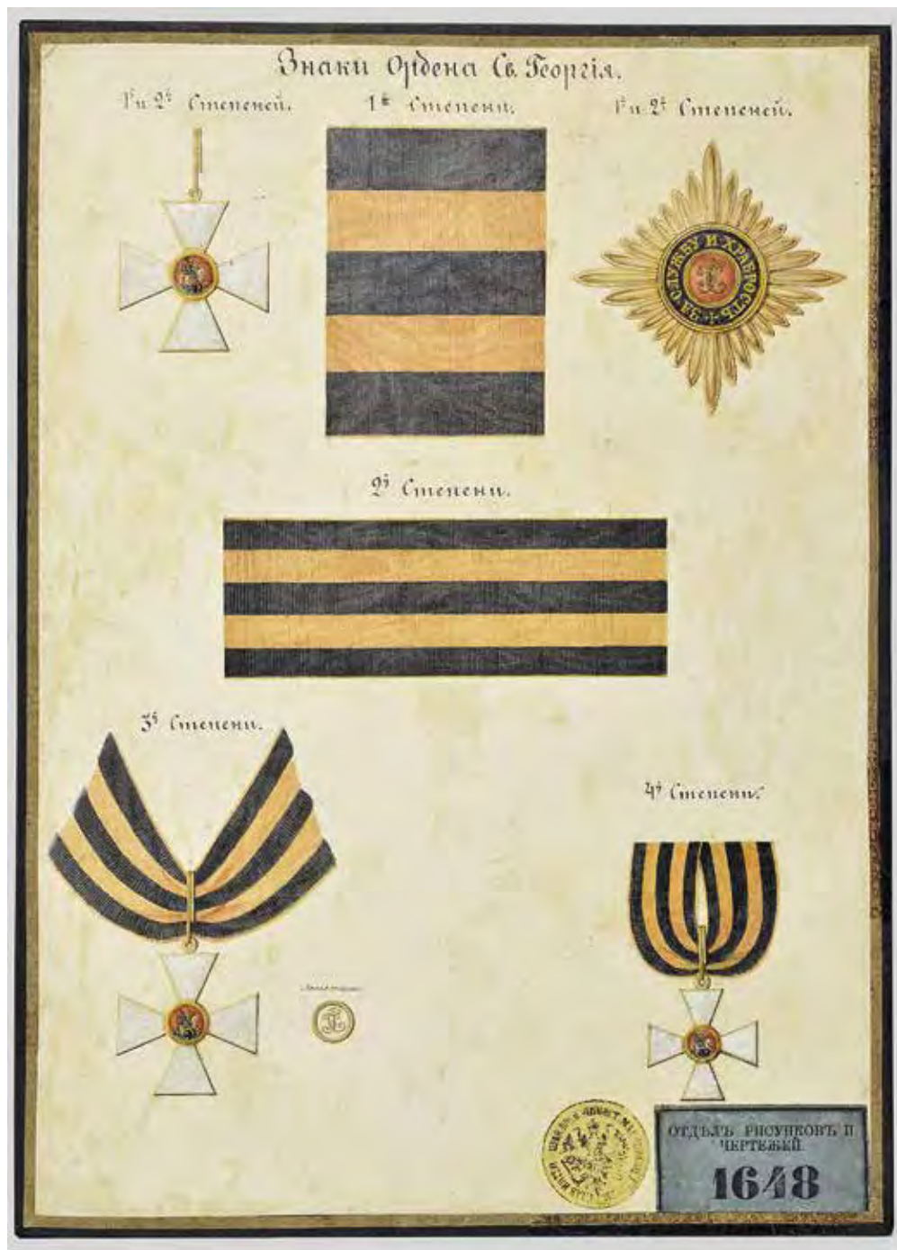
Ил. 23. Образцовая таблица. Знаки ордена Св. Георгия: крест и звезда 1-й и 2-й ст., ленты плечевая 1-й ст., шейная 2-й ст.; кресты 3-й и 4-й ст. Звезда отличается от образцовой звезды работы Кейбеля. Хромолитография с печатью отдела образцов Главного Интендантского управления. Инв. № 20/3032. Военно-исторический музей артиллерии, инженерных войск и войск связи