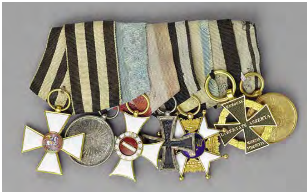
Ил. 7. Колодка с орденами и медалями императора Александра I, 1816–1825: a – знак ордена Св. Георгия 4-й ст. Золото 750-й пробы; б – медаль «В память Отечественной войны 1812 года». Серебро 900-й пробы; в – австрийский Военный орден Марии Терезии. Золото 750-й пробы; г – Прусский Железный крест 2-го класса (крест – серебро 875-й пробы, кольцо и ушко – серебро 800-й пробы); д – шведский Военный орден Меча Рыцарской степени Большого креста 1-го класса. Золото 833-й пробы; е – австрийский Армейский (Пушечный) крест «В память войны 1813–1814 гг.». Золото 583-й пробы; ж – прусская медаль «В память войны 1813–1814 гг.», 27 × 24 мм. Бронза. По гурту надпись: «AUS EROBERTEM GESCHÜTZ» (Из завоеванных орудий). Инв. № 20/2356. Военно-исторический музей артиллерии, инженерных войск и войск связи