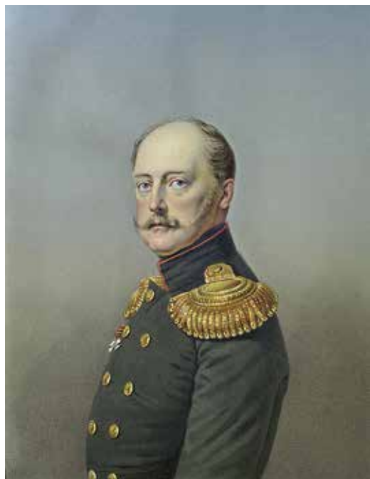
Ил. 17. П. Смирнов с портрета Е. Ботмана. Император Николай I в форме Л.-Гв. Конного полка с орденом Св. Георгия 4-й ст. за 25 лет. Литография, раскрашенная акварелью. Инв. № 18/466. Военно-исторический музей артиллерии, инженерных войск и войск связи