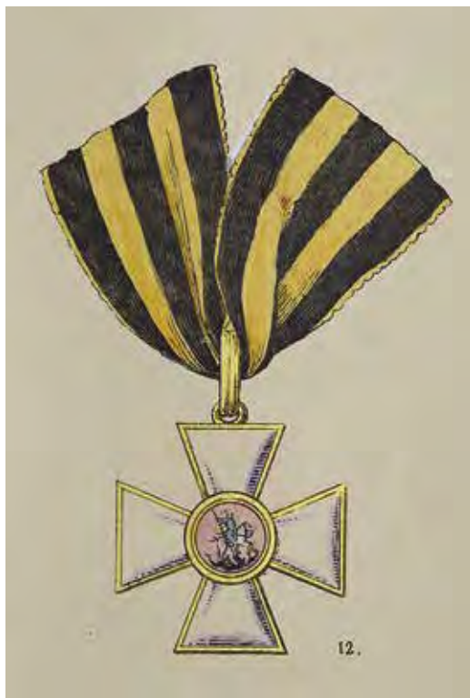
Ил. 15. Крест и лента ордена Св. Георгия 2-й ст. Ил. из: Альбом Гельбке. Берлин, 1833. Инв. № 18/1639. Военно-исторический музей артиллерии, инженерных войск и войск связи.