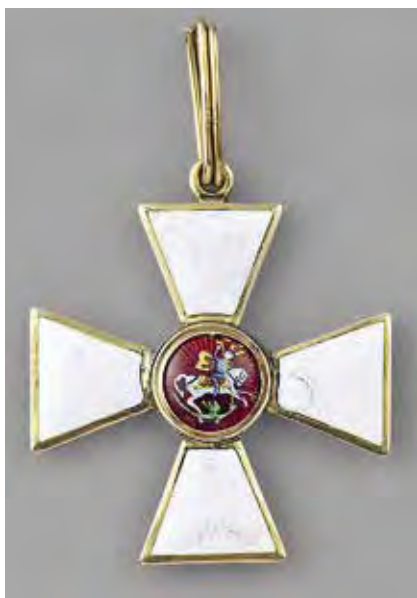
Ил. 9. Орден Св. Георгия 4-й ст. австрийского императора Франца I. Возвращен в 1835 году после смерти императора. Золото 583-й пр. Вес 6,91. Размер 38,1 × 33,9. Инв. № 20/592. Военно-исторический музей артиллерии, инженерных войск и войск связи. Медальон красной эмали по гильошированному лучами от центра фону

Первым рубежом в истории изменения размеров орденских знаков считается 1816 год. Архивные документы говорят о том, что появление новых образцов орденских знаков меньшего размера связано со столицей Франции. Вероятно, повлияла возможность сравнивать награды на груди русских и европейских воинов во время заграничных походов русской армии 1813–1814 годов. Текст указа звучит так: