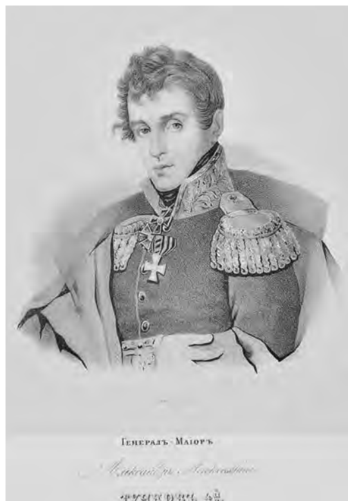
Ил. 3. И. А. Клюквин с портрета Д. Доу. Генерал-майор Александр Алексеевич Тучков (1777–1812), убит 26 августа 1812 при Бородине. Литография. Инв. № 1/7045-57. Военно-исторический музей артиллерии, инженерных войск и войск связи. Ордена Св. Георгия 4-й ст. (1807)