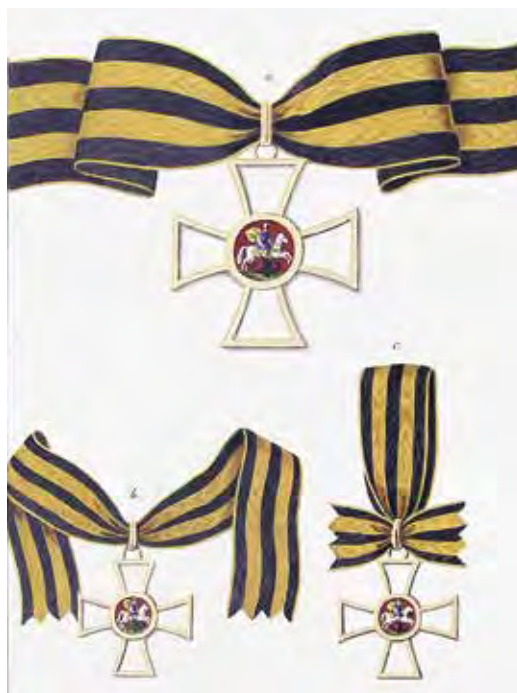
Ил. 13. Знаки ордена Св. Георгия: а – крест и лента 2-го класса; б – 3-го класса; в – 4-го класса. Медальоны красного цвета. Из: Историческое описание одежды и вооружения российских войск / сост. Г. В. Губарев. Табл. 892. Инв. № 18/372. Военно-исторический музей артиллерии, инженерных войск и войск связи

В 1844 году именно с ордена Святого Георгия началось изготовление и награждение особых орденских знаков для нехристиан. Летом 1844 года император Николай I прочел донесение генерала от инфантерии Лидерса о боевых отличиях майора Джамов-Бека Кайтахского и поручика Юсуф-Бека Кюринского, которые отбили три орудия у мятежных горцев во время движения Дагестанского и Самурского отрядов у Цудахару 1 июля 1844 года. Николай I повелел произвести «азиатцев» в следующие чины и наградить орденами Святого Георгия 4-й степени, но при этом немедленно собрать Главную Кавалерственную Думу Военного ордена с тем, чтобы обсудить пожелание императора, которому «благоугодно было на крест поместить не изображение св. Георгия, а Императорский Орел, постановив это общим правилом и на будущее время при назначении мусульманам орденов наших» 12 .