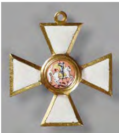
Ил. 8. Орден Св. Георгия 4-й ст. императора Александра I, 1816–1825. Золото 750-й пр. Вес 5,9. Размер 34,0 × 30,1. Инв. № 20/2352. Военно-исторический музей артиллерии, инженерных войск и войск связи. Медальон яркой розовой эмали