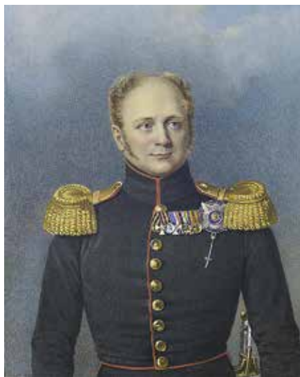
Ил. 6. Портрет императора Александра I. Акварель с портрета Доу. Лист из кн.: Висковатов А. В. Историческое описание одежды и вооружения российских войск. СПб., 1841. Инв. № 18/466-17. Военно-исторический музей артиллерии, инженерных войск и войск связи