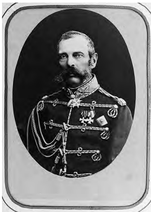
Ил. 20. Император Александр II. На воротнике доломана Л-Гв. Гусарского Его Величества полка фельдмаршальские жезлы (1878), на шее Pour le Mérite (1869, золотая ветвь к ордену 1871), на груди звезда ордена Св. Георгия 1-й ст. (1869) и кресты Св. Георгия 4-й ст. (1850) и Марии Терезии (1875). Обращает на себя внимание небольшой размер звезды. Инв. №18/174. Военно-исторический музей артиллерии, инженерных войск и войск связи

б) На черном ободке звезды Капитула надпись «За службу и храбрость» соединяется вверх Императорской короной