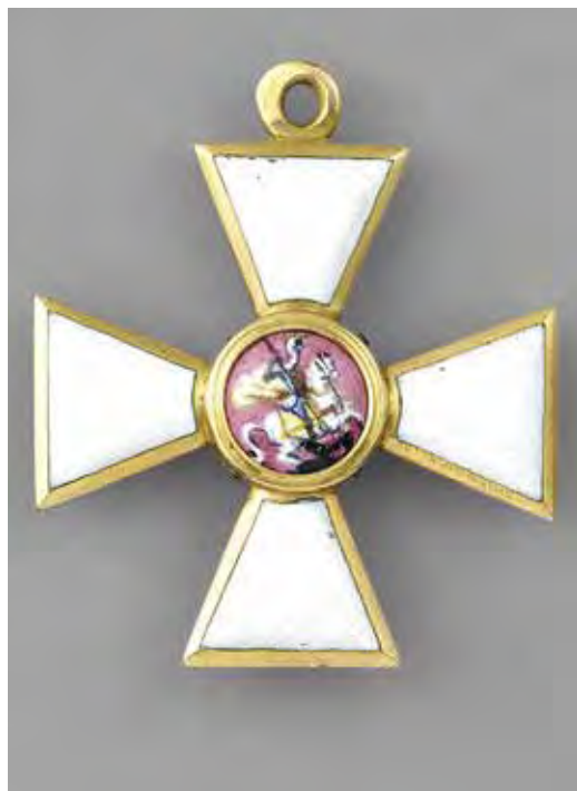
Ил. 25. Крест ордена Св. Георгия 4-й ст. великого князя Николая Николаевича-младшего, награжденного за отличие при форсировании Дуная в 1877 году. Золото 750-й пр. Вес 6,38. Размер 35,0 × 30,1. 1840-е – 1857. Инв. № 20/3383. Военно-исторический музей артиллерии, инженерных войск и войск связи

1877 – окончательное установление размеров и цвета медальона знаков.