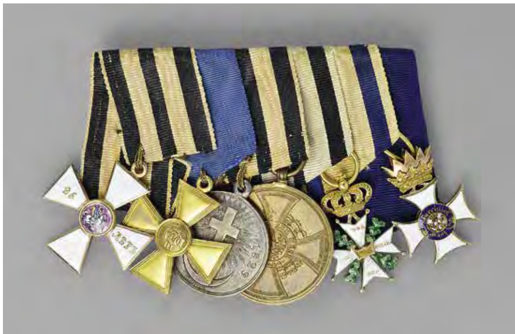
Ил. 18. Колодка с орденами и медалями императора Николая I. 1851–1855: a – орден Святого Георгия 4-й ст. за 25 лет службы. Поднесен императору в 1840 году. Золото 583-й пробы. Поле медальона розово-сиреневого цвета. Рисунок прописан, но не так детально, как в колодке старшего брата; б – крест «За 25 лет беспорочной службы в офицерских чинах». Королевство Пруссия. Золото 583-й пробы; в – медаль «За Турецкую войну» (1828–1829). Серебро 925-й пробы; г – медаль королевского дома Гогенцоллернов за участие в боях 1848–1849 годов. (Hohenzollern Campaign Medal 1848–1849). Королевство Пруссия. Бронза; д – военный орден Вильгельма. Нидерландское королевство. Николай Павлович награжден орденом 11 мая 1817 года. Золото 583-й пробы; е – орден Военных заслуг. Вюртемберг. Золото 583-й пробы. Поступила в 1855 году. Инв. № 20/685. Военно-исторический музей артиллерии, инженерных войск и войск связи

Условия Капитула для изготовления: ордена из золота 72-й пробы, звезды – из серебра 84-й пробы, по образцам с соблюдением норм веса драгоценного металла, чистоты отделки и прочности. На практике по данным проверок пробирной палатки кресты в то время изготавливали из золота 72-й, 74-й и 73-й пробы.