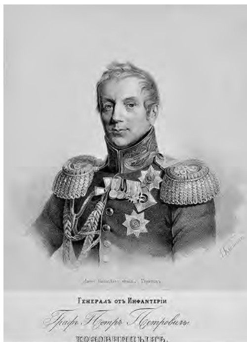
Ил. 2. И. А. Кляуквин с портрета Д. Доу. Генерал от инфантерии граф Петр Петрович Коновницын (1764–1822). Награжден орденами Св. Георгия 4-й (1794), 3-й (1808) и 2-й (1812) ст. Литография. Инв. № 1/876. Военно-исторический музей артиллерии, инженерных войск и войск связи. Размер креста ордена на портрете больше звезды