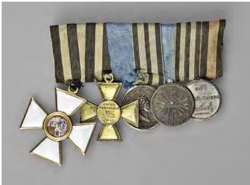
Ил. 10. Колодка с наградами героя Отечественной войны 1812 года генерал-лейтенанта (1831) Дениса Васильевича Давыдова (1784–1839): a – орден Св. Георгия 4-й ст. (1812); b – крест «За победу при Прейсшп-Эйлау» (1807); в – медаль «За взятие Парижа 19 марта 1814 г.» (1814); г – медаль «В память Отечественной войны 1812 г.» (1813); д – медаль «За Персидскую войну» (1828). Инв. № 20/4210. Военно-исторический музей артиллерии, инженерных войск и войск связи

Далее идет подробное перечисление чинов и фамилий с отметкой, какие ордена и кому были отправлены, с указанием был ли орден старого образца или нового.