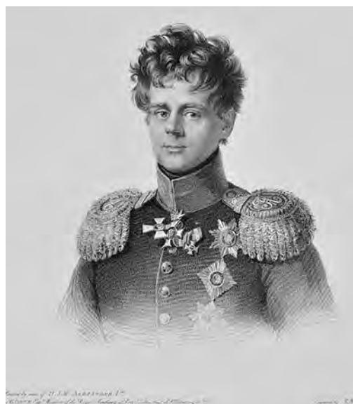
Ил. 5. Т. Райт с портрета Д. Доу. Герцог Вюртембергский Евгений-Фридрих-Карл-Павел-Людвиг (1788–1857). Гравюра. Инв. № 18/643-12. Военно-исторический музей артиллерии, инженерных войск и войск связи. Ордена Св. Георгия 4-й (1801), 3-й (1812), 2-й (1813) ст. Рисовано по указу императора Александра I