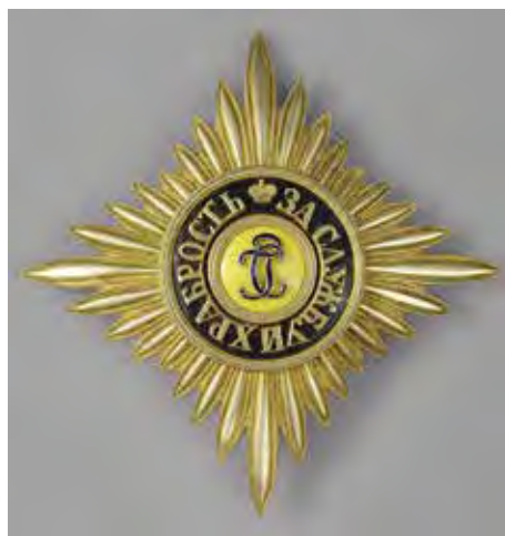
Ил. 22. Звезда ордена Св. Георгия 1-й и 2-й ст.

Собрание великого князя Михаила Николаевича. Инв. № 20/3306. Военно-исторический музей артиллерии, инженерных войск и войск связи