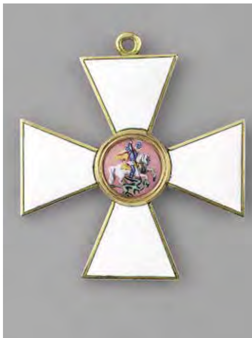
Ил. 19. Крест ордена Св. Георгия 2-й ст. Золото 583-й пробы. Вес 23,55. Размер 53,5 × 48,1. Самуил Арндт. После 1855. Собрание великого князя Михаила Николаевича. Инв. № 20/3309. Военно-исторический музей артиллерии, инженерных войск и войск связи. Медальон розовой эмали по гильошированному лучами от центра фону

В 1857 году в связи с переходом к новым пробам золота при изготовлении орденских знаков были скорректированы и весовые нормы. По контрактам, заключенным с поставщиком орденских знаков золотых дел мастером Иоганном Вильгельмом Кейбелем,