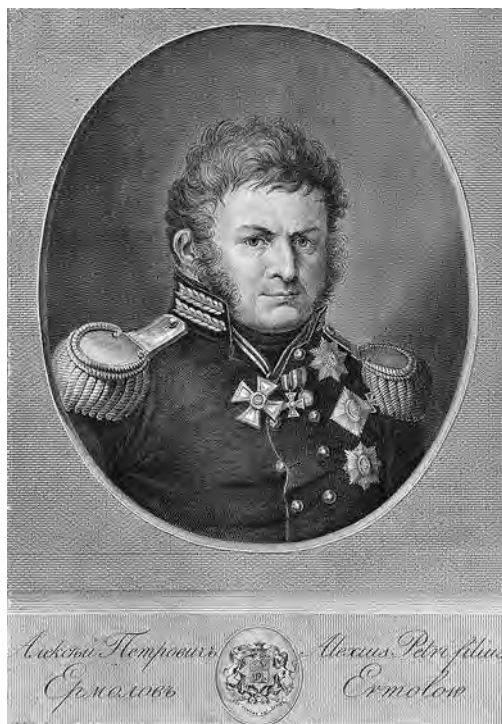
Ил. 4. А. Г. Ухтомский с оригинала В. И. Машкова. Генерал от инфантерии Алексей Петрович Ермолов (1772–1861). Гравюра. Инв. № 1/6961. Военно-исторический музей артиллерии, инженерных войск и войск связи. Ордена Св. Георгия 4-й (1794), 3-й (1807), 2-й (1814) ст. Размер креста ордена на портрете больше звезды