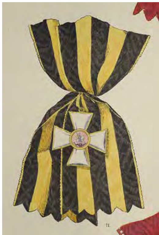
Ил. 14. Крест и лента ордена Св. Георгия 1-й ст. Ил. из: Альбом Гельбке. Берлин, 1833. Инв. № 18/1639. Военно-исторический музей артиллерии, инженерных войск и войск связи. Медальон розового цвета