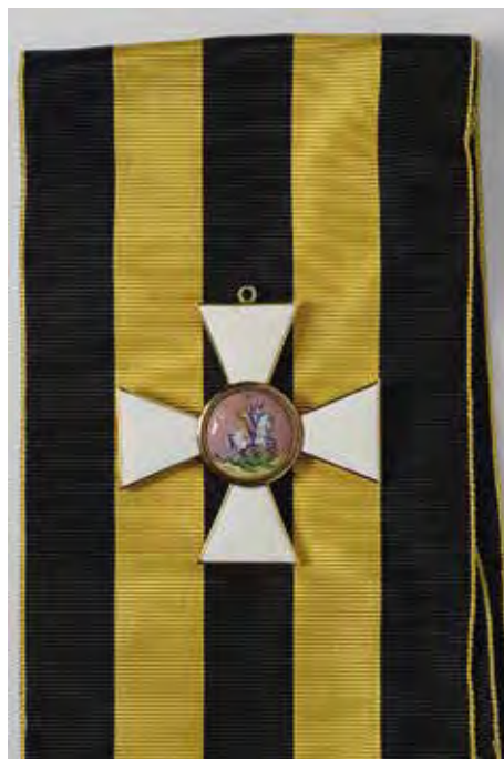
Ил. 21. Крест ордена Св. Георгия 1-й ст. Золото 583-й пр. Вес 32,4. Размер 58,5 × 58,5.

1855–1857 – переход к изготовлению кованых звезд, к 56-й пробе золота взамен 72-й, увеличение размеров крестов 3-й степени.