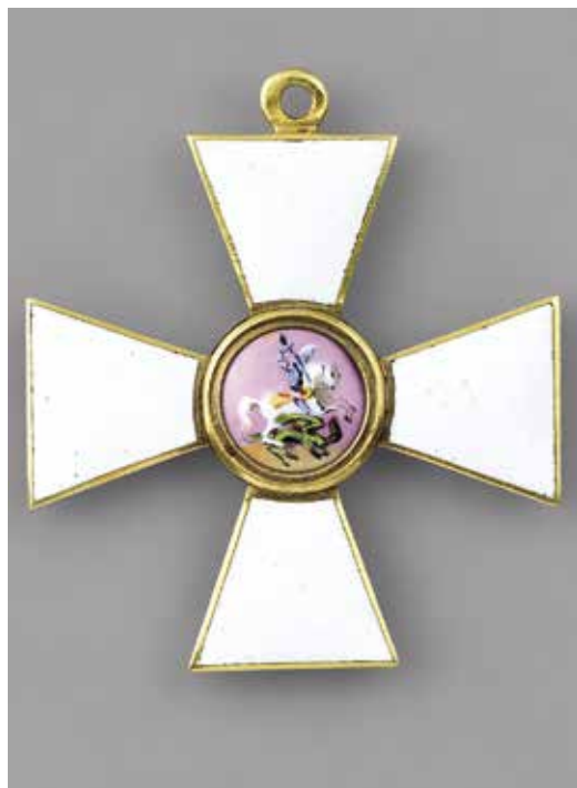
Ил. 24. Крест ордена Св. Георгия 4-й ст. великого князя Николая Николаевича-старшего, награжденного за отличие в сражении при Инкермане в 1854 году. Золото 750-й пр. Вес 6,98. Размер 38,0 × 33,5. 1840-е. Инв. № 20/3382. Военно-исторический музей артиллерии, инженерных войск и войск связи