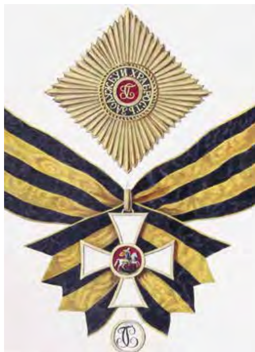
Ил. 12. Знаки ордена Св. Георгия: звезда 1-го и 2-го классов. Из: Историческое описание одежды и вооружения российских войск / сост. Ф. Г. Солнцев. Табл. 891. Инв. № 18/372. Военно-исторический музей артиллерии, инженерных войск и войск связи. Звезда без изображения короны, слова девиза расположены снизу влево вверх. Крест и лента 1-го класса. Медальон красного цвета