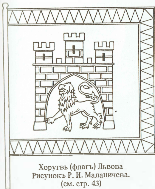
Хоругвь (флагъ) Львова Рисунокъ Р. И. Маланичева. (см. стр. 43)