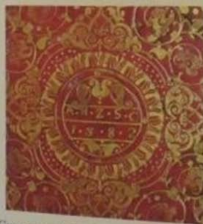
9.8. Суперэклибрис на нижней крышке переплёта, без рамки, 85 \times 85 , размер круга 33, золотое тиснение на красной коже, буквенный, с изображением в центре орнамента круга с инициалами и датой: «A H Z S C | 1582».