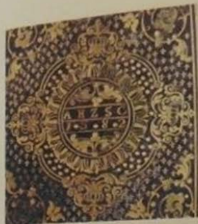
9.7. Суперэклибрис на нижней крышке переплёта, без рамки, 90 \times 90 , размер круга 32, золотое тиснение на тёмно-зелёной коже, буквенный, с изображением в центре орнамента круга с инициалами и датой: «A H Z S C | 1582».