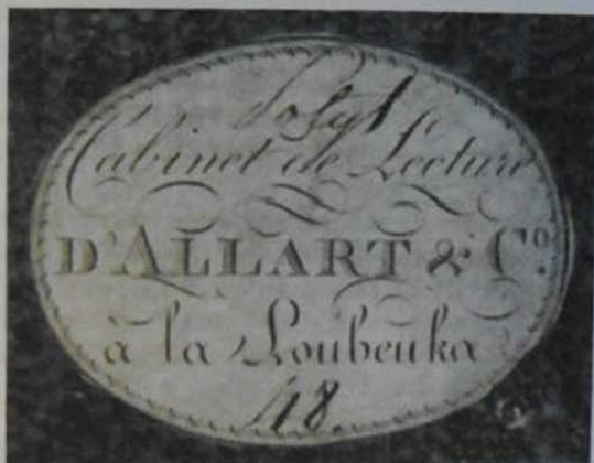
53.3. Бумажный ярлык (наклеен на верхнюю крышку переплёта), овальный (обрезан по контуру рамки), 36 × 49, литография, одноцветный, шрифтовой, с надписью в линейной и декоративной рамках: «Cabinet de Lecture| D' ALLART & C o .| à la Loubeuka.» Около 1806–1812 гг.