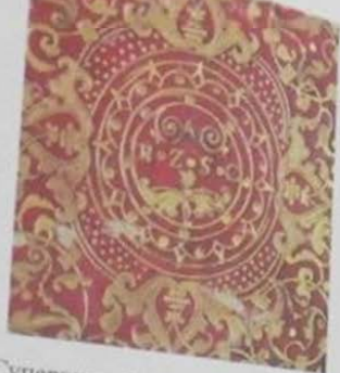
9.5. Суперэклибрис на нижней крышке переплёта, без рамки, 80 \times 78 , размер круга 26, золотое тиснение на красной коже, буквенный, с изображением в центре орнамента круга с инициалами «A|H-Z-S-C».