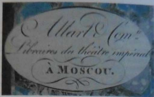
53.2. Бумажный ярлык, овальный (обрезан по контуру рамки), 38 × 64, литография, одноцветный, шрифтовой, с надписью в линейной рамке: «Allart & Com te ,| Libraires du théâtre impérial| À MOSCOU.» Около 1806–1812 гг.