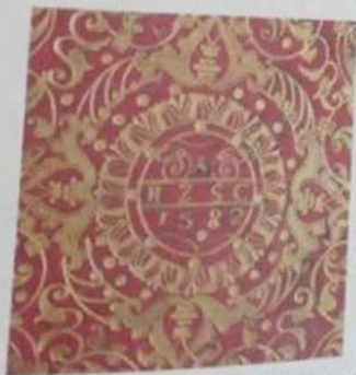
9.6. Суперэклибрис на нижней крышке переплёта, без рамки, 78 \times 78 , размер круга 26, золотое тиснение на красной коже, буквенный, с изображением в центре орнамента круга с инициалами и датой: «A H Z S C | 1582».