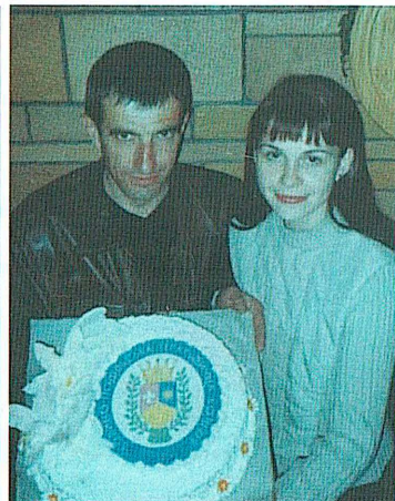
Заседание Волыно-Подольской Геральдической Коллегии, г. Хмельницкий, кафе "Византия", 25 апреля 2004 г.