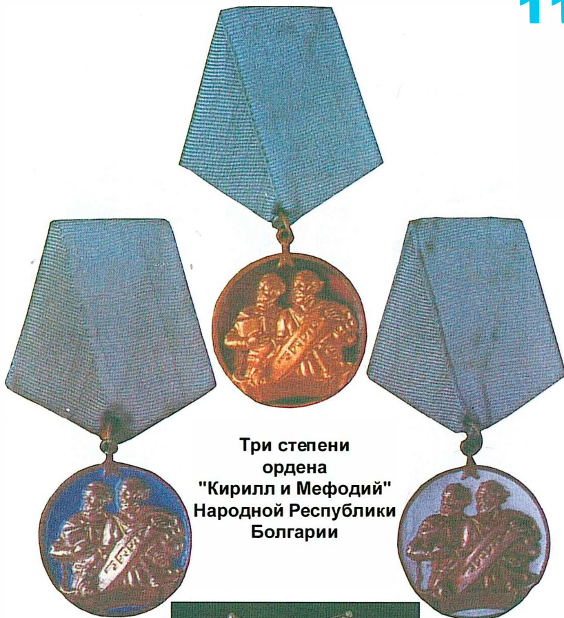
Три степени ордена "Кирилл и Мефодий" Народной Республики Болгарии