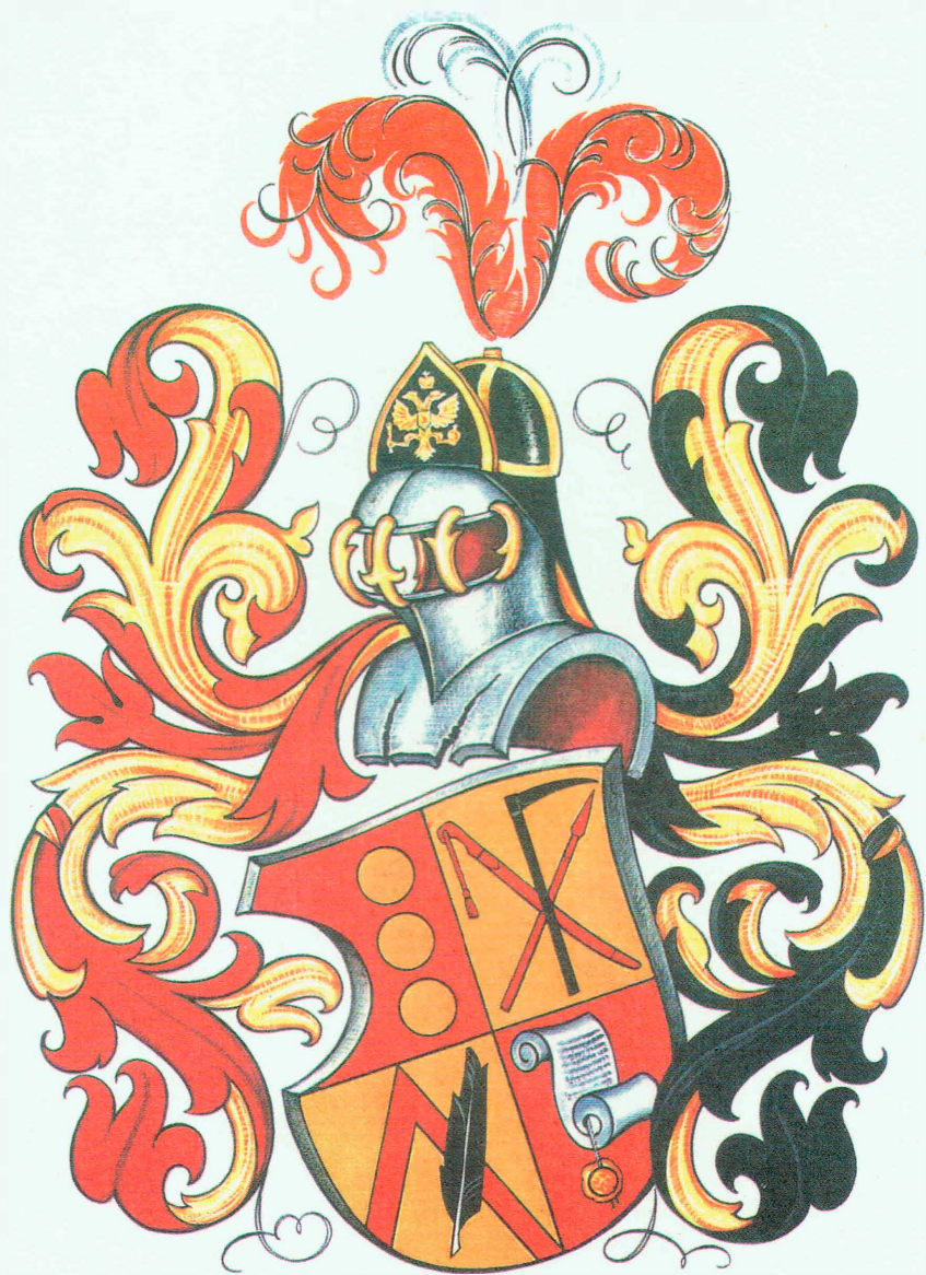
Личный герб И.В. Борисова (Гербовый Матрикул, № 138). Художник Р.И. Маланичев.