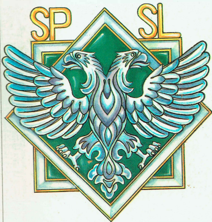
Фрачный знак Ордена Орла