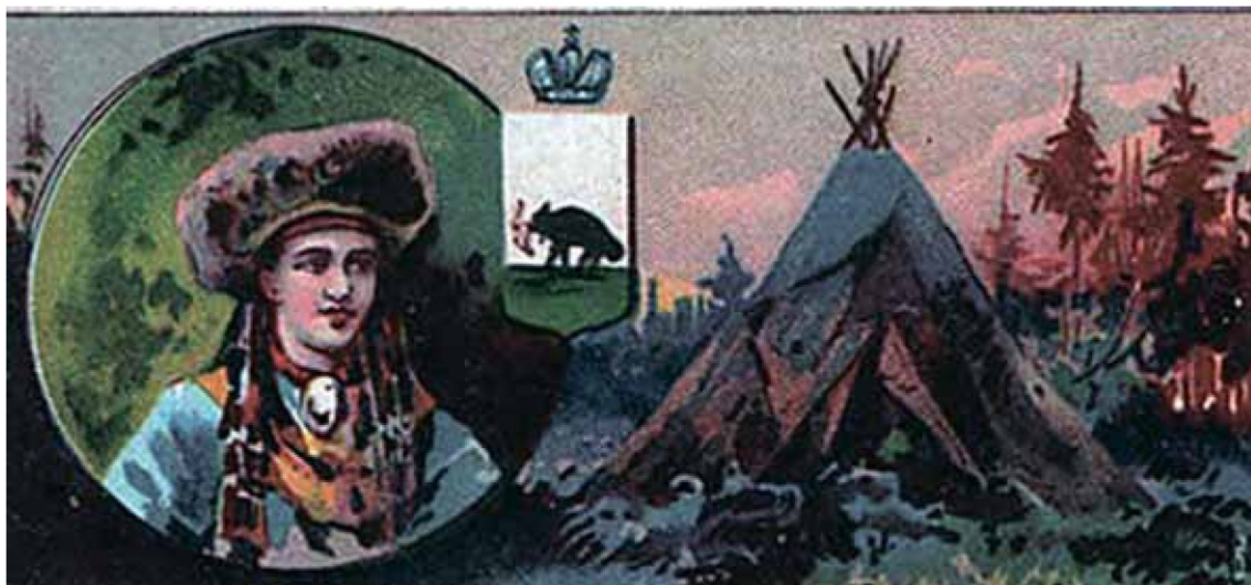
Рисунок 57 – Неизвестный рисунок на старой открытке с Иркутским гербом (из Интернета)

серебряном поле, в коем изображен бегущий по зеленой траве, в левую сторону бобр, держащий во рту соболя» , но и приводит рисунок этого бобра, практически взятого с губернских пуговиц. И это через семнадцать лет после утверждения Екатериной II Иркутского