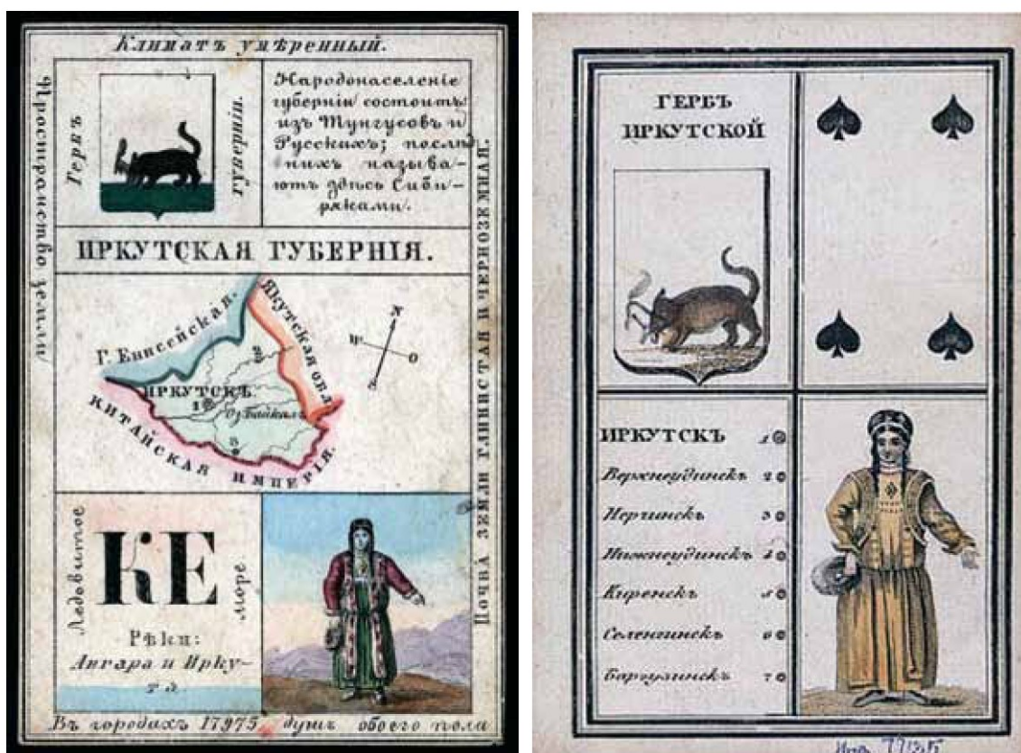
Рисунок 55 – Фотокопии познавательных карт с изображением Иркутского герба. Слева — из сувенирного набора. Справа — еще и с игровым уклоном

И если адрес прописки оригинала рисунка 57 автору данной статьи пока неизвестен, то рисунок 55 относится к сувенирному набору К.М. Грибанова (состоящего из 80 двухсторонних иллюстрированных открыток), по одной на каждую провинцию Российской Империи в том виде, как она существовала в 1856 году. На каждой открытке представлен обзор культуры, истории, экономики и географии местности. На лицевой стороне открытки описаны главные отличительные особенности местности: реки, горы, крупные города и ключевые отрасли промышленности. На оборотной стороне