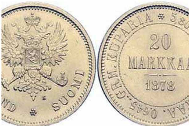
Рисунок 4 – Фотокопии серебряной (1863 год) и золотой (1878 год) марки Российской Финляндии