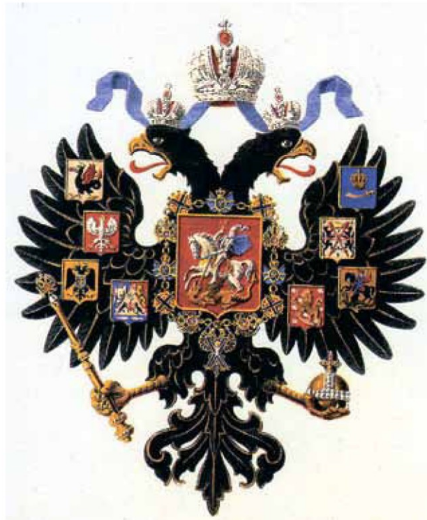
Рисунок 3 – Малый герб России 1857 года

Он был автором рисунков финских марок, которые начали выпускать согласно Манифесту от 23 марта 1860 года «Об изменении монетной единицы для Великого княжества Финляндского» 19 . В Германии