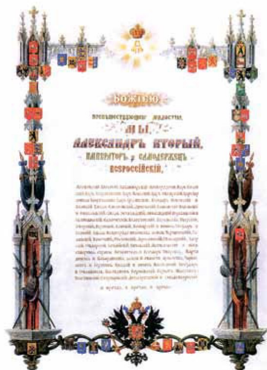
Рисунок 2 – Заглавный лист с титулом императора и лист с гербом князя М. Воронцова