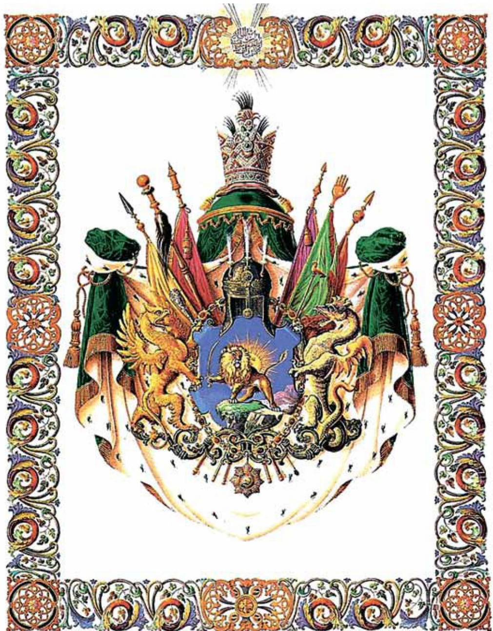
Рисунок 6 – Полный герб Насреддин-шаха Персидского, 1865 год