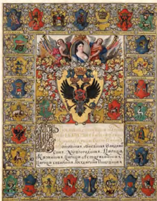
Рис. 3а. Жалованная грамота Екатерины I Демидовым, 1726 г.