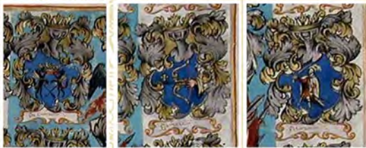
Рис. 2г. Некоторые титульные гербы на жалованной грамоте Петра I гетману И.И. Скоропадскому на вочины в Батуринском, Нежинском, Стародубском и Черниговском полках, 1718 г.