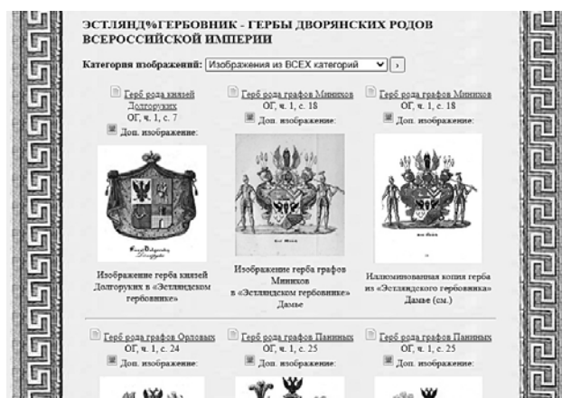
На рис.: пример результата поиска изображений (по запросу « Эстлянд%гербовник », по состоянию на 01.12.2022).

чаев используется формулировка «в «Эстляндском гербовнике», в других случаях «из «Эстляндского гербовника», есть варианты с кавычками и без. Чтобы одним запросом отобрать все изображения из «Эстляндского гербовника», достаточно выполнить по изображениям поисковый запрос « Эстлянд%гербовник ». В данном примере подстановочный символ «%» указан сразу после корня слова «Эстлянд», дабы исключить любые морфологические вариации. Словоформы слова «гербовник» покрываются тем, что после поисковой строки справа могут быть любые иные символы (и в любом количестве).