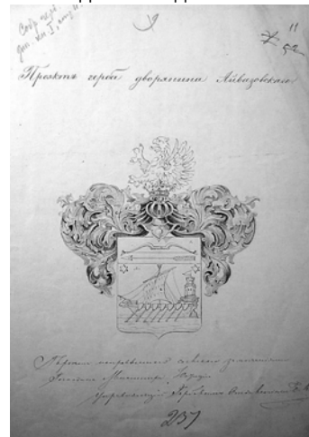
Лист с рисунком проекта герба, подготовленным в Герольдии

8. Дополнительные изображения. В этой секции, как явствует из названия, размещаются самые разнообразные изображения герба, не подпадающие под категорию «статусных» (см. выше).