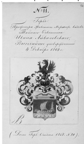
Страница с рисунком герба в Дипломном сборнике

На рис. – разные «статусные» изображения для одного и того же герба (на примере герба Айвазовских, ДС 1-11) 3 :