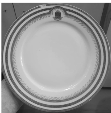
1. Фото тарелки с изображением герба, представленной для атрибуции на Форуме Геральдики.ру 29.06.2022 г. *

На рис. – пример реального определения герба с использованием поиска на «Гербовнике.ру»: