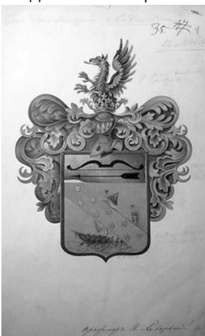
Лист с рисунком самобытного герба в прошении