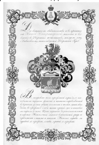
Страница с рисунком герба в подлиннике диплома