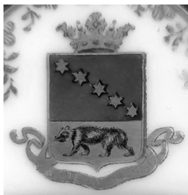
2. Макрофотография самого герба на тарелке.