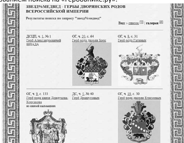
3. Скриншот страницы результатов поиска по блазонам по запросу «звезд%медвед» в режиме просмотра галереи изображений – нужный герб шестой в результатах поиска, это герб Елисеевых (ОГ 19-30).