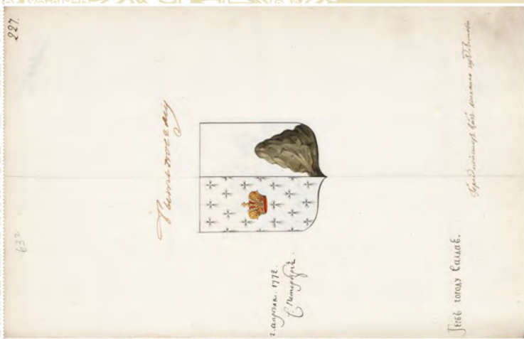
Герб города Волдан, 1772 г. (л. 227)