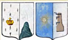
Рисунки гербов Осташкова и Вышнего Волочка в Гербовнике Тальзына (около 1790 г.)

Рисунки гербов Валдая и Боровичей в Гербовнике Тальзына (около 1790 г.):