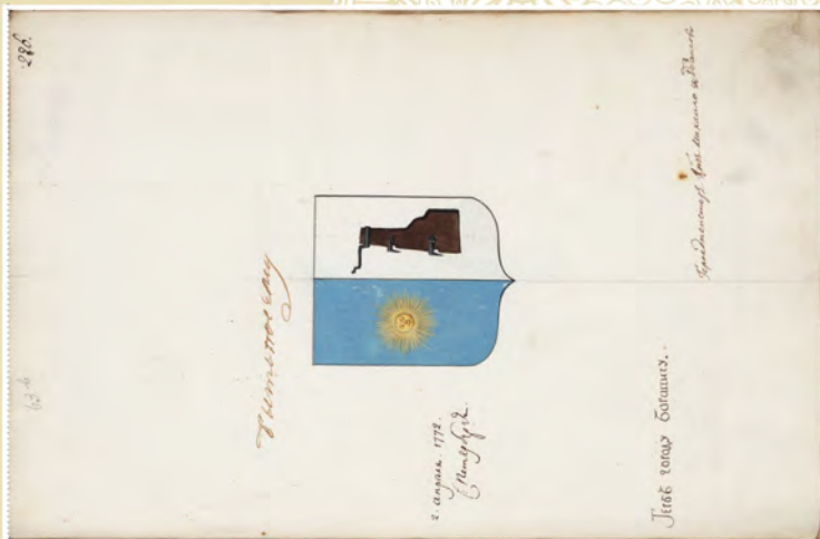
Герб города Боровичи, 1772 г. (Л. 226)