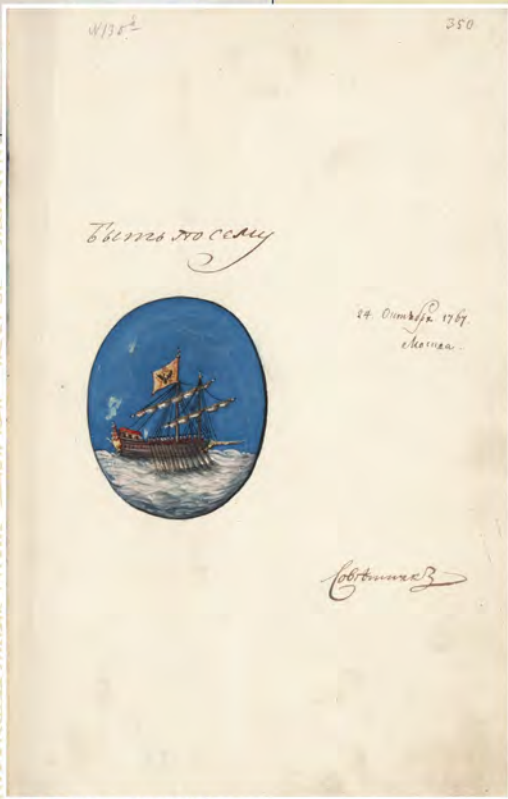
Герб города Костромы, 1767 г. (РГИА. Ф. 1329. Оп. 1. Д. 123. Л. 350)