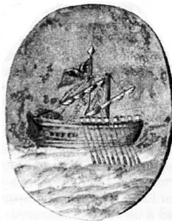
Рис. 1: изображение герба города Костромы в журнале Зузина, репродукция 1837 г.

мого картуша. Впоследствии, во всех прочих гербовниках, в т.ч. в Гербовнике Талызина и в ПСЗ, герб Костромы изображался уже в типовом «французском» щите, повсеместно используемом в гербах в России до сих пор. Но известно черно-белое изображение герба Костромы, выполненное тоже в овальном щите и приведенное в журнале Зузина А.Р., посвященном путешествию Екатерины II по Волге 10 (в репродукции 1837 года, см. рис. 1).