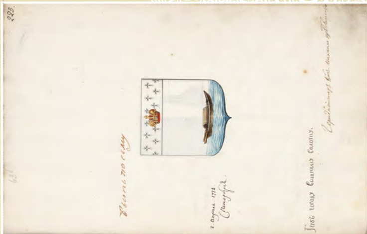
Герб города Вышнего Волочка, 1772 г. (Л. 225)