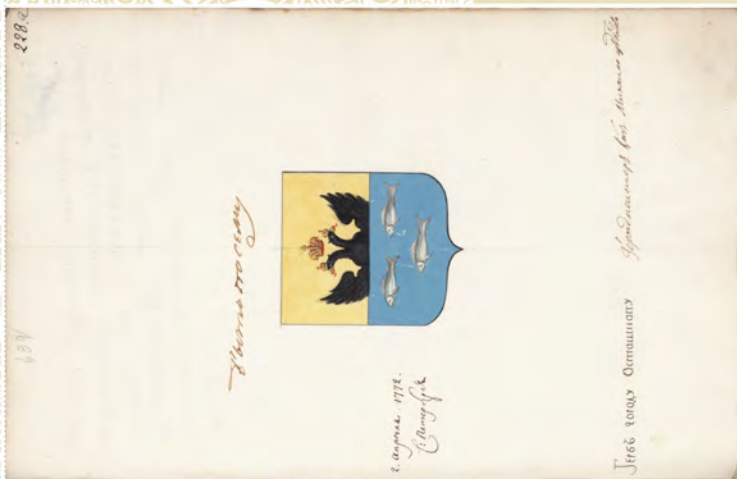
Герб города Осташкова, 1772 г. (л. 228)