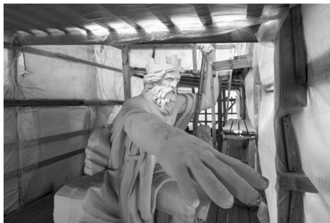
Рис.: Скульптура Нептуна на фронтоне здания Биржи в ходе ремонтных работ

Открытие Музея геральдики в здании Биржи в Петербурге снова отложено. На встрече с журналистами из разных СМИ 15 февраля гос. герольд-мейстер РФ Г.В. Вилинбахов сообщил об очередном переносе срока открытия Музея геральдики: «Мы сталкиваемся с проблемами, с которыми сталкиваются практически все, кто имеет дело со строительными организациями. Мы очень рассчитывали, мечтали, что получим здание, чтобы сделать там экспозицию, музей геральдики уже в этом году [т.е. в 2022 г. – прим. редакции]. Но, к сожалению, из-за этих строительных проблем в этом году не получается». Он также пояснил, что реставрация здания Биржи оказалась сложнее, чем ожидалось, так как оно долгие годы не видело капитального ремонта, сразу возникли проблемы с фундаментом, который требовалось укрепить, чтобы сохранить сооружение.