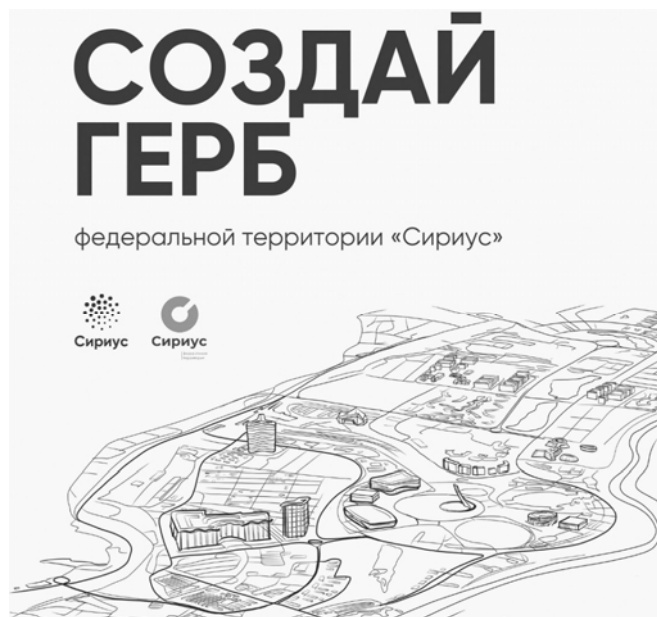
Рис.: Пример промо-баннера из информационных сообщений региональных образовательных центров, работающих по модели «Сириуса», о проведении конкурса (март 2022 г.)

НПА: постановление Совета федеральной территории от 18.02.2022 № 1-9/53П. Срок приема проектов: до 18.04.2022.