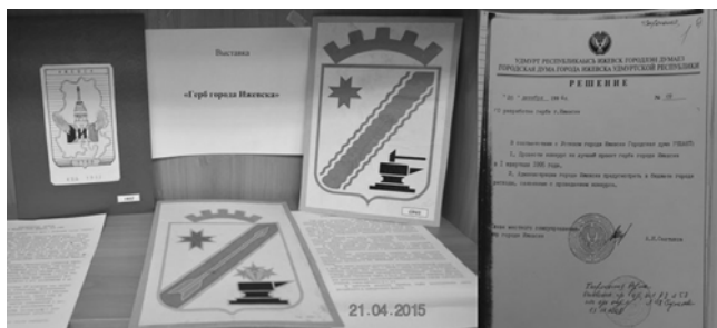
Фотографии с проектами герба Ижевска по конкурсу 1994 г. на выставке (по материалам веб-сайта администрации города)

Выставка организована в читальном зале архивного отдела Управления по делам архивов Администрации города Ижевска и приурочена ко Дню местного самоуправления (отмечается 21 апреля). Представлены документы о разработке герба города Ижевска (эскизы, описания герба, сведения о разработчиках и другие экспонаты).