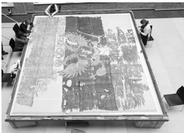
Рис.: Процесс подготовки к экспонированию корабельного флага 1693 г. (фото с сайта ЦВВМ, от 26.05.2022)

Посетители ЦВВМ получили редчайшую возможность вживую увидеть флажную реликвию 1693 года. В Центральном военно-морском музее (ЦВВМ) в Петербурге 8 июня, ко дню 350-летия со дня рождения Петра I, имя которого носит музей, открылась выставка уникального экспоната – первого русского корабельного штандарта, прообраза современных государственных символов России, который был поднят Петром I на яхте «Святой Петр» в 1693 г. Этот уникальный экспонат является одной из главных государственных реликвий и старейшим из сохранившихся российских триколов. Еще 26 мая, по сообщению на сайте музея, у посетителей была также возможность наблюдать процесс подготовки флага к экспонированию.