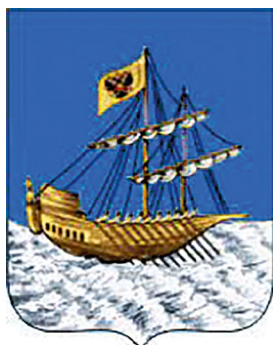
Герб Костромы, дарованный Екатериной II в 1767 году.

Исторический герб Костромы утвержден был 24 октября 1767 года. «Как Ее императорское вели-