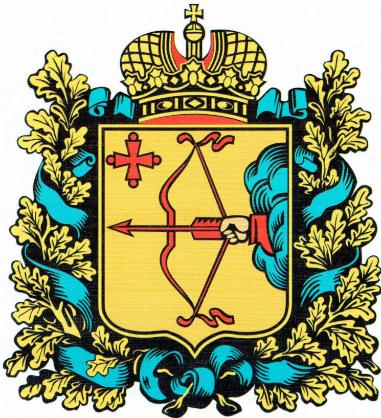
Герб Вятской губернии. Высочайше утверждён 8 декабря 1856 г.