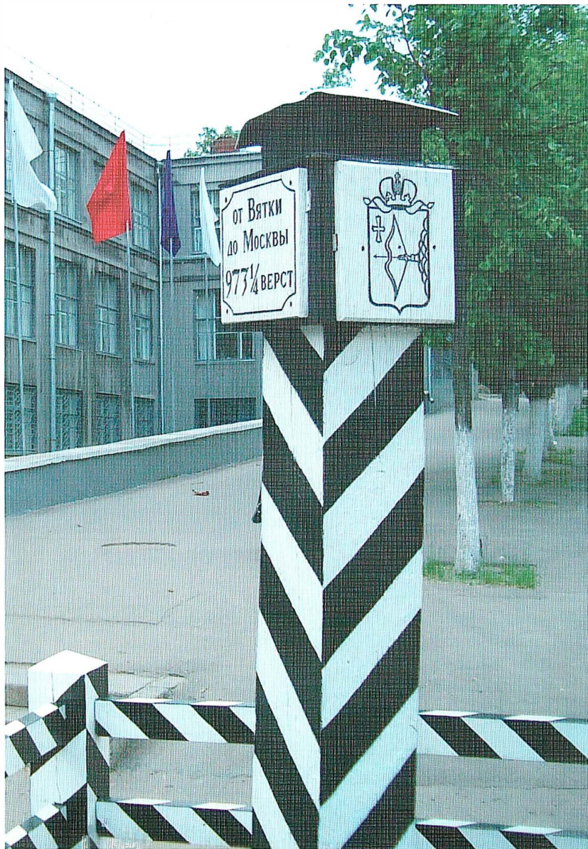
Верстовой столб у Кировского главпочтамта.