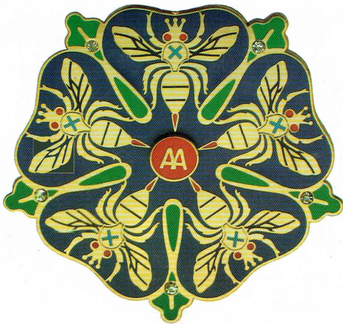
Знак Ордена Золотой Пчелы (без колодки, масштаб 1,5 : 1)