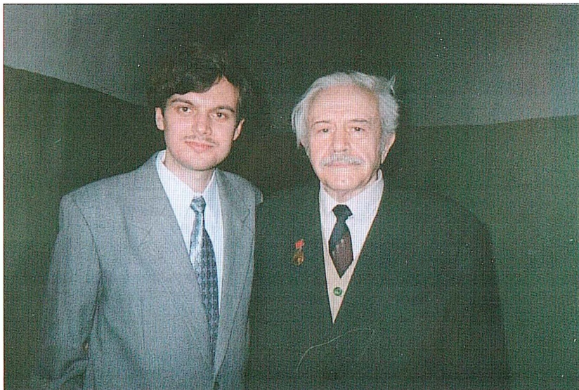
С известным военным историком А.Г. Кавтарадзе