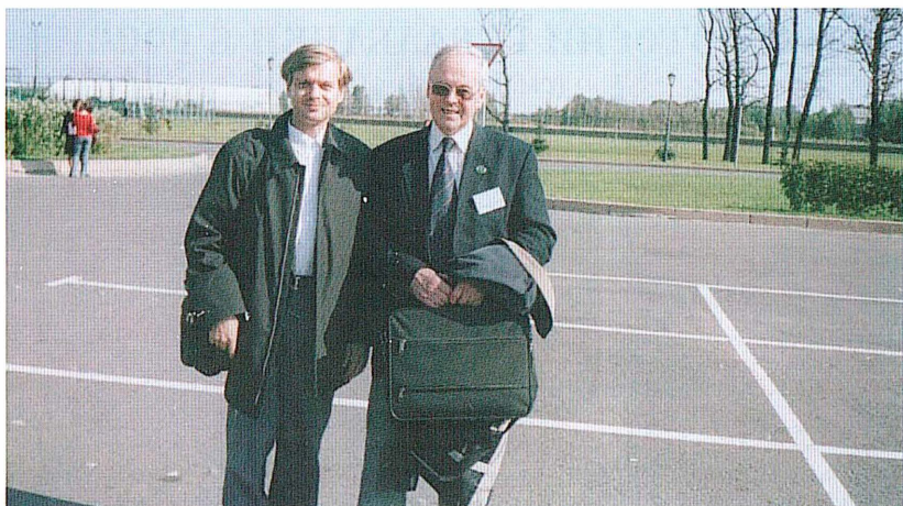
С известным геральдистом Стефаном Кучинским на XIV Международном Геральдическом коллоквиуме, 2005 г.