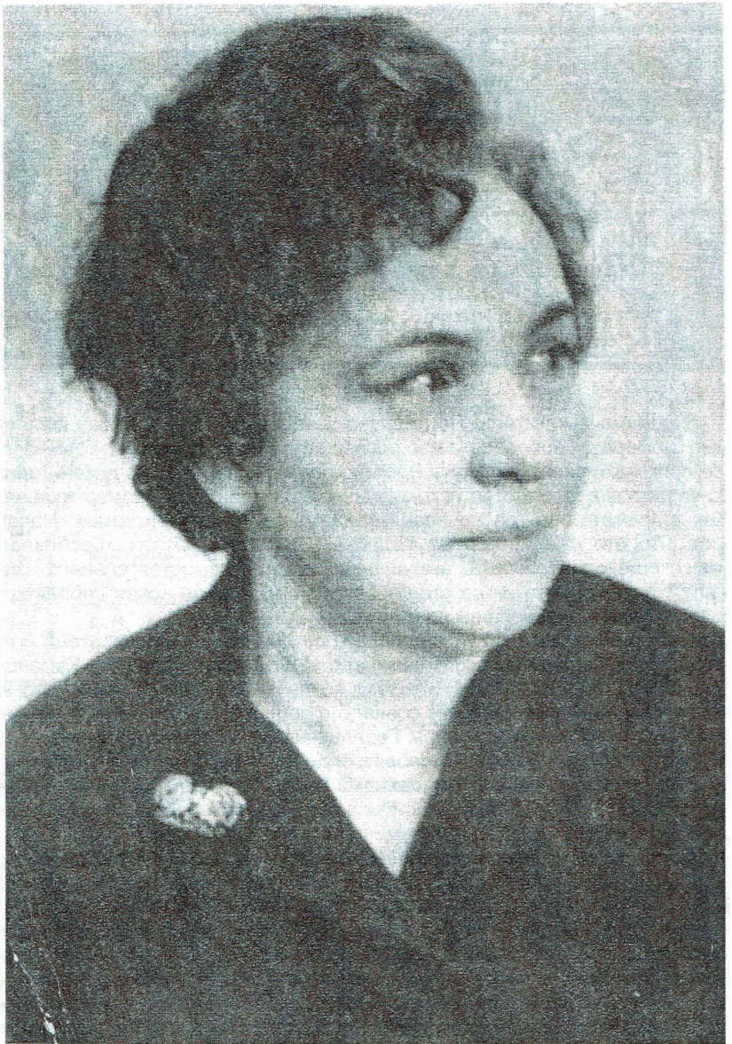
Елена Ивановна Каменцева. 2 октября 1920 - 6 декабря 2004.